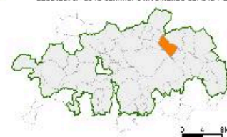
Carte des édifices publics.

Localisation de la commune inventoriée dans le Parc