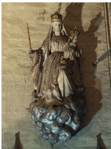
Vue générale de la statue seule IVR31_20106202051NUCA