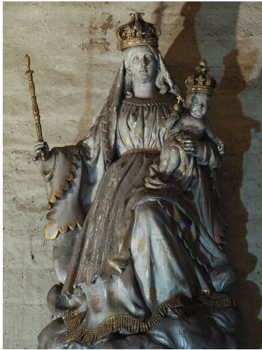
Vue partielle