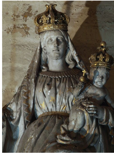
Vue partielle IVR31_20106202053NUCA