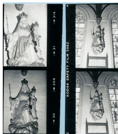
Vue générale IVR31_20106202060NUC