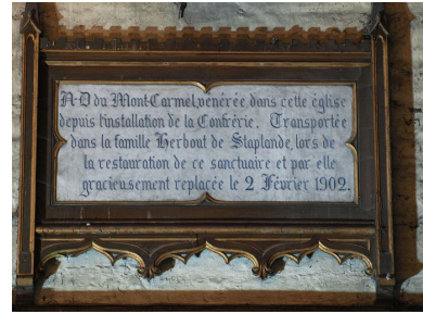
Inscription IVR31_20106202054NUCA