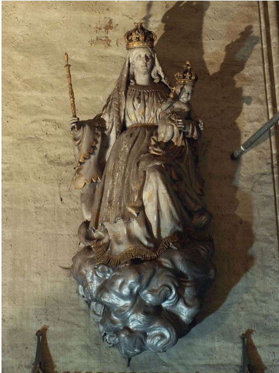
Vue générale de la statue seule