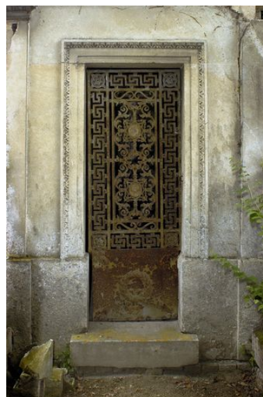
Vue de la porte en fonte. IVR22_20058001093NUCA