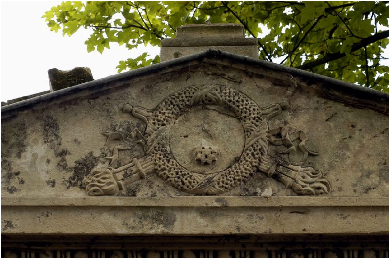
Vue du décor du fronton.