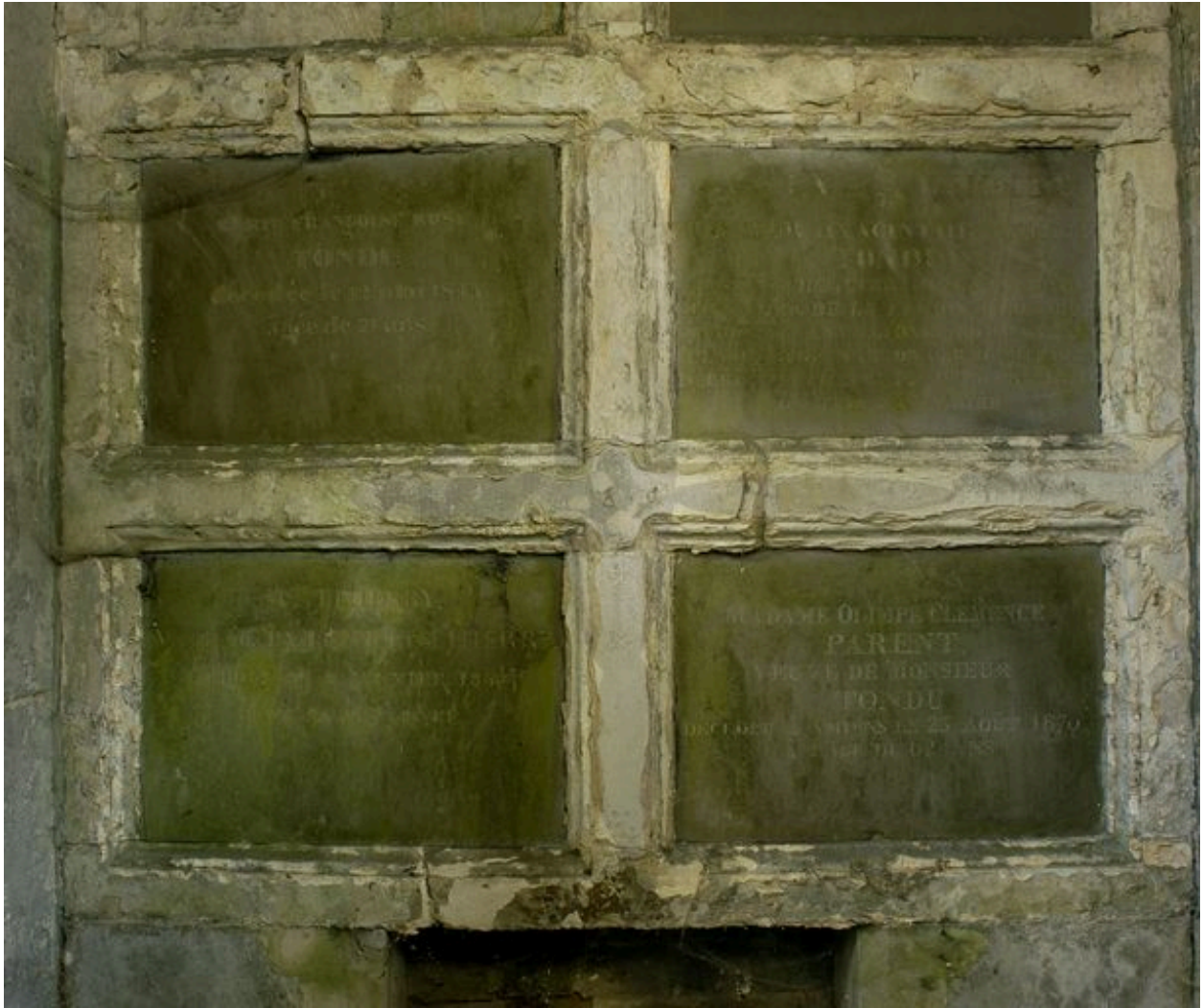
Vue des tables en marbre, à l'intérieur du tombeau.