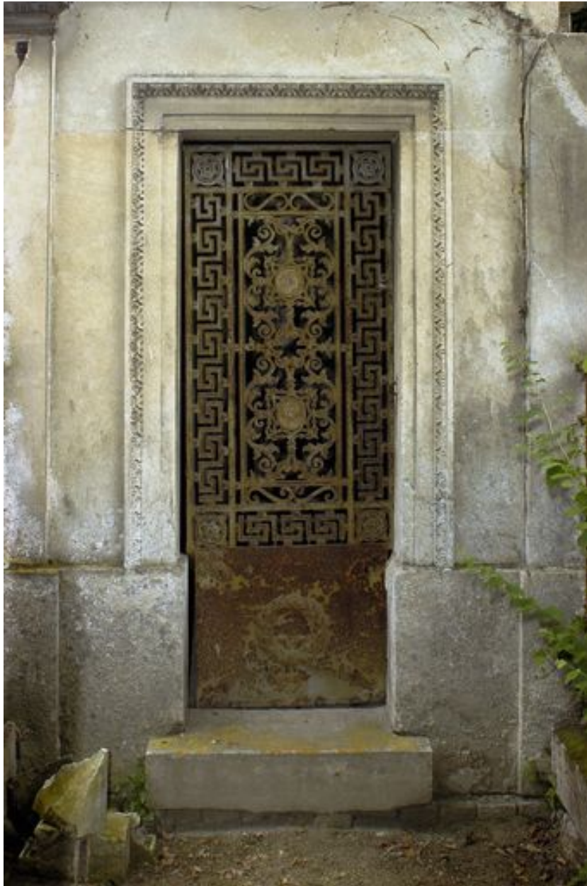
Vue de la porte en fonte.