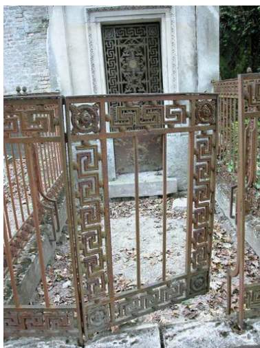
Vue de détail de la grille.