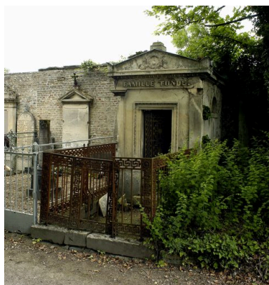
Vue générale. IVR22_20058001091NUCA