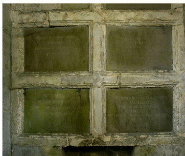
Vue des tables en marbre, à l'intérieur du tombeau.