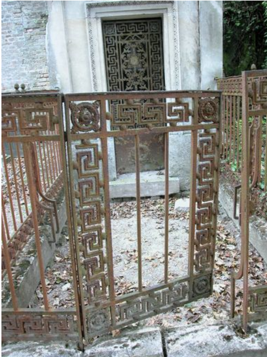
Vue de détail de la grille.