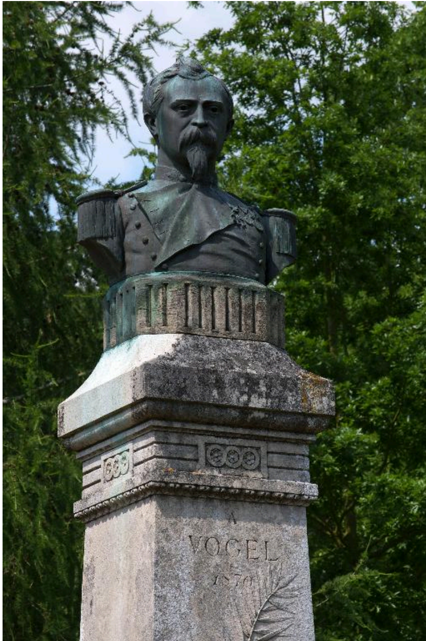
Vue de trois-quart.