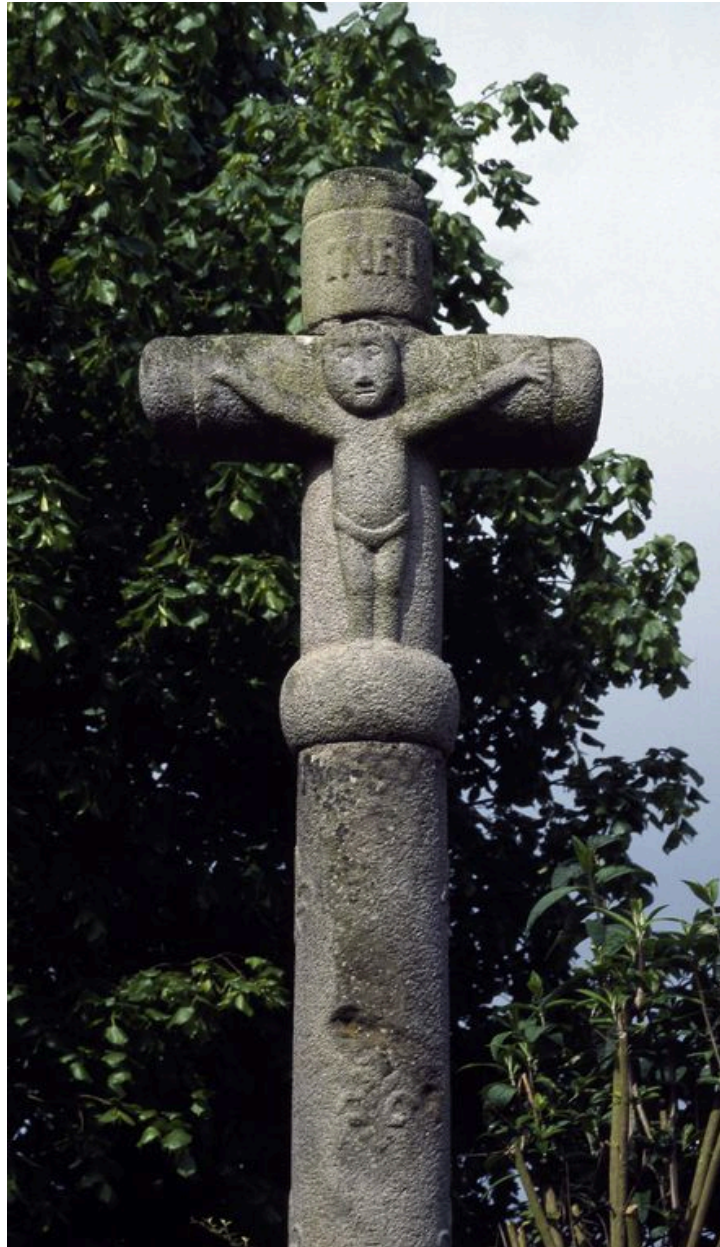
Vue du Christ en croix en partie supérieure.