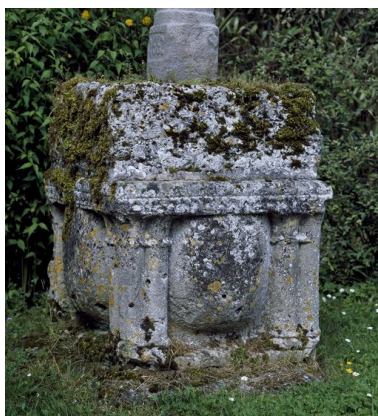
Vue du socle formé d'une ancienne cuve baptismale. IVR22_20098000202XA