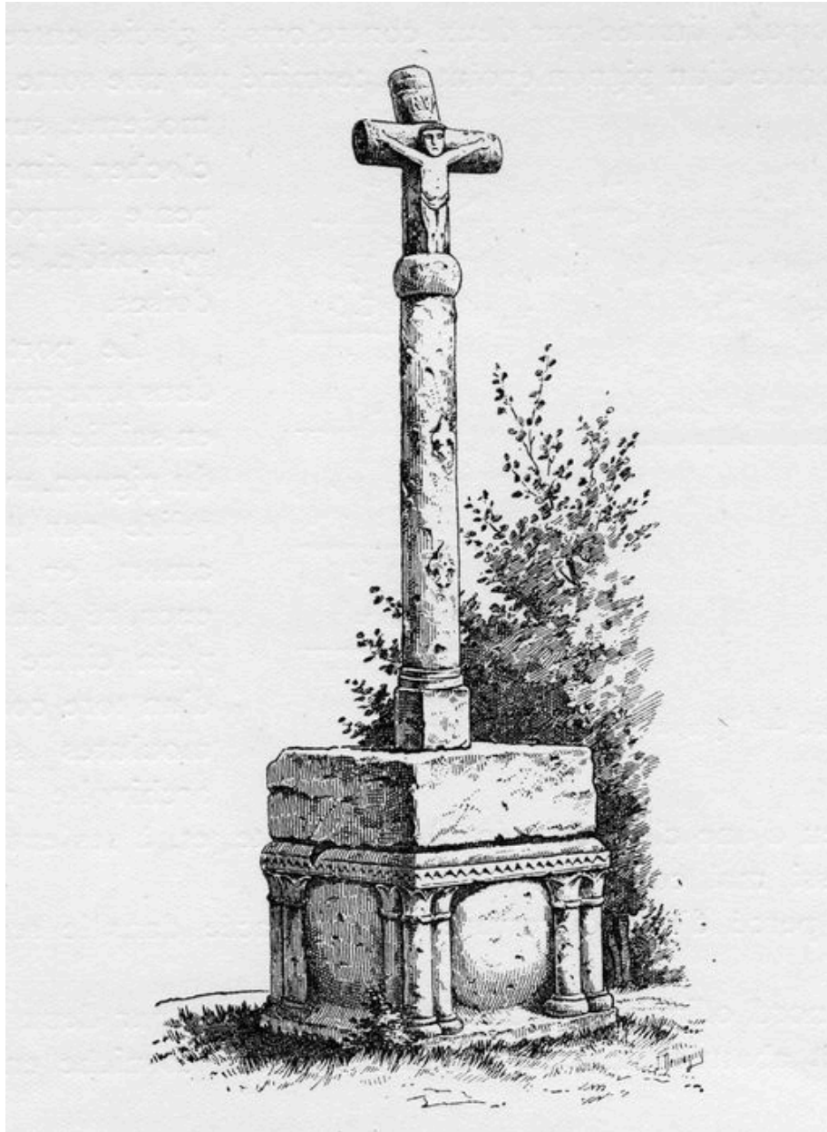
Vue générale d'après J. Demagny (La Picardie historique et monumentale).