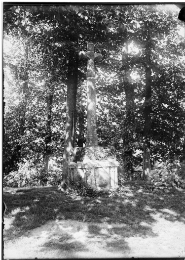
Vue générale, début du 20e siècle (AD Somme ; 14 Fi 28/17). IVR22_20088015148NUCA