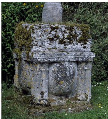
Vue du socle formé d'une ancienne cuve baptismale. IVR22_20098000202XA