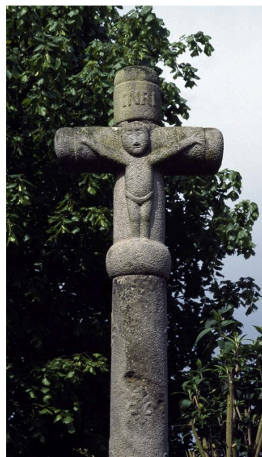
Vue du Christ en croix en partie supérieure. IVR22_20098000203XA