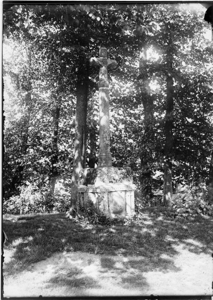
Vue générale, début du 20e siècle (AD Somme ; 14 Fi 28/17).