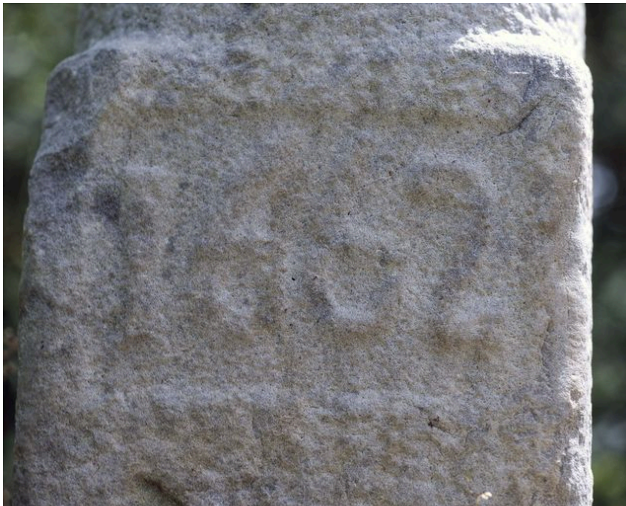
Détail de la date gravée en partie inférieure de la croix : 1662.