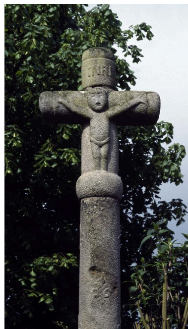
Vue du Christ en croix en partie supérieure. IVR22_20098000203XA