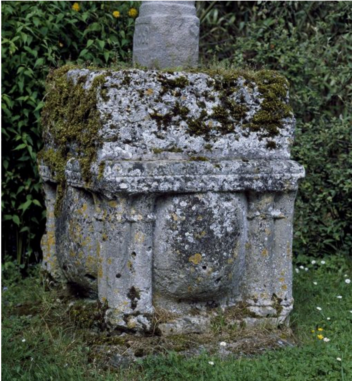
Vue du socle formé d'une ancienne cuve baptismale.