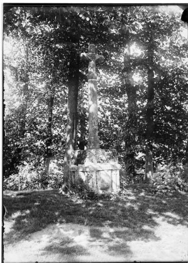
Vue générale, début du 20e siècle (AD Somme ; 14 Fi 28/17). IVR22_20088015148NUCA