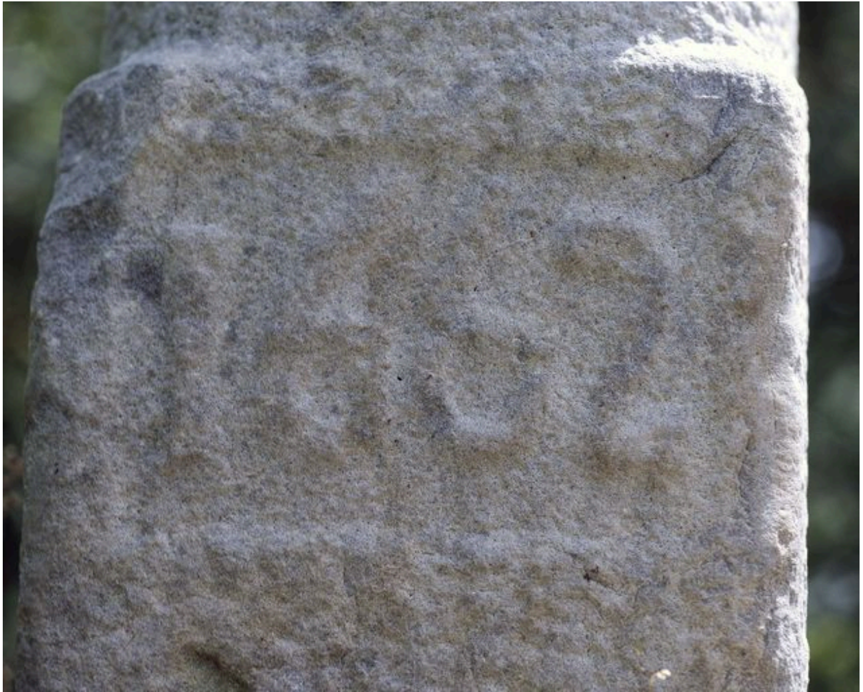
Détail de la date gravée en partie inférieure de la croix : 1662.