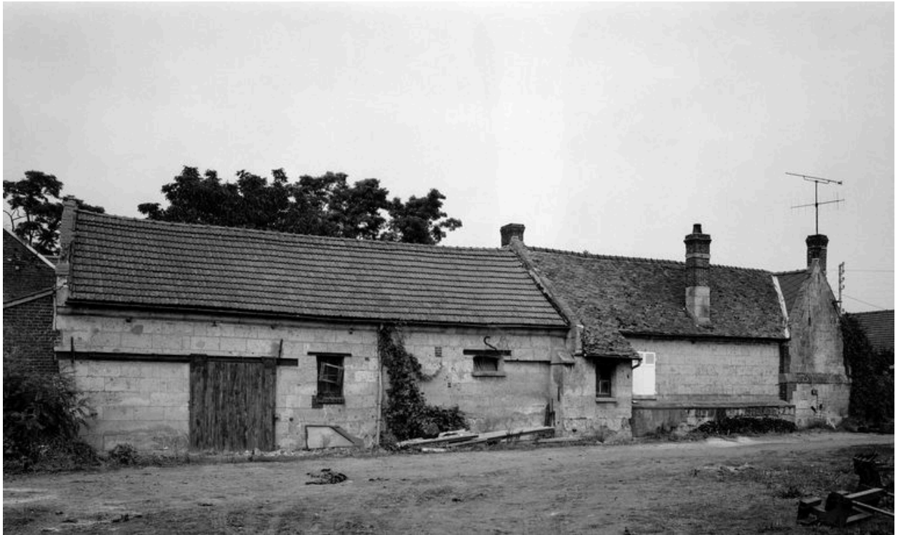
Second logis, four et étables. Élévation postérieure.