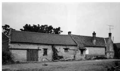
Second logis, four et étables. Elévation postérieure. IVR22_19846001104X