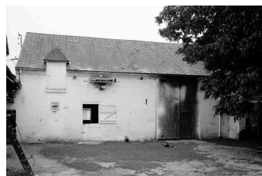
Etable et grange en fond de cour. Elévation antérieure. IVR22_19846001159X