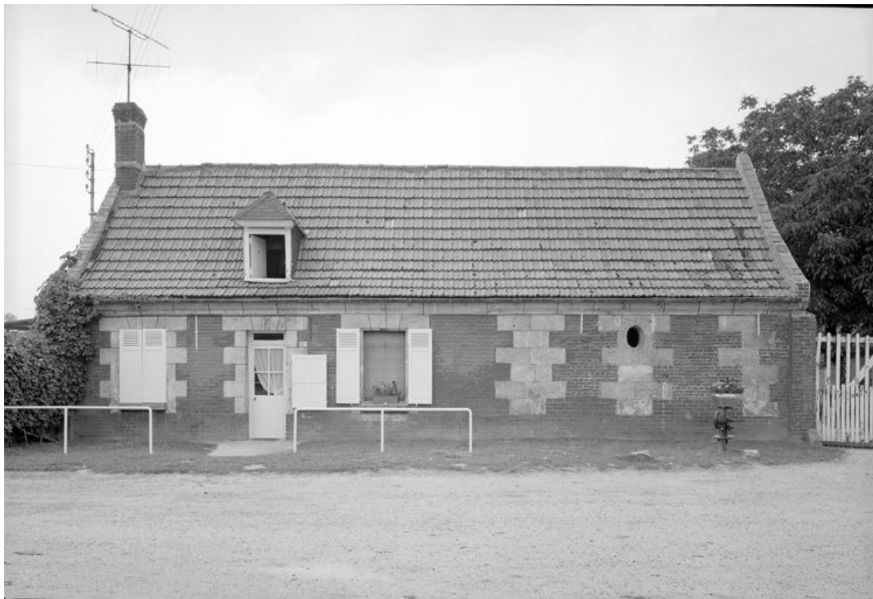
Logis sur rue. Élévation antérieure.