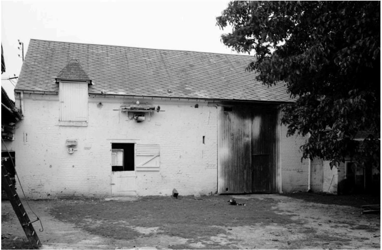
Etable et grange en fond de cour. Elévation antérieure.