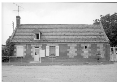
Logis sur rue. Elévation antérieure.