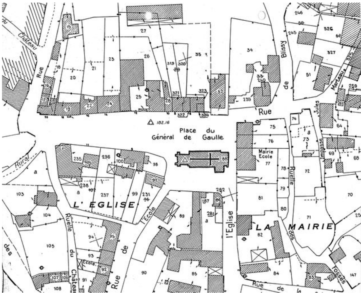
Plan de situation. Extrait du plan cadastral de 1986, section A.