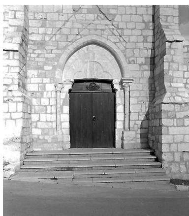
Portail occidental.