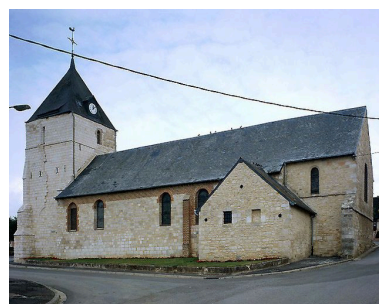
Elévation sud.