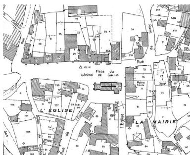
Plan de situation. Extrait du plan cadastral de 1986, section A. IVR22_20080290148NUCA