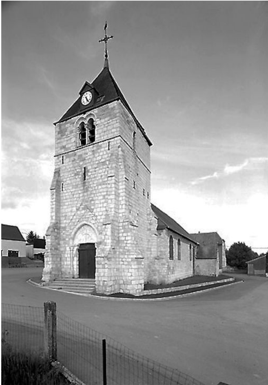
Vue depuis le sud-ouest.