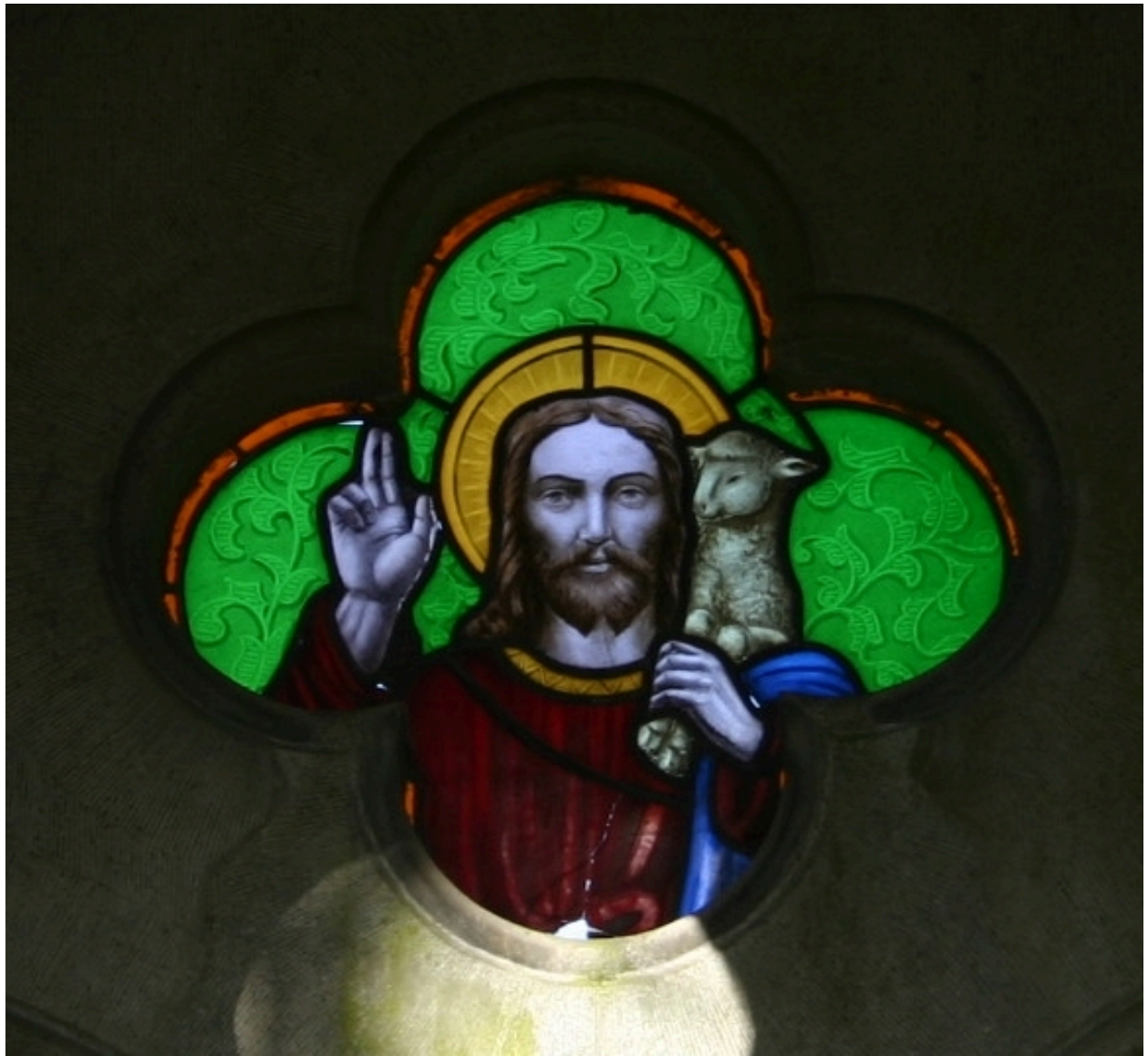
Verrière représentant le Christ bénissant, portant l'agneau sur son épaule.