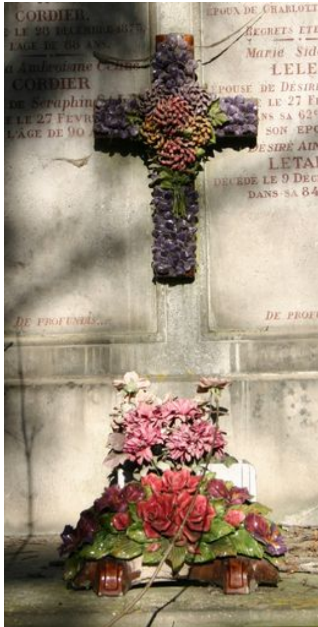
Détail du décor suspendu en barbotine.