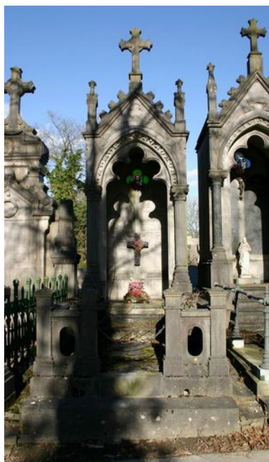
Vue générale. IVR22_20088000382NUCA