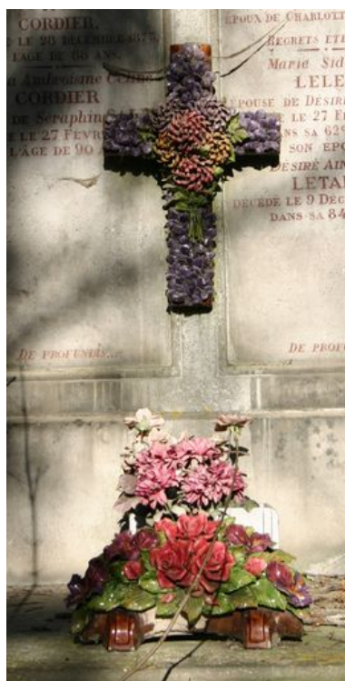
Détail du décor suspendu en barbotine.