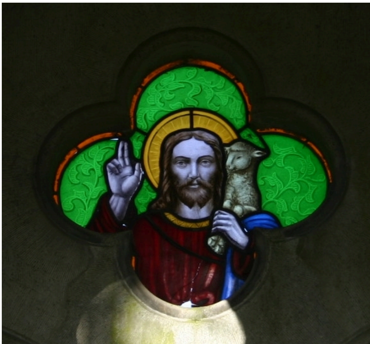
Verrière représentant le Christ bénissant, portant l'agneau sur son épaule.