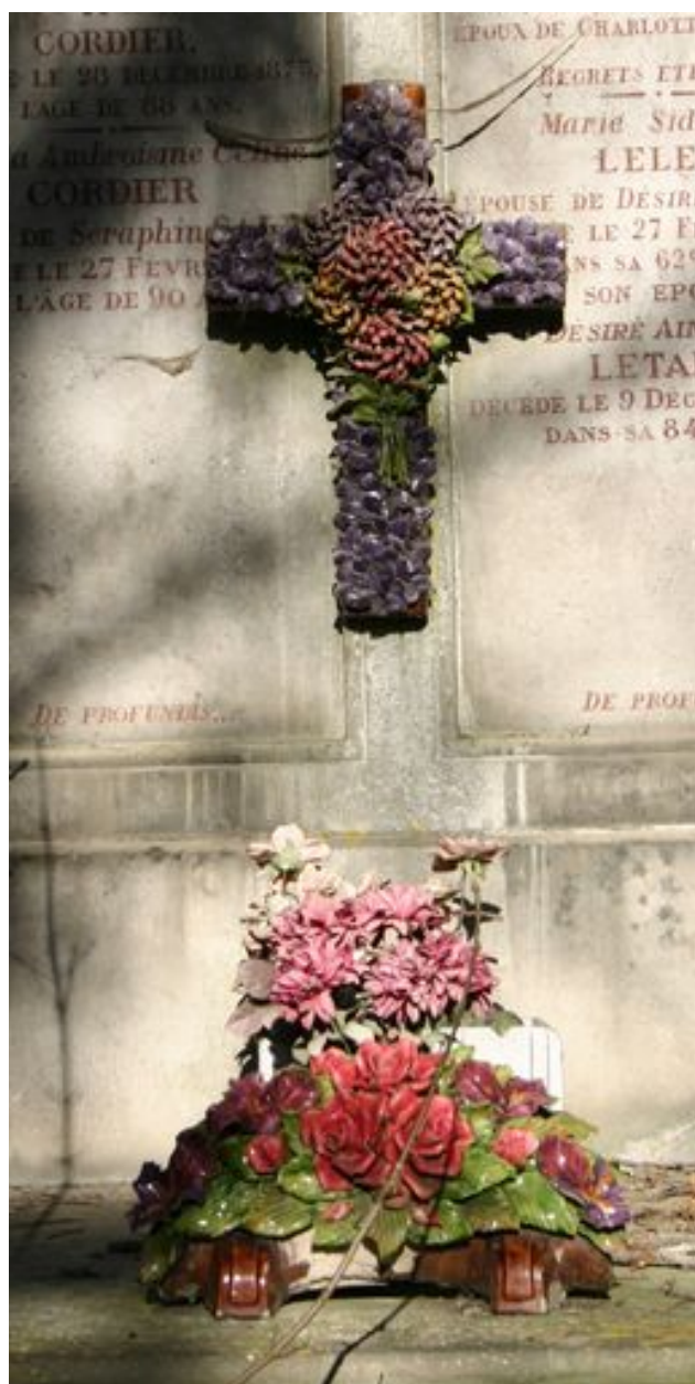
Détail du décor suspendu en barbotine.