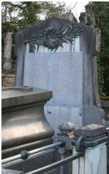
Stèle funéraire, vers 1907.