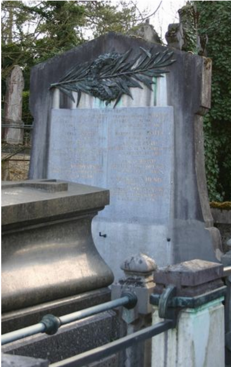
Stèle funéraire, vers 1907.