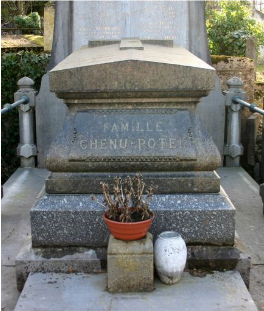
Tombeau en forme de sarcophage.