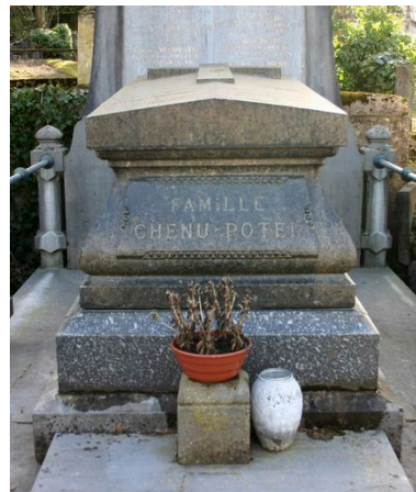
Tombeau en forme de sarcophage. IVR22_20088000421NUCA