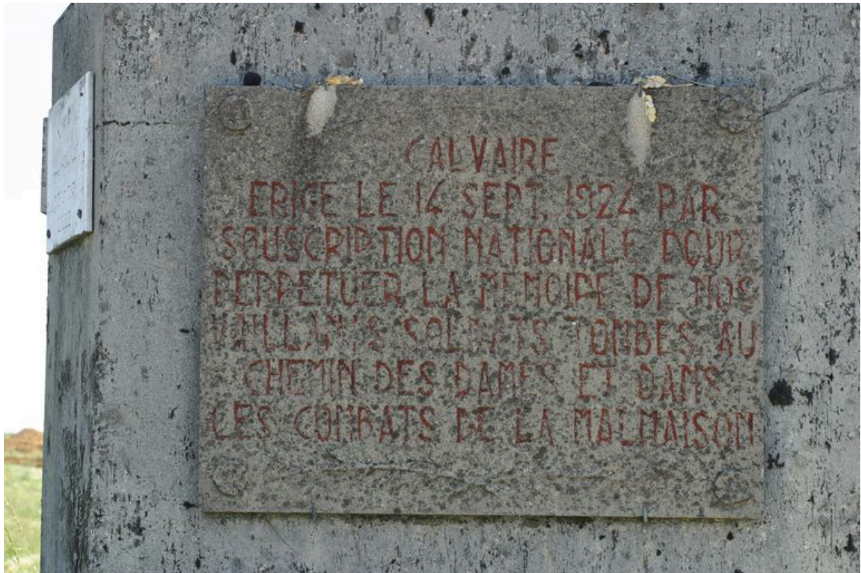
Vue d'une plaque commémorative.