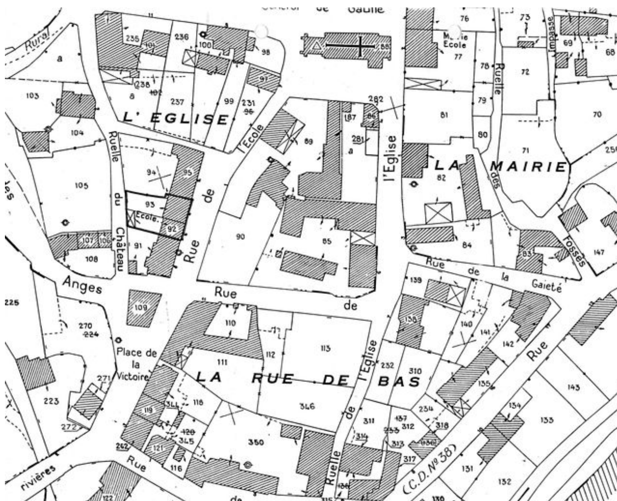
Plan de situation. Extrait du plan cadastral de 1986, section A.