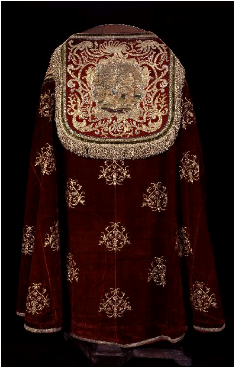
Vue du dos de la première chape.