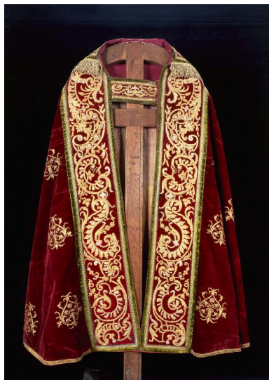
Vue du devant de la deuxième chape. IVR22_19956000929XA