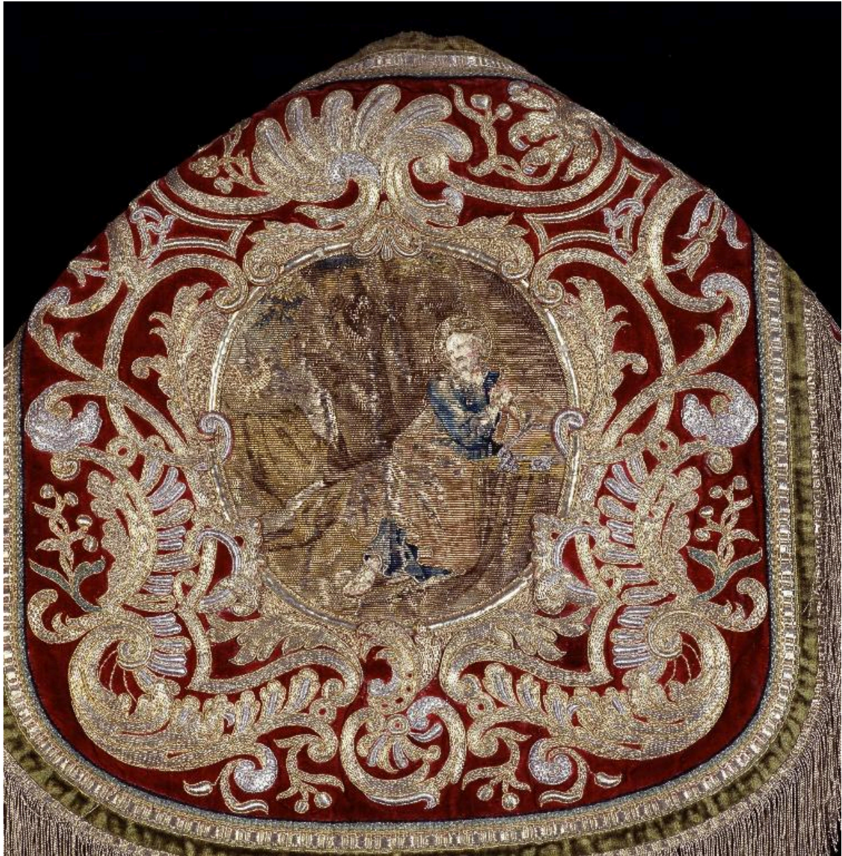
Détail du chaperon de la troisième chape : le Repentir de saint Pierre.