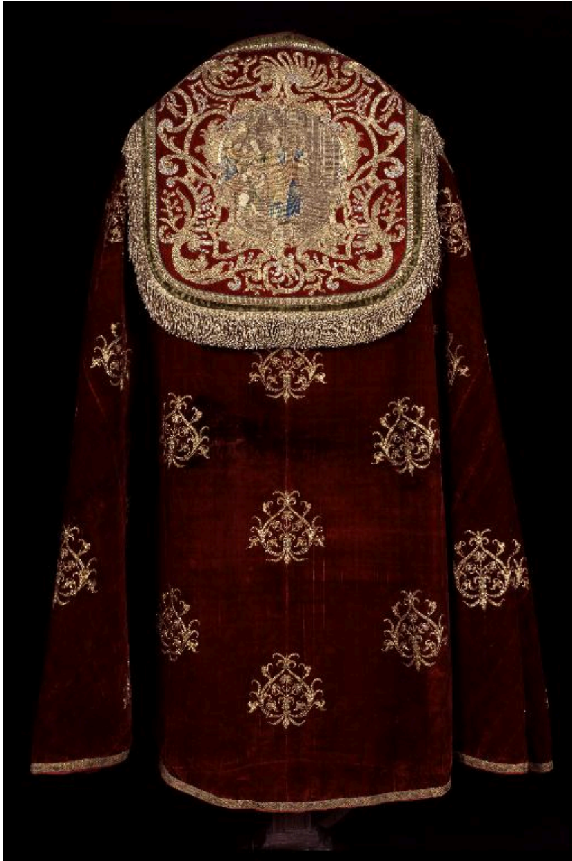
Vue du dos de la deuxième chape.