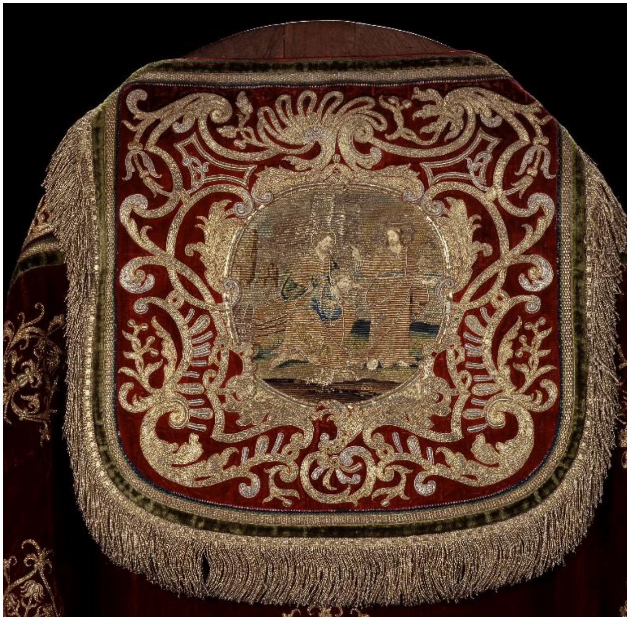
Détail du chaperon de la première chape : la Vocation de saint Pierre.