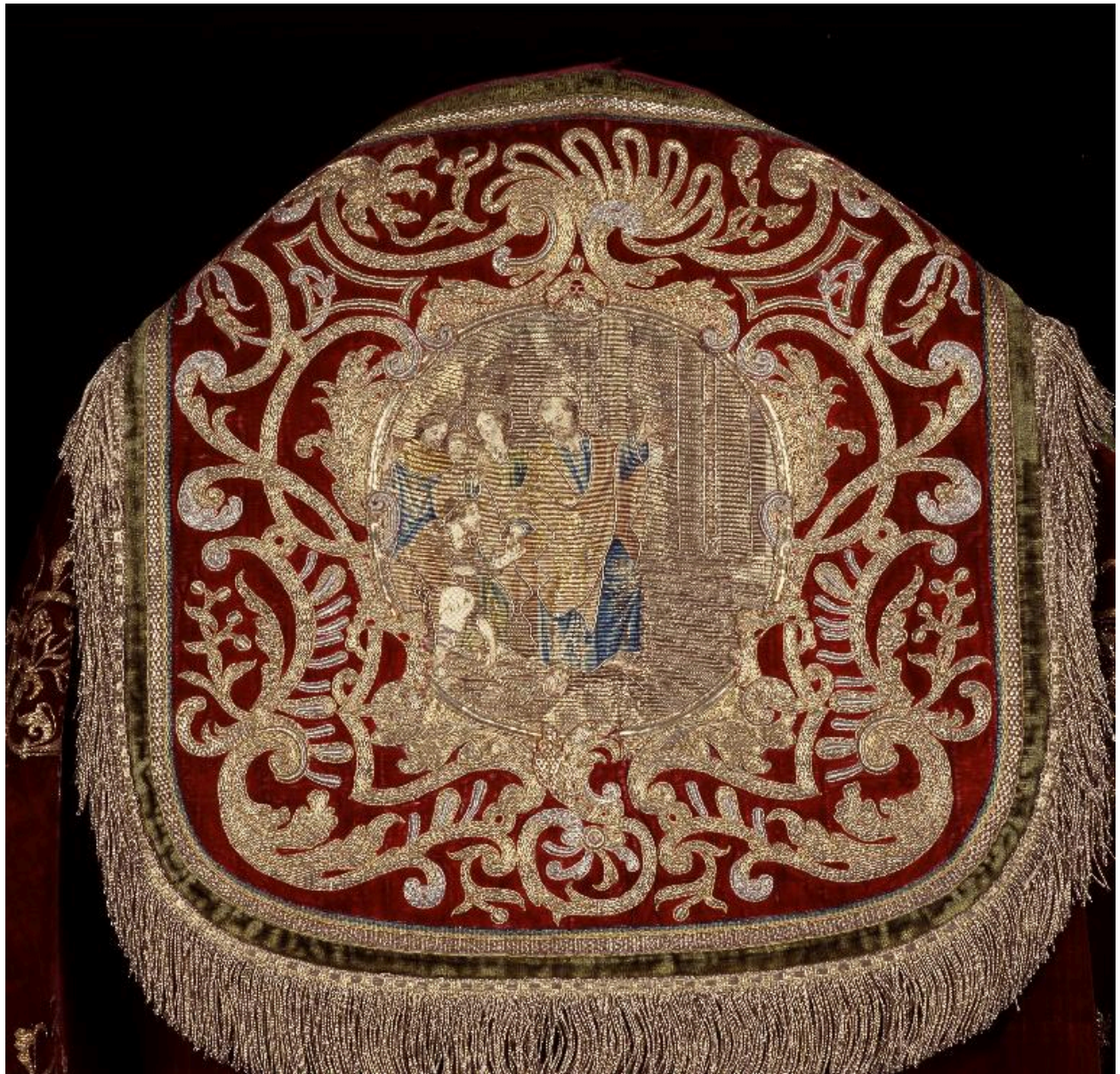
Détail du chaperon de la deuxième chape : la Guérison du boiteux.