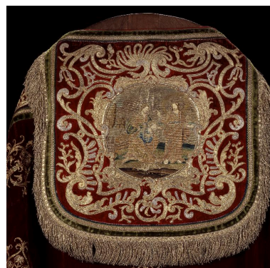
Détail du chaperon de la première chape : la Vocation de saint Pierre. IVR22_19956000927XA