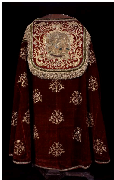
Vue du dos de la première chape. IVR22_19956000925XA