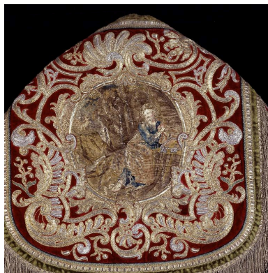
Détail du chaperon de la troisième chape : le Repentir de saint Pierre.