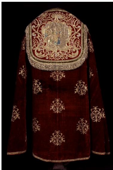
Vue du dos de la deuxième chape. IVR22_19956000931XA