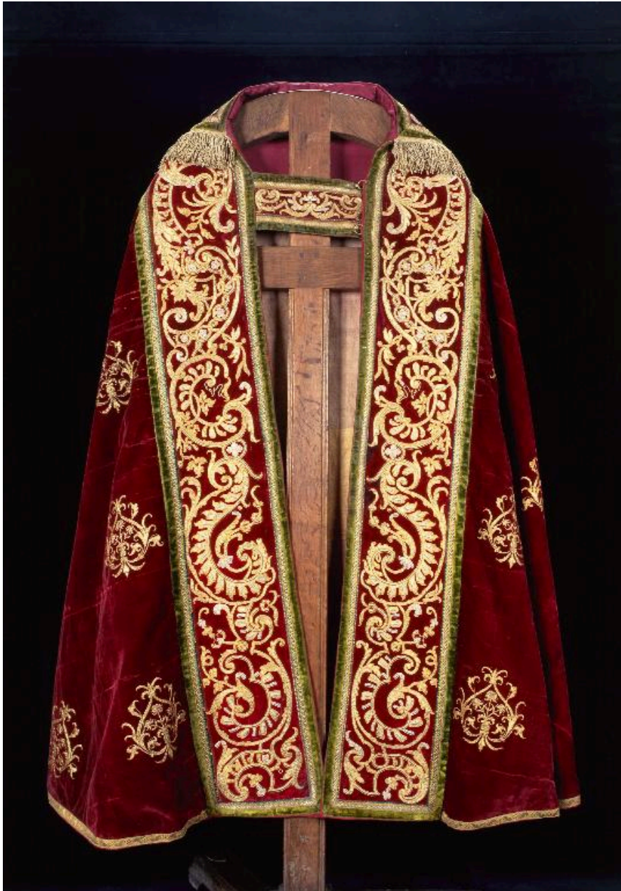
Vue du devant de la deuxième chape.