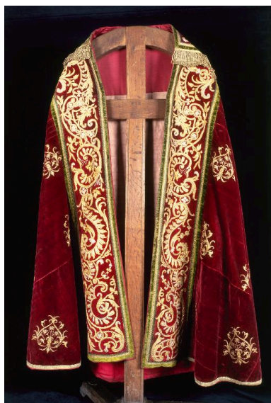
Vue du devant de la première chape.