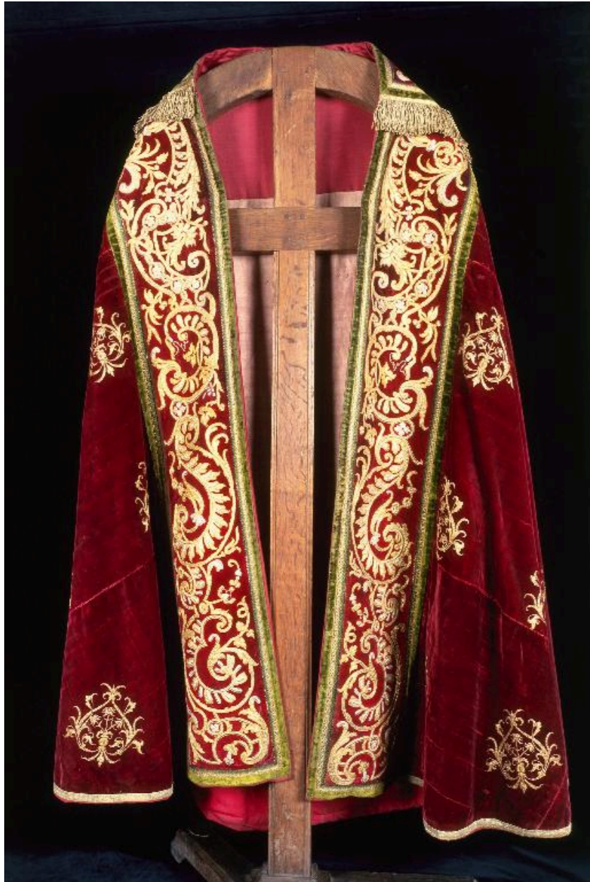
Vue du devant de la première chape.