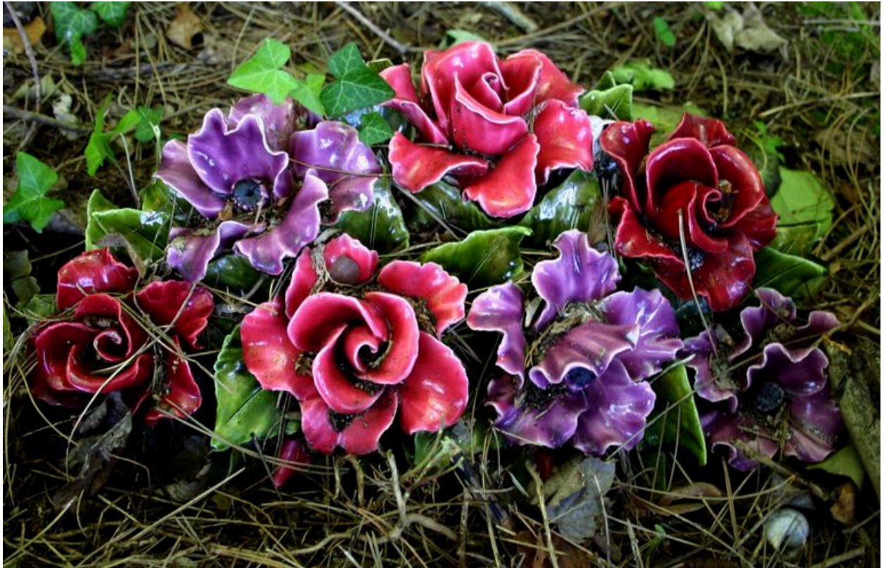
Décor de roses en barbotine.