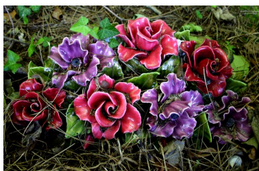
Décor de roses en barbotine.