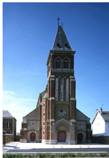
Élévation antérieure. IVR22_20048000136VA