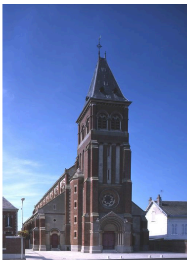
Vue d'ensemble. IVR22_20048000137VA