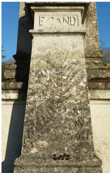
Monument sépulcral d'Edouard Gand : vue de détail (pilier).

IVR22_20148000167NUC2A