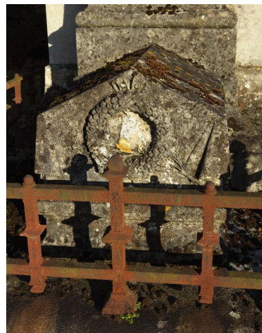
Monument sépulcral d'Edouard Gand, vue de détail sur la partie inférieure : tombale en forme de catafalque.

IVR22_20148000170NUC2A