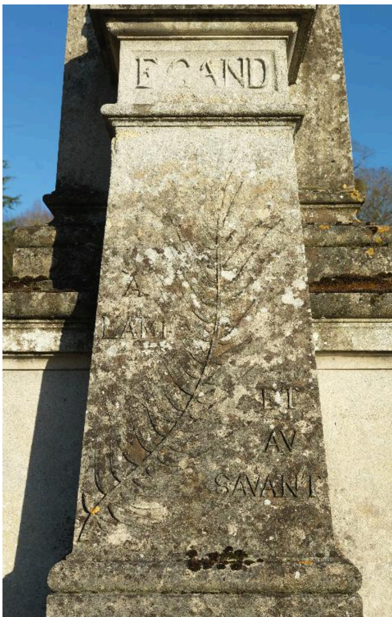
Monument sépulcral d'Edouard Gand : vue de détail (pilier).