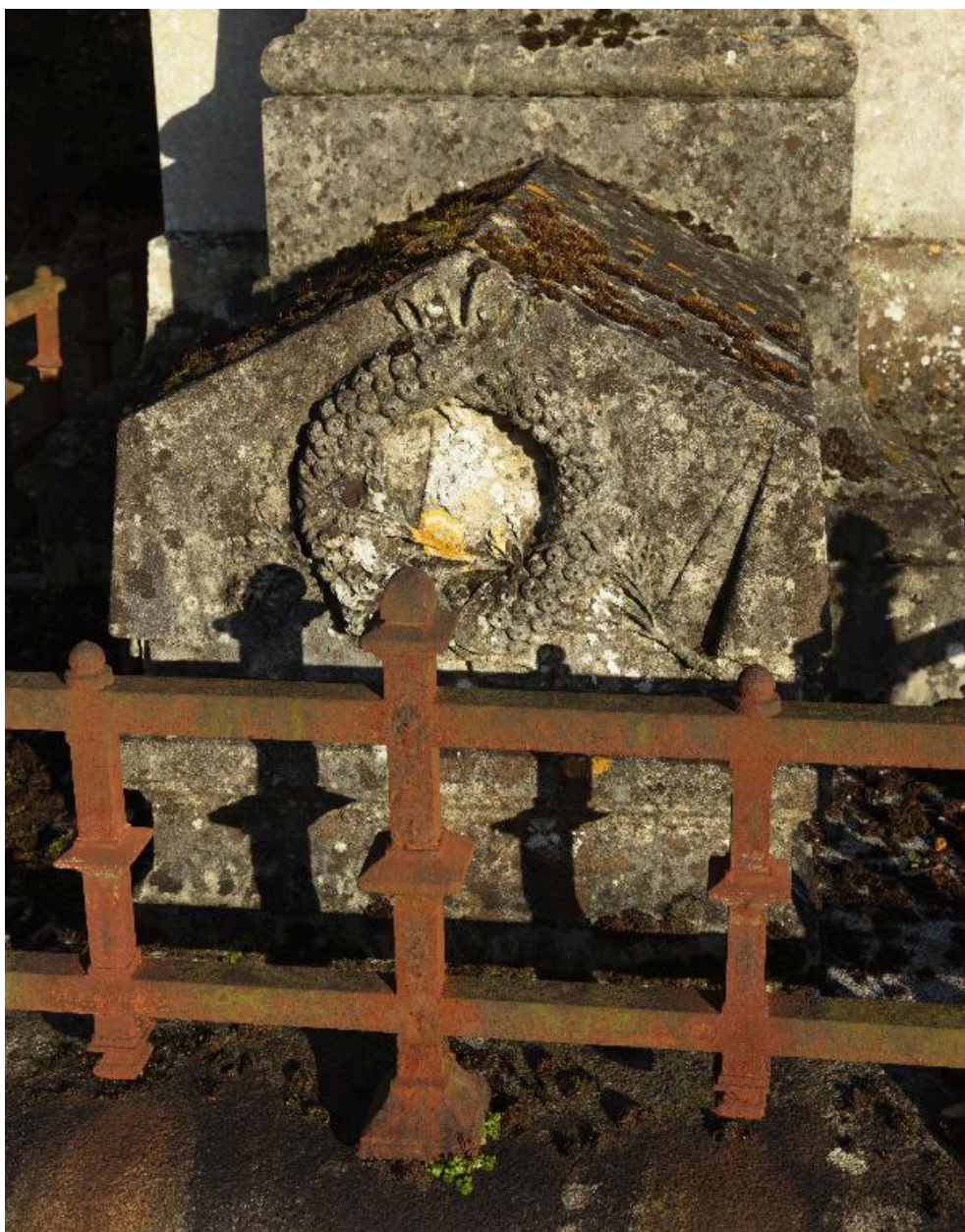
Monument sépulcral d'Edouard Gand, vue de détail sur la partie inférieure : tombale en forme de catafalque.