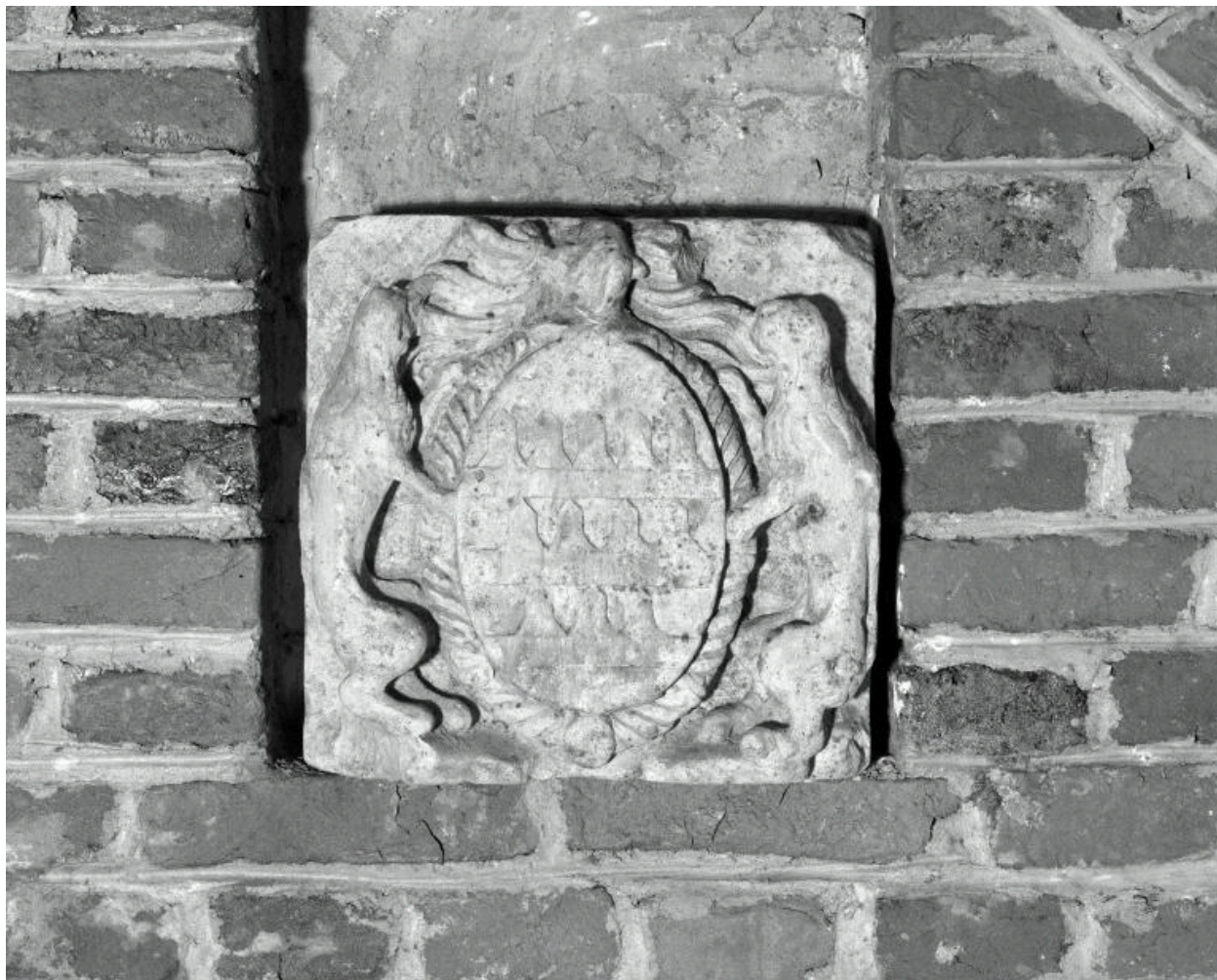
Vue des armoiries de Jacques II.