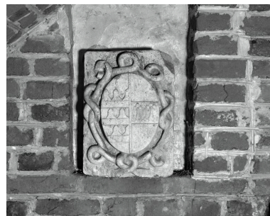
Vue des armoiries de la femme et veuve de Jacques II.