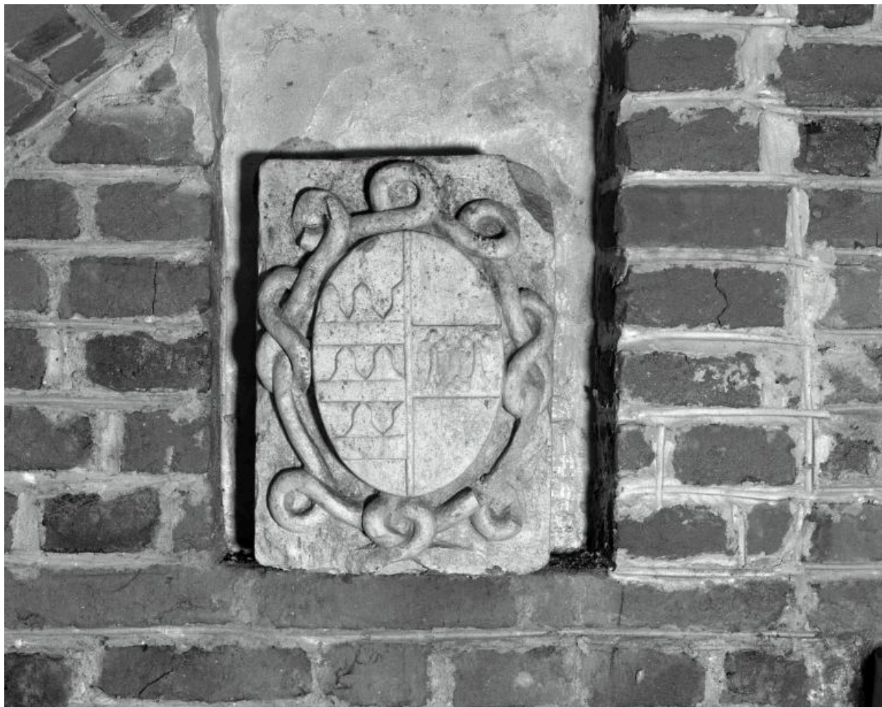
Vue des armoiries de la femme et veuve de Jacques II.