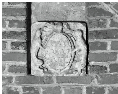
Vue des armoiries de Jacques II. IVR22_19990202427X