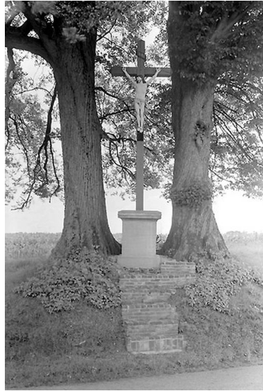
Vue générale. IVR22_19980202918X