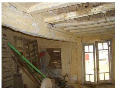
Vue intérieure de l'atelier.