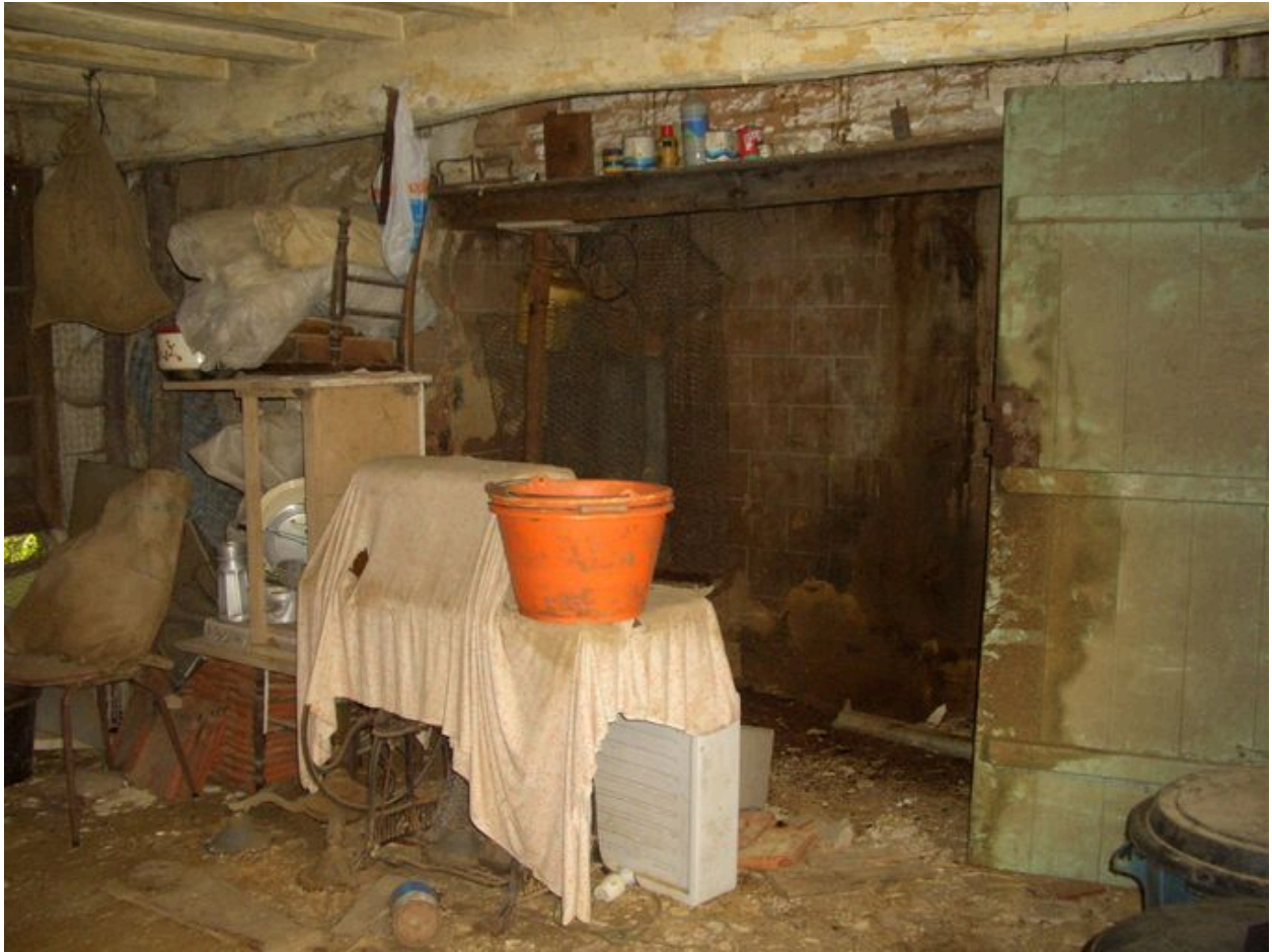
Vue de la cheminée de la salle commune.