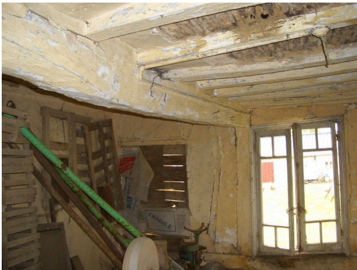
Vue intérieure de l'atelier.