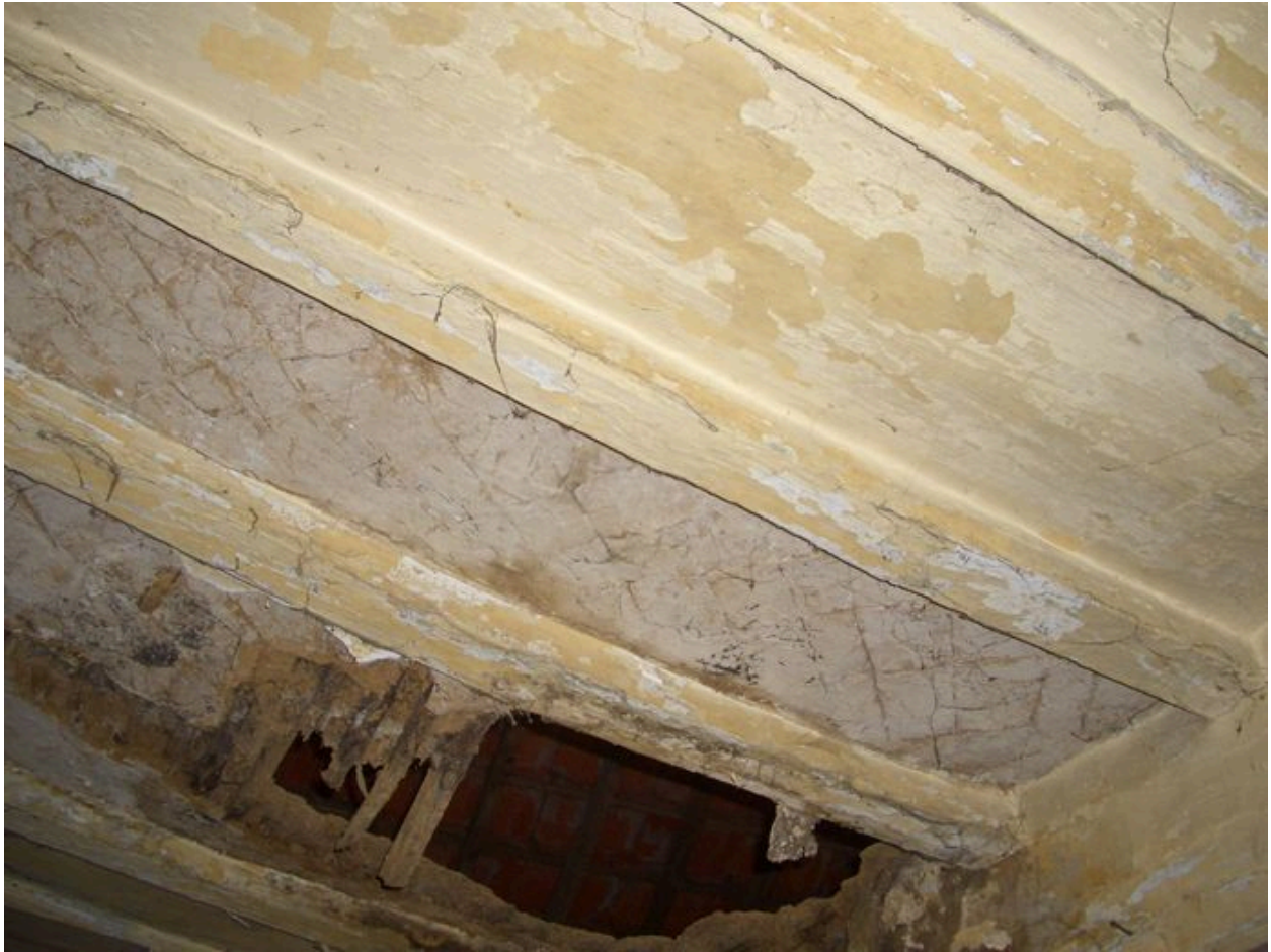
Détail du plafond de la salle commune.