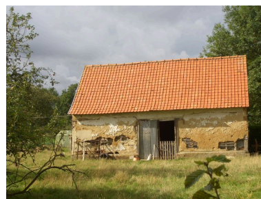
Vue de la grange.