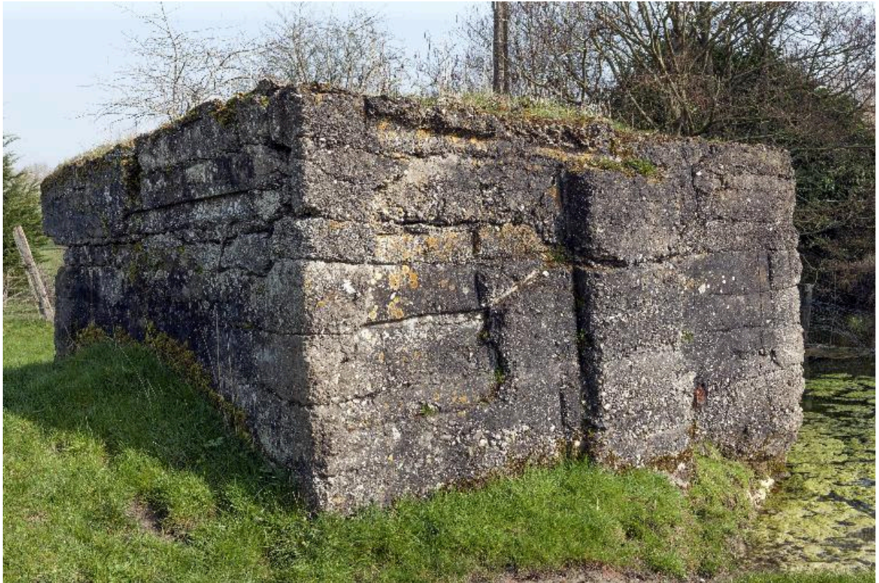
Vue de trois-quarts vers le sud-est