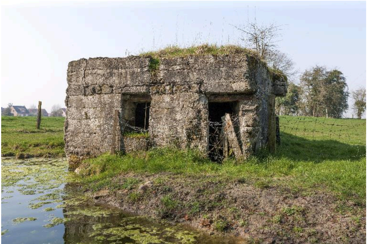
Vue de trois-quarts vers le nord-ouest