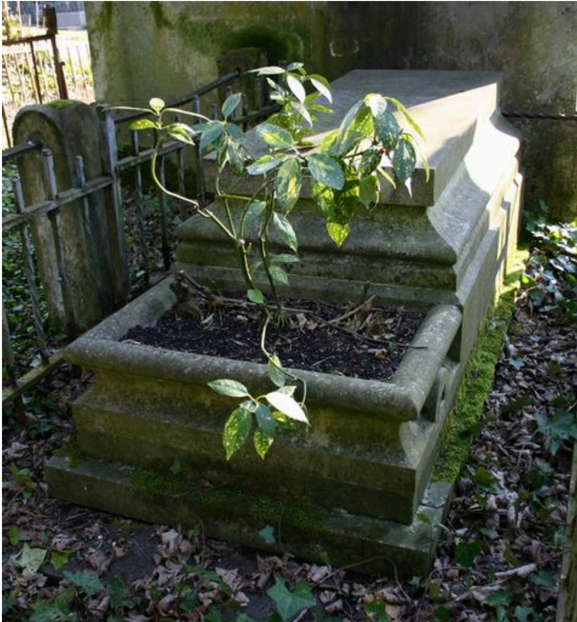
Tombeau en forme de sarcophage, J.-B. et A. Sallé, 1909.