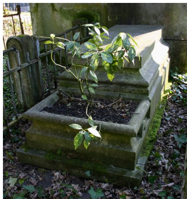
Tombeau en forme de sarcophage, J.-B. et A. Sallé, 1909.