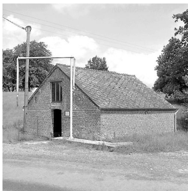
Vue générale. IVR22_20020200443X