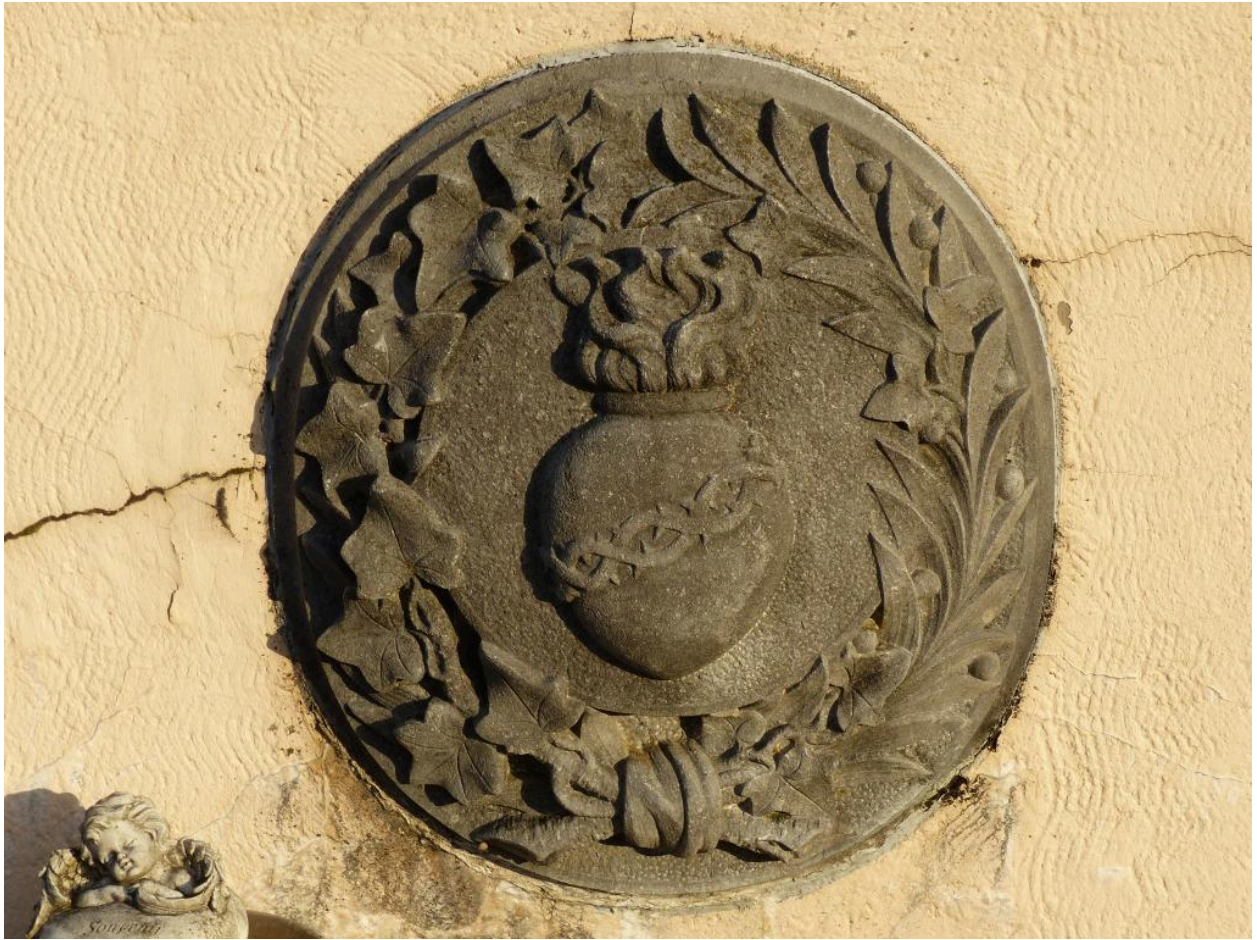
Décor sculpté en pierre d'Ecaussine fixé sur la base de la croix.