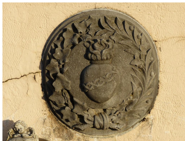
Décor sculpté en pierre d'Ecaussine fixé sur la base de la croix.