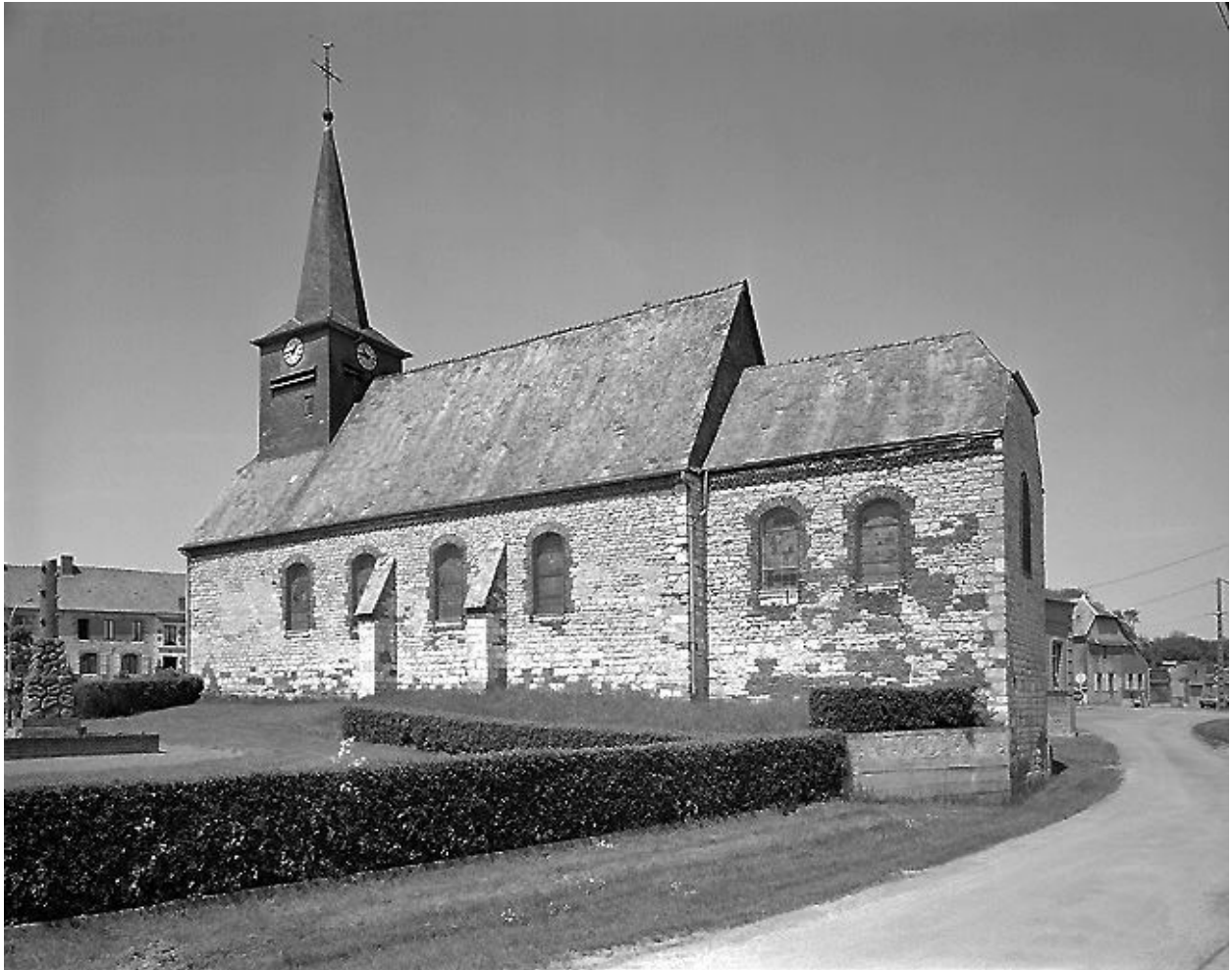
Nef et choeur depuis le sud-est.