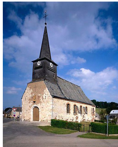
Façade occidentale, vue depuis le sud-est.