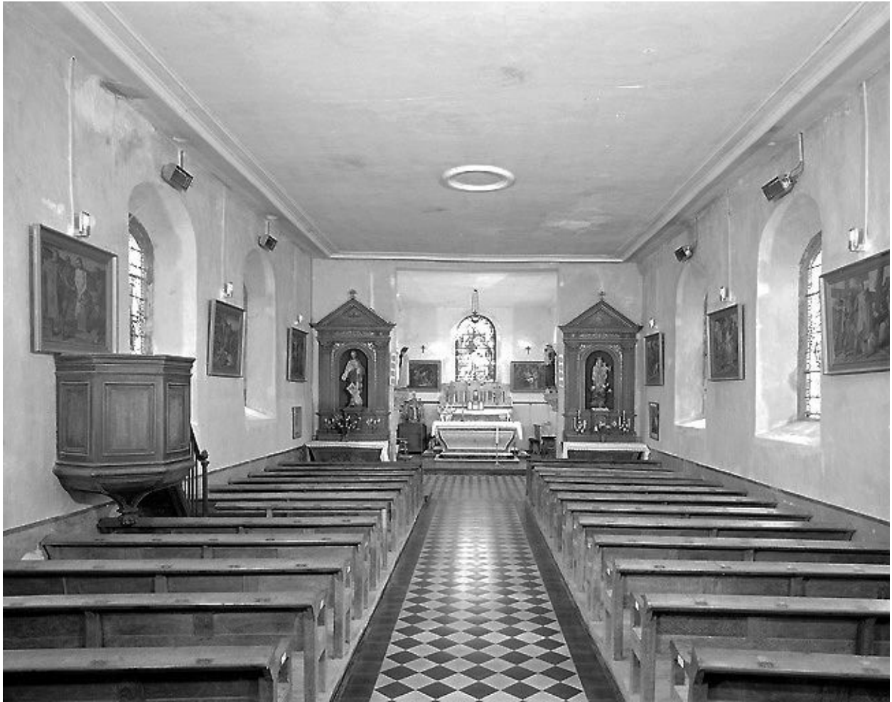
Vue intérieure de la nef vers le chœur.