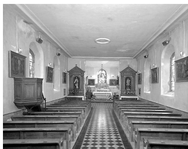
Vue intérieure de la nef vers le chœur. IVR22_20020200454V