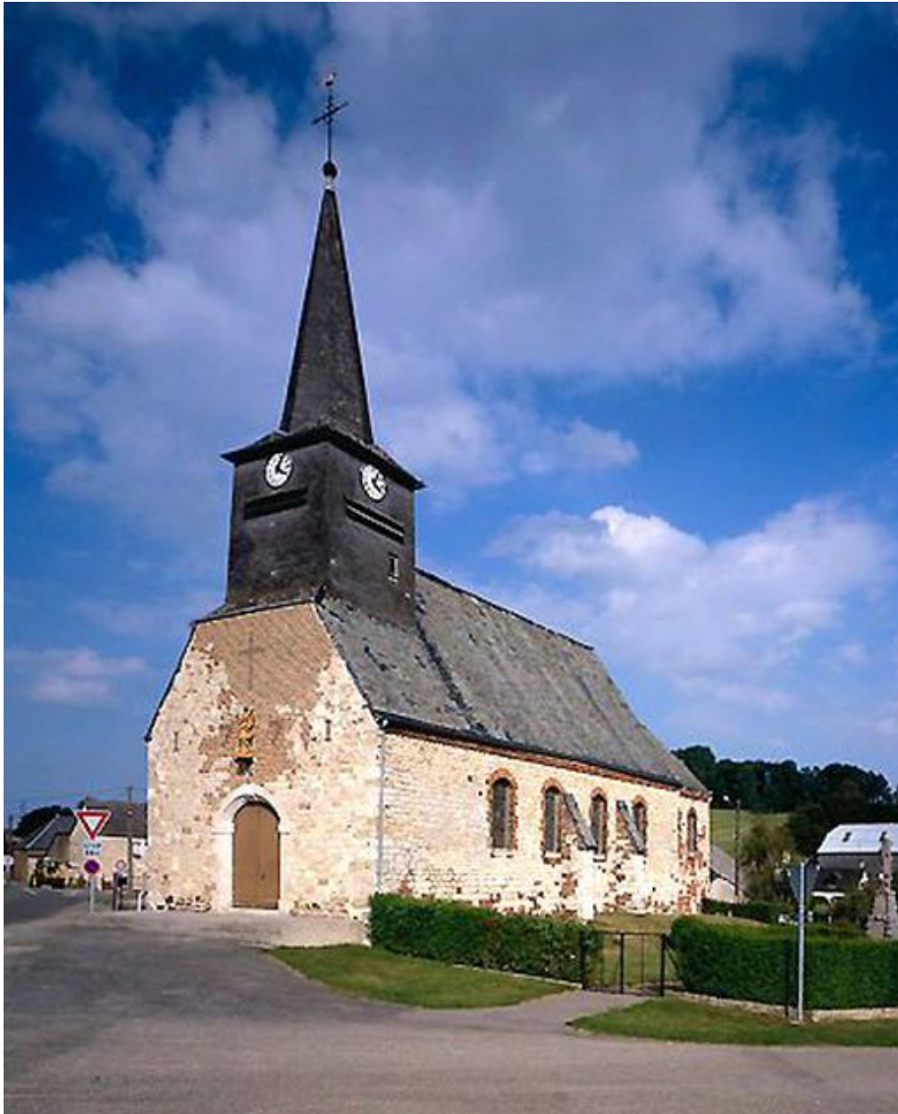
Façade occidentale, vue depuis le sud-est.