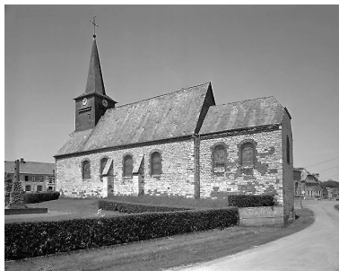
Nef et chœur depuis le sud-est. IVR22_20010201709V