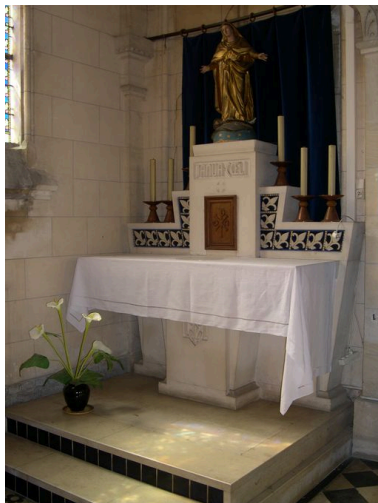
L'autel du bas-côté ouest.