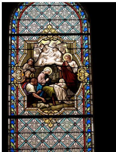
Verrière du bas-côté ouest : l'Adoration des Bergers.