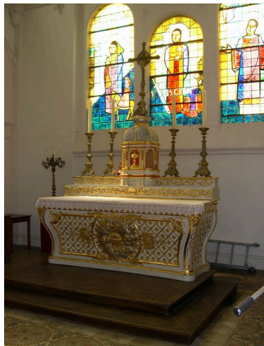
Le maître-autel et les vitraux du chœur.