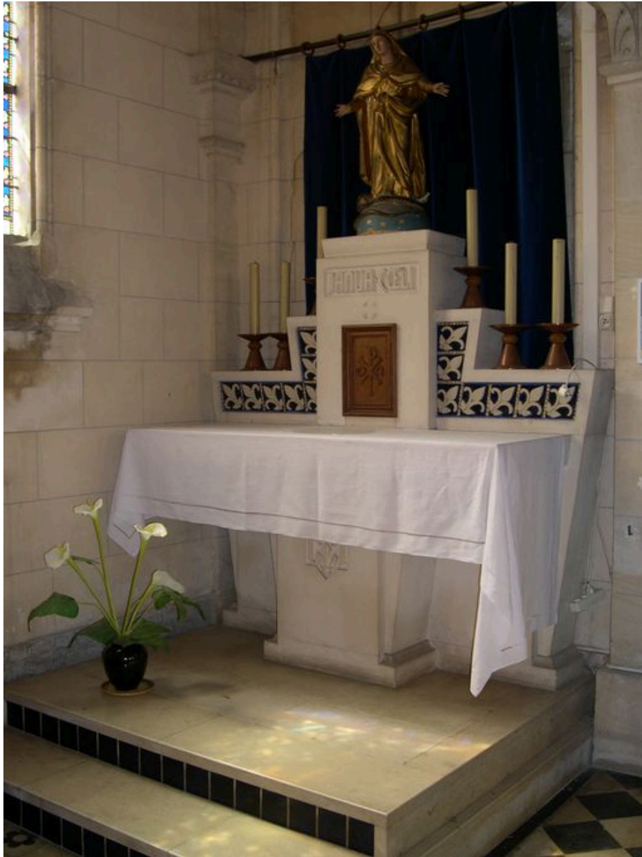
L'autel du bas-côté ouest.