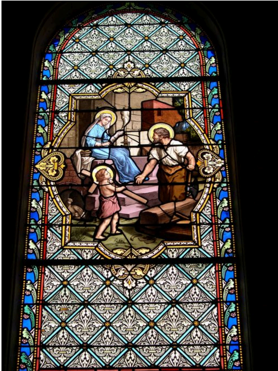
Verrière du bas-côté est : la Sainte Famille.