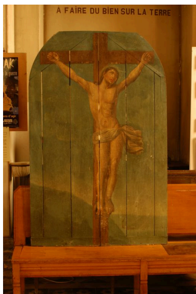
Tableau : Christ en croix. IVR22_20038000419NUCA