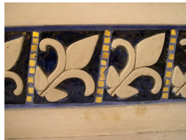
L'autel du bas-côté ouest : détail sur le décor de faïence. IVR22_20038010357NUCA