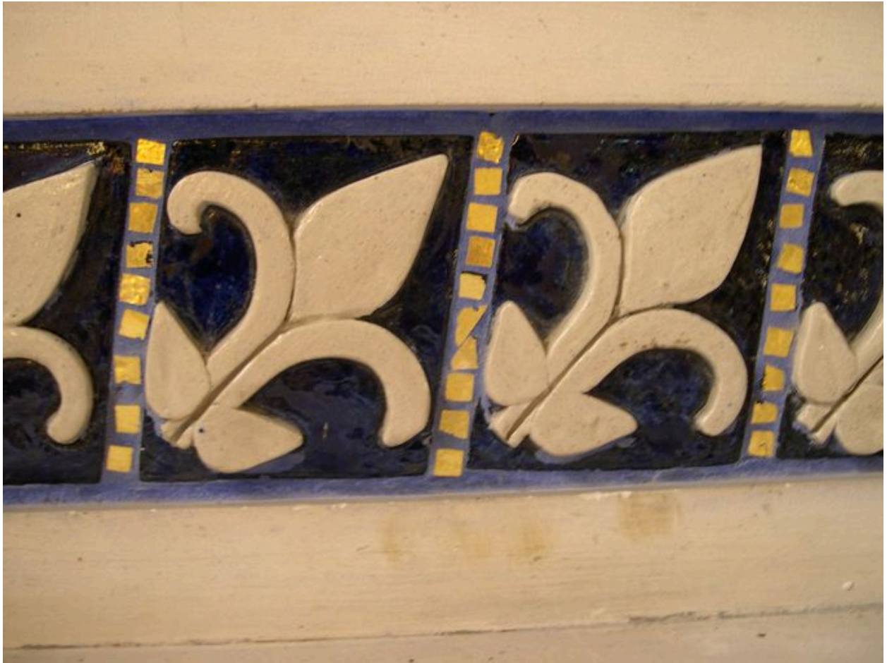
L'autel du bas-côté ouest : détail sur le décor de faïence.