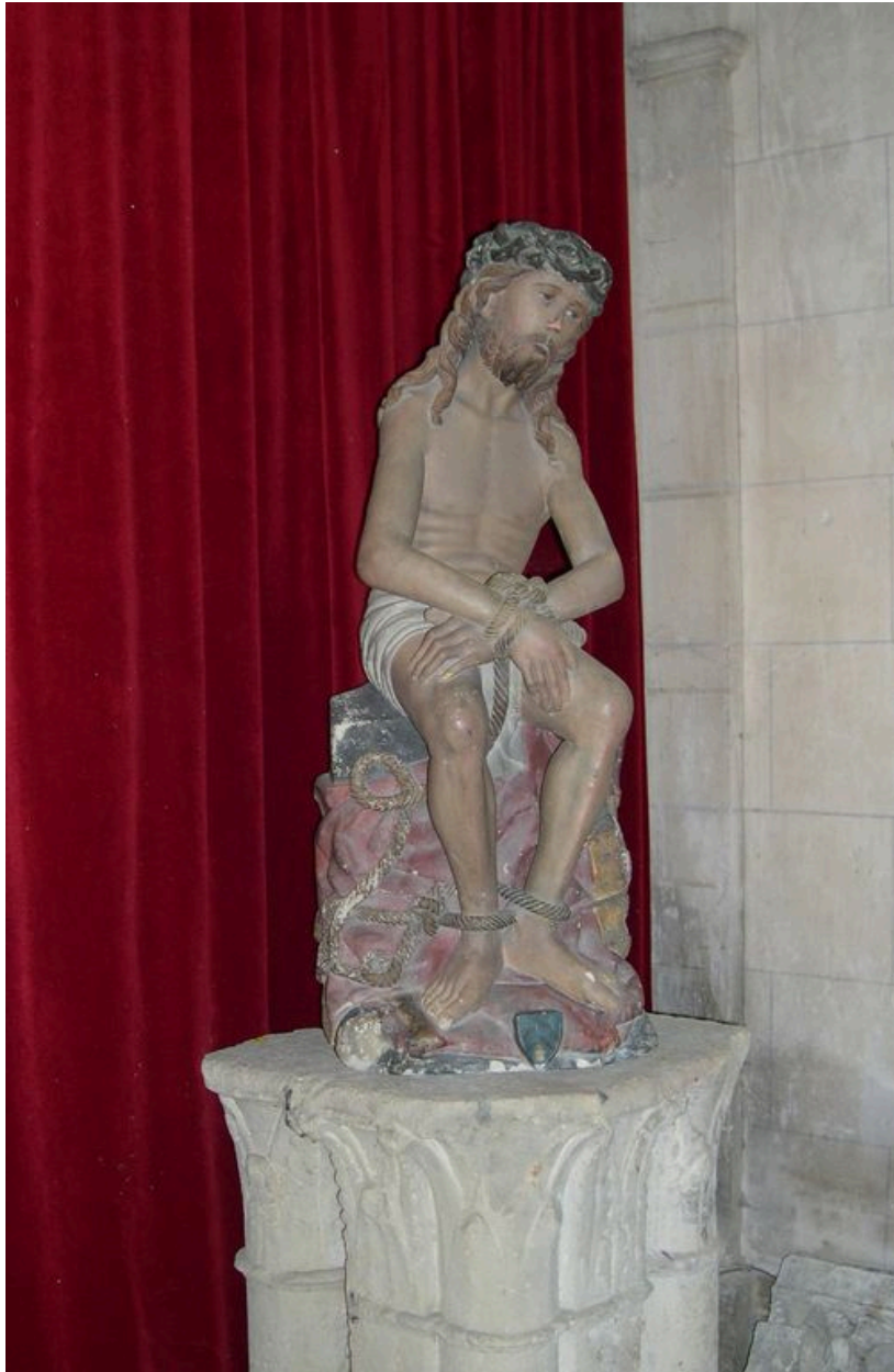
Statue : Ecce Homo.