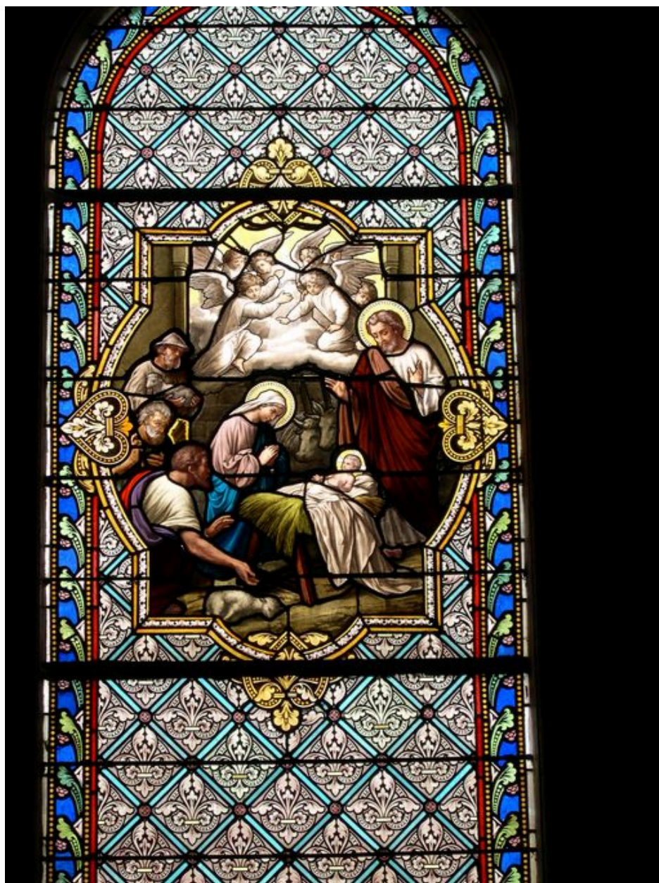
Verrière du bas-côté ouest : l'Adoration des Bergers.