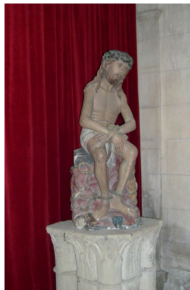
Statue : Ecce Homo.