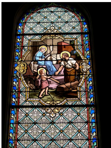
Verrière du bas-côté est : la Sainte Famille.