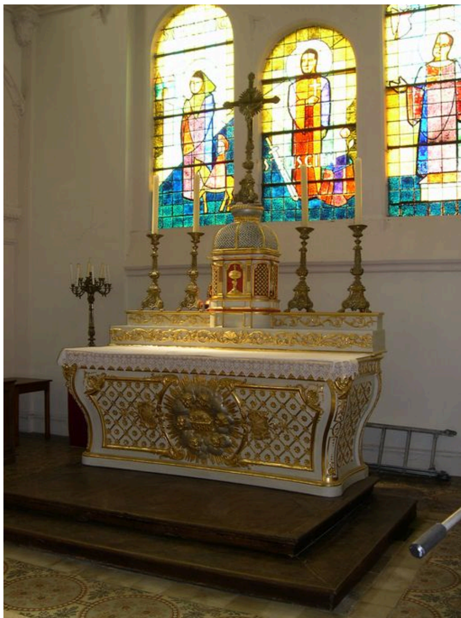
Le maître-autel et les vitraux du choeur.