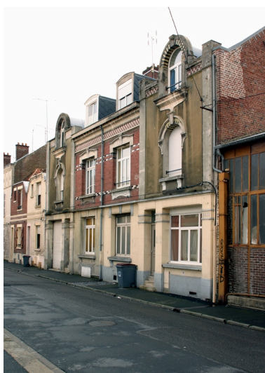
Façade antérieure des logements.