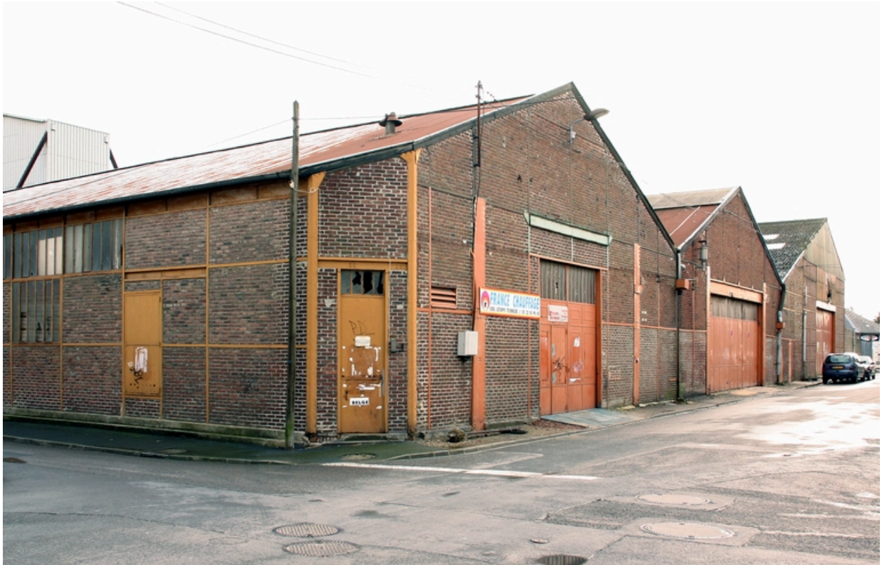
Les ateliers, à l'angle des rues Jules-César et Puchart.