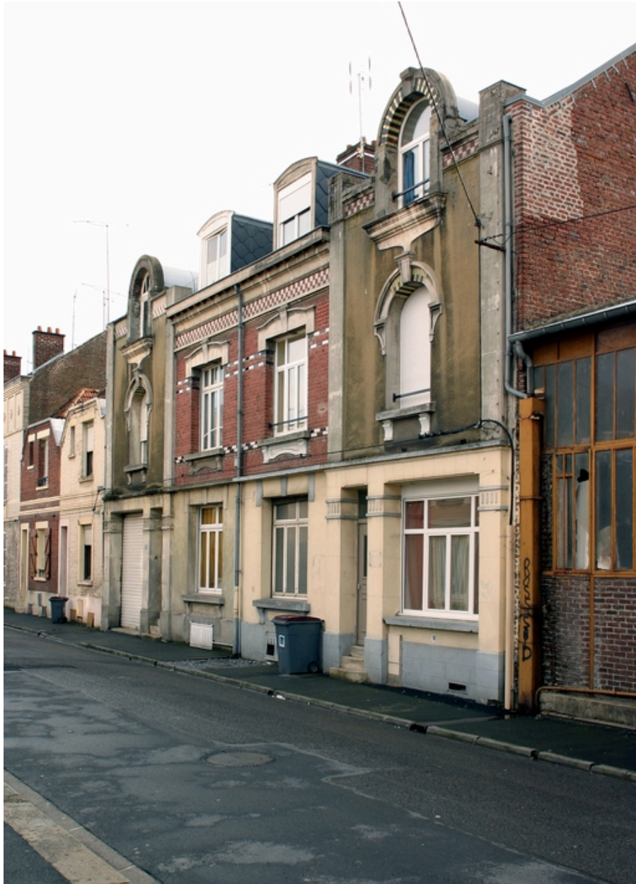
Façade antérieure des logements.