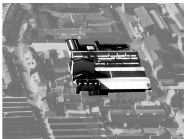
Vue aérienne du site en 1989.