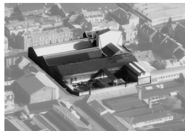
Vue aérienne du site en 1989.