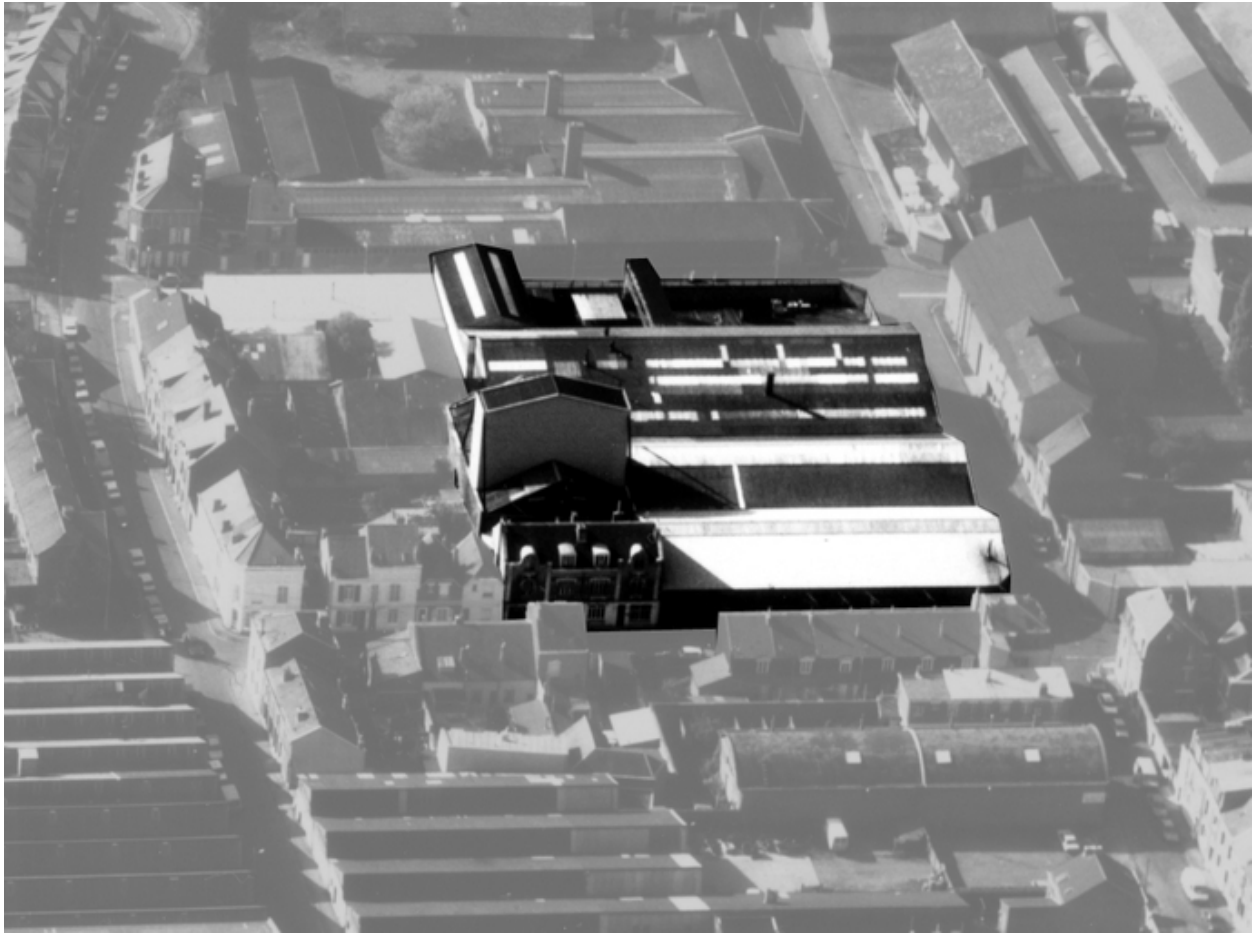
Vue aérienne du site en 1989.