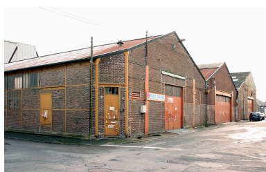
Les ateliers, à l'angle des rues Jules-César et Puchart. IVR22_20060205196NUCA