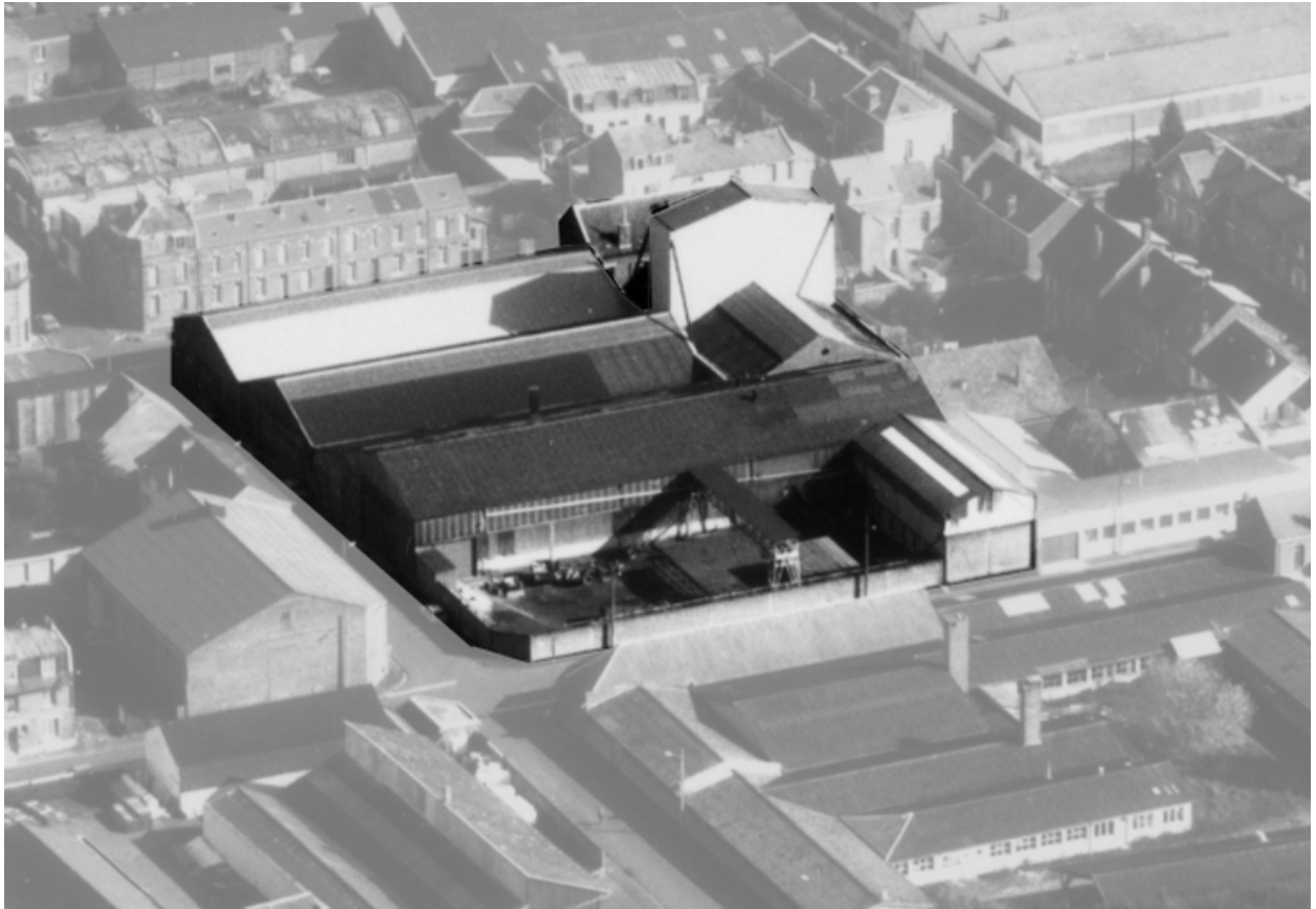
Vue aérienne du site en 1989.