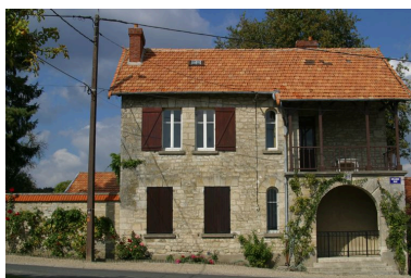
Vue générale. IVR22_20030202322NUCA