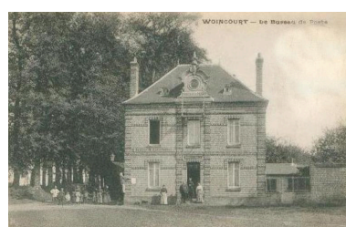
Ancien bureau de poste, début du 20e siècle (coll. part.).