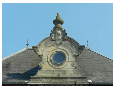
Détail du fronton portant la date 1892.