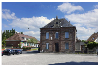
Vue générale. IVR22_20158000582NUC2A