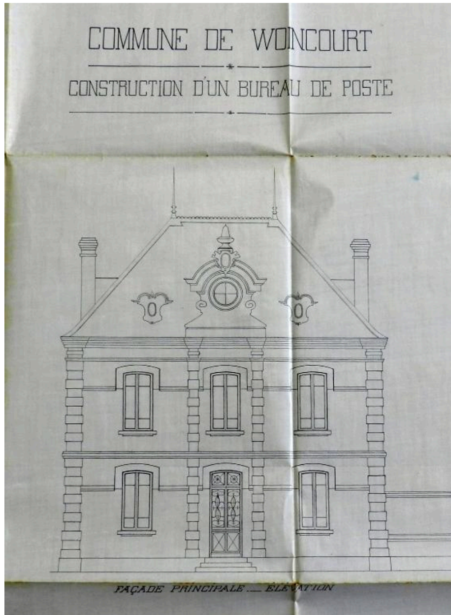
Elévation principale, par l'architecte Saint-Aubin, 1892 (AD Somme ; 99 O 3857).