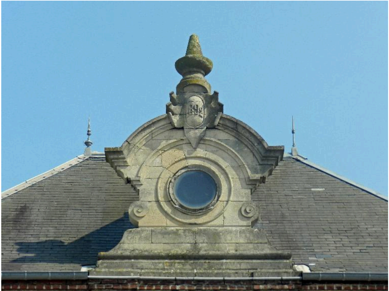
Détail du fronton portant la date 1892.