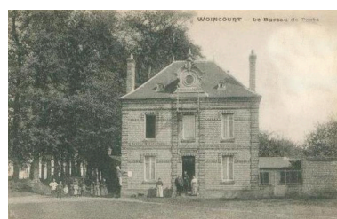
Ancien bureau de poste, début du 20e siècle (coll. part.). IVR22_20158006522NUCA