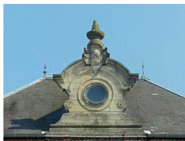
Détail du fronton portant la date 1892.