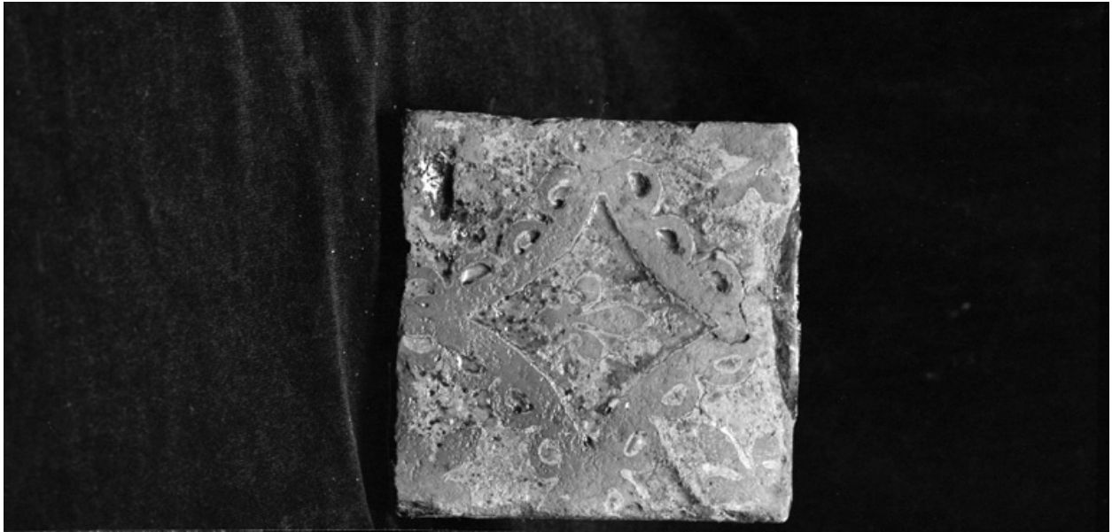
Motif de fleur de lys, 15e siècle. Collections de la S.H.A.C.T.