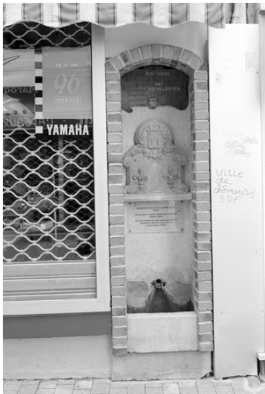
Restes très remaniés de la fontaine de la Grande Rue qui était