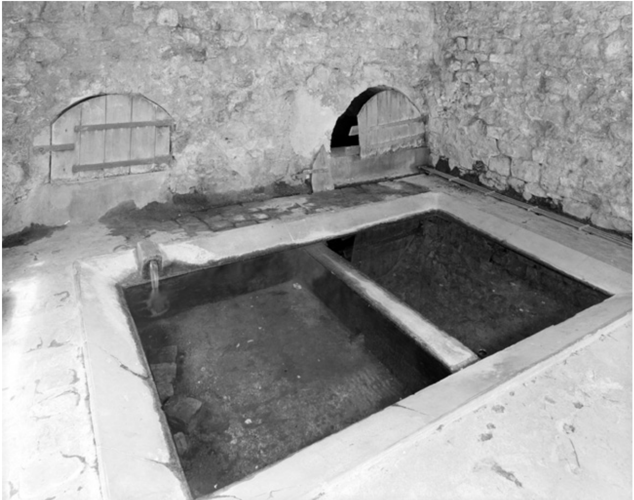
Rue de Bue. Lavoir : vue du bassin et des portes des réservoirs ou conduits d'arrivée d'eau.