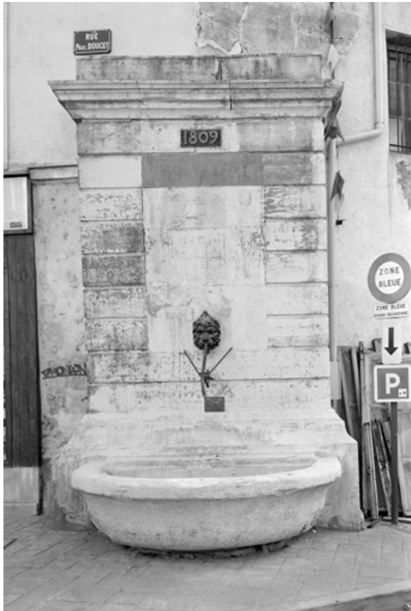
La fontaine Méchin, à l'angle de la rue Carnot et de la rue Paul-Doucet, 1809.