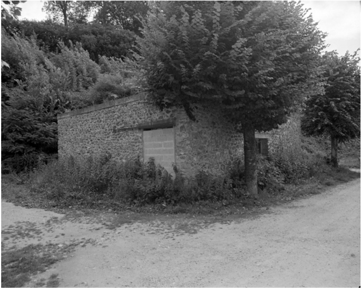
Cour Renan. Lavoir, fontaine : vue extérieure du lavoir.