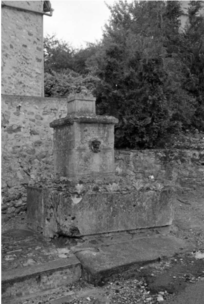
Rue du Courteau, vieux chemin de Paris. Fontaine portant une inscription et une date partiellement lisible, 18...