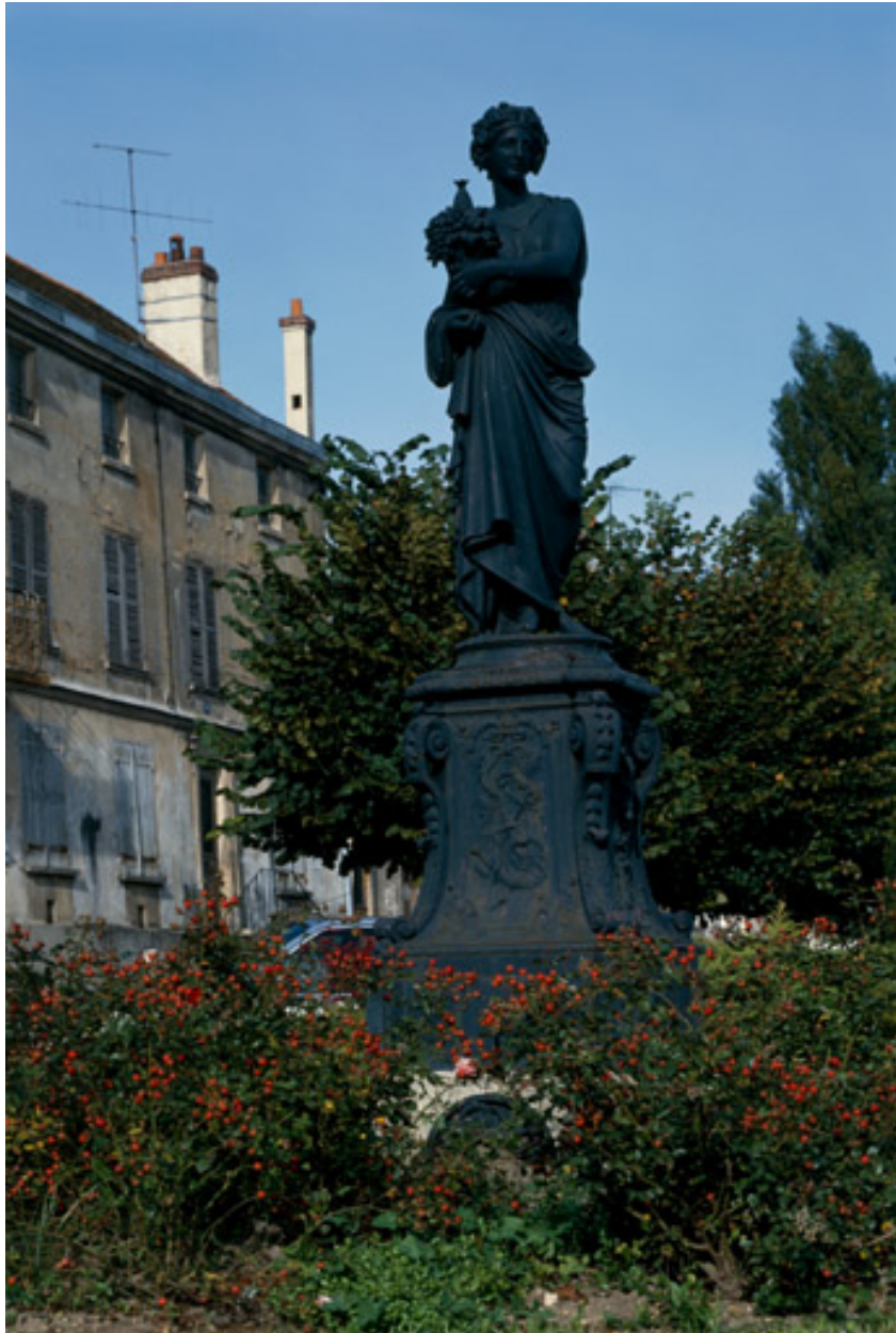
La fontaine Viard, avenue Joussaume-Latour : statue en fonte de Ducel.