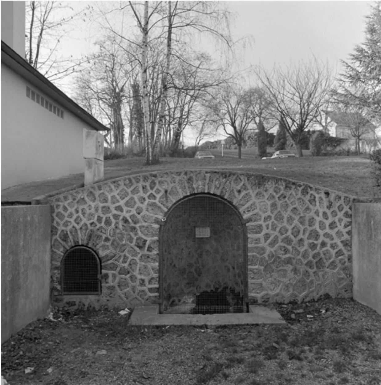
Avenue Jean-Jaurès. Fontaine, d'implantation ancienne, remaniée au XXe siècle : vue d'ensemble.