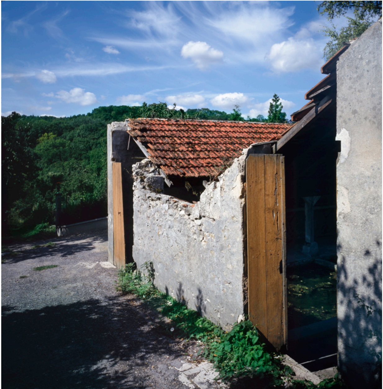
Lavoir : vue depuis la rue.