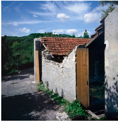
Lavoir : vue depuis la rue. IVR22_19930200953VA