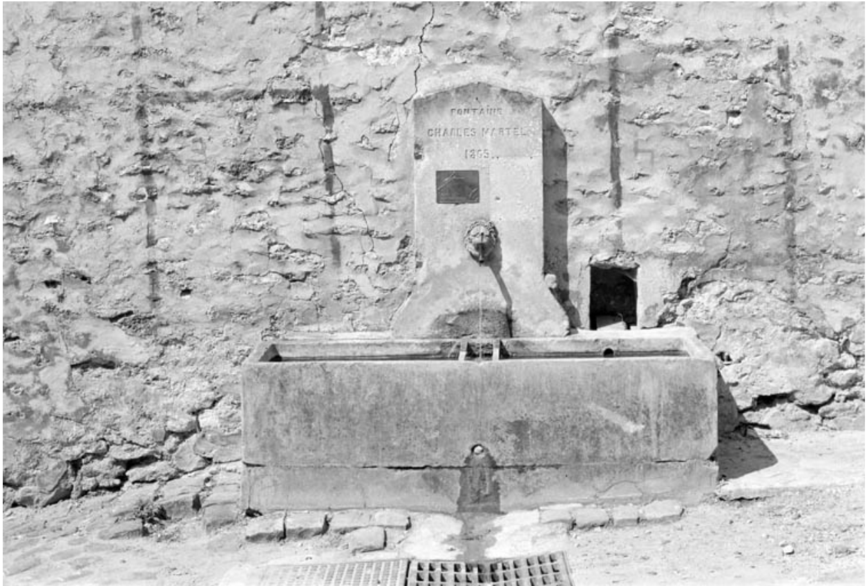
Cour Montmartel. Vue de la fontaine Charles-Martel, 1865.