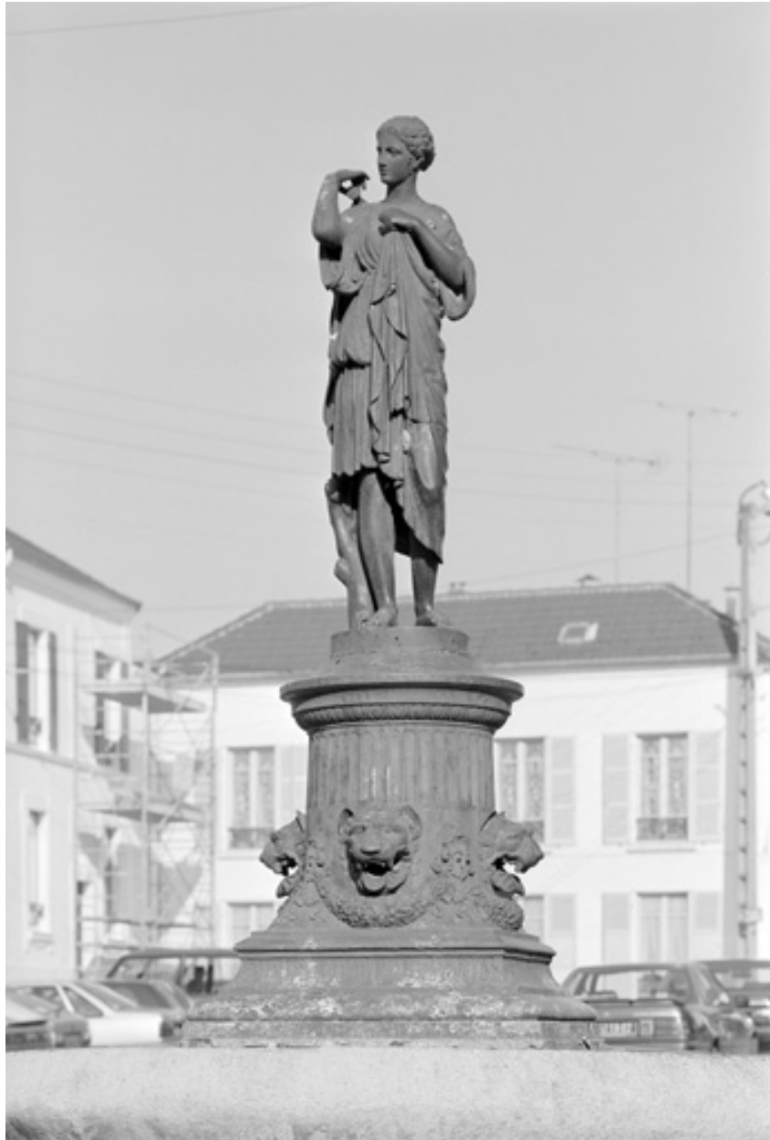
La fontaine de la place de Gerbois : statue en fonte de fer de la maison Ducel, d'après une Diane antique.