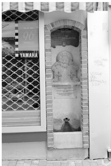
Restes très remaniés de la fontaine de la Grande Rue qui était