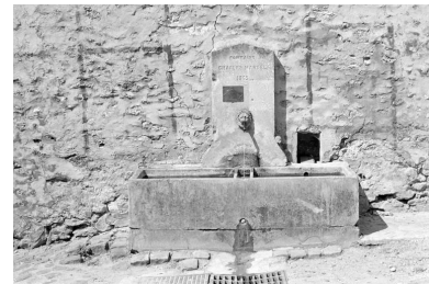
Cour Montmartel. Vue de la fontaine Charles-Martel, 1865.