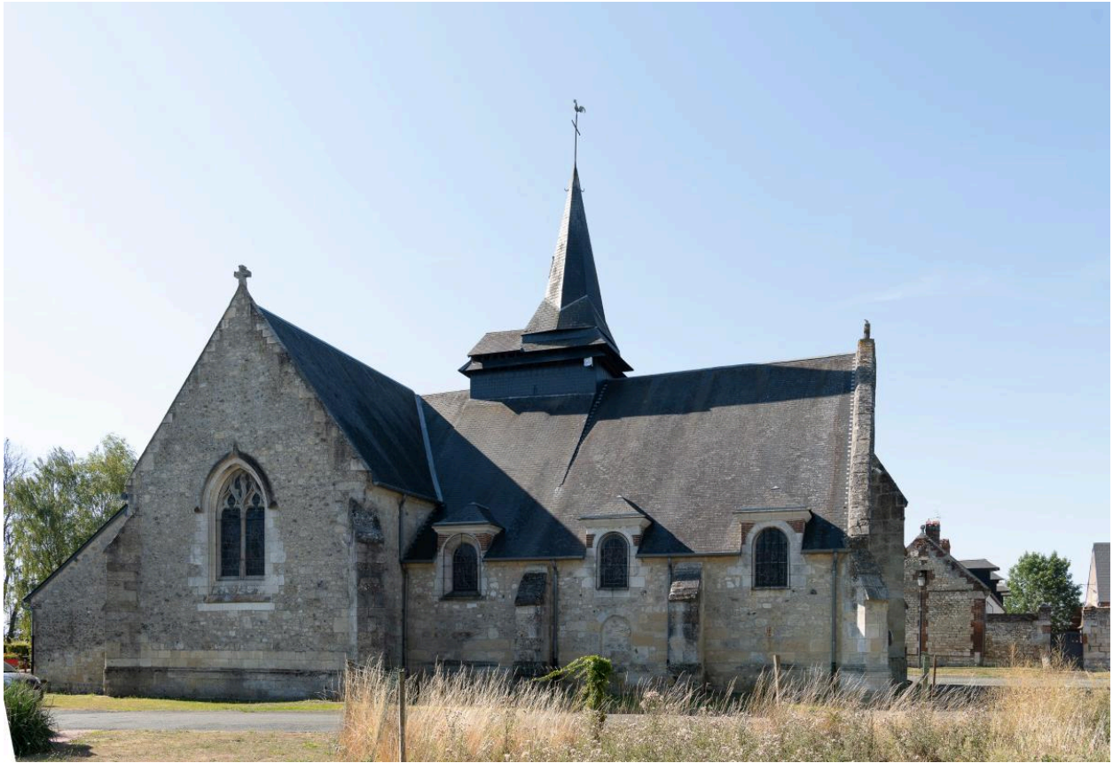
Vue extérieure depuis le nord.