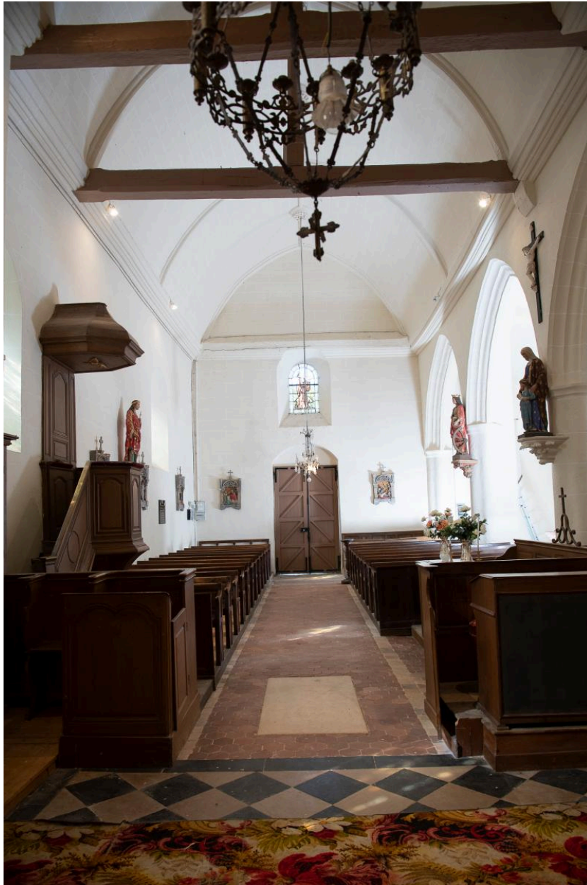
Vue intérieure vers la nef.