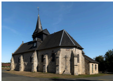
Vue extérieure depuis le sud-est. IVR32_20226000817NUCA