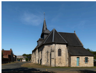
Vue extérieure de l'est.