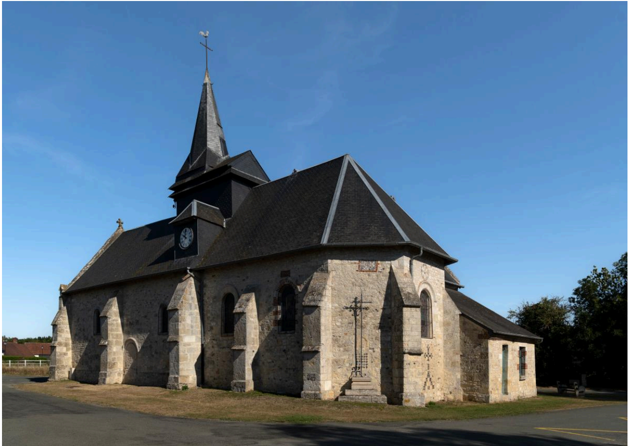
Vue extérieure depuis le sud-est.