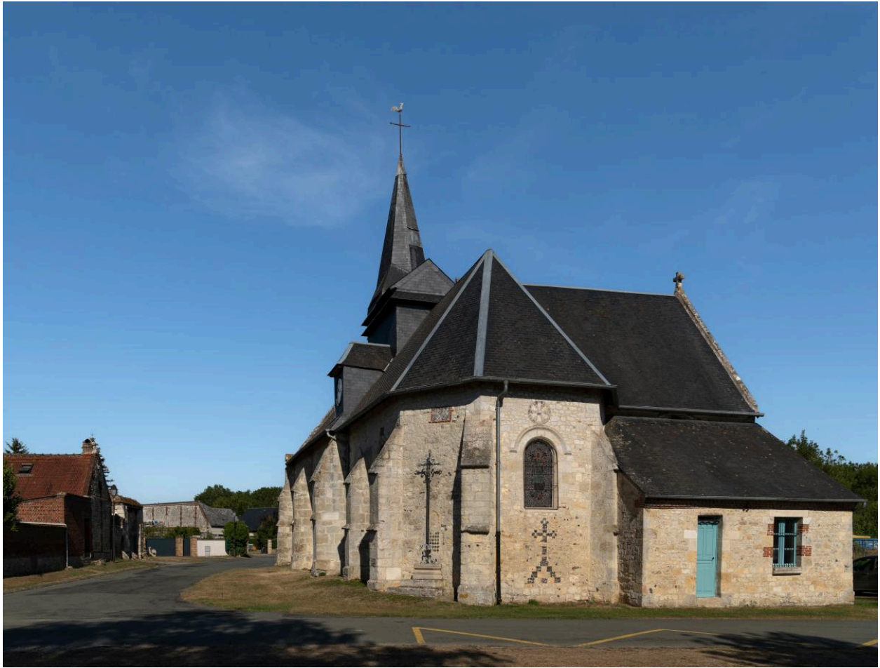
Vue extérieure de l'est.