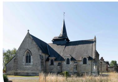
Vue extérieure depuis le nord. IVR32_20226000821NUCA