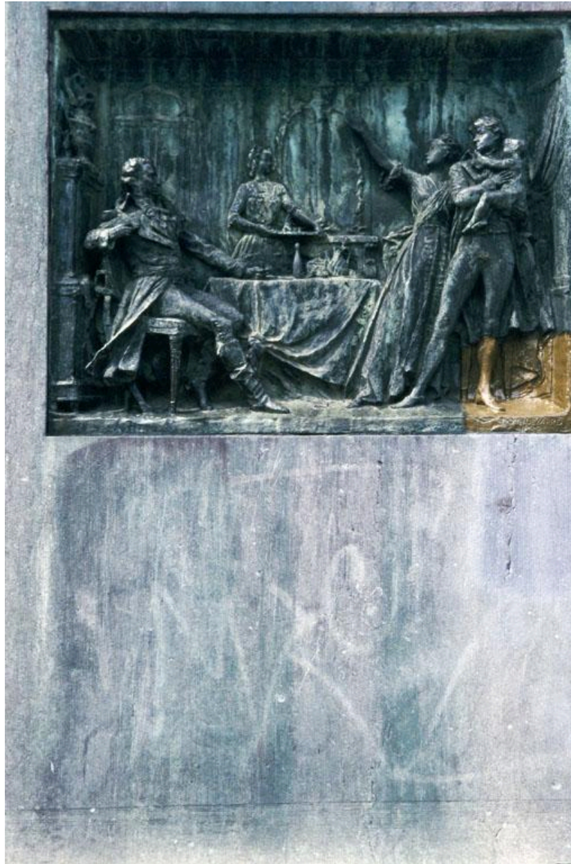
Vue du relief ornant le côté droit du socle : le maréchal Brune chez Camille Desmoulins, 29 mars 1794.