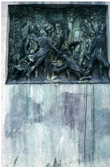
Vue du relief ornant le côté gauche du socle : Camille Desmoulins haranguant le peuple au Palais Royal, 12 juillet 1789. IVR22_20030200119ZA