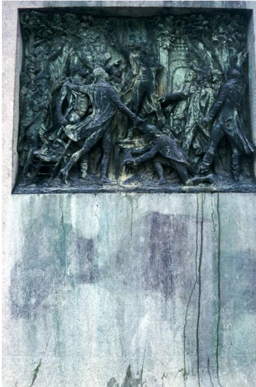
Vue du relief ornant le côté gauche du socle : Camille Desmoulins haranguant le peuple au Palais Royal, 12 juillet 1789.