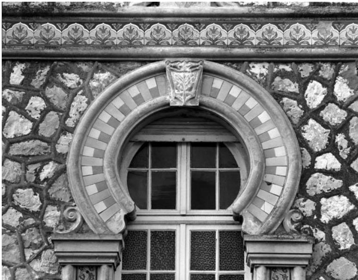
Détail de fenêtre au rez-de-chaussée de la façade latérale droite.