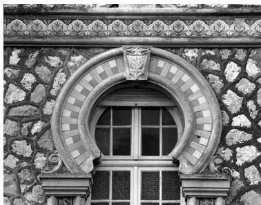
Détail de fenêtre au rez-de- chaussée de la façade latérale droite. IVR31_19816203748X