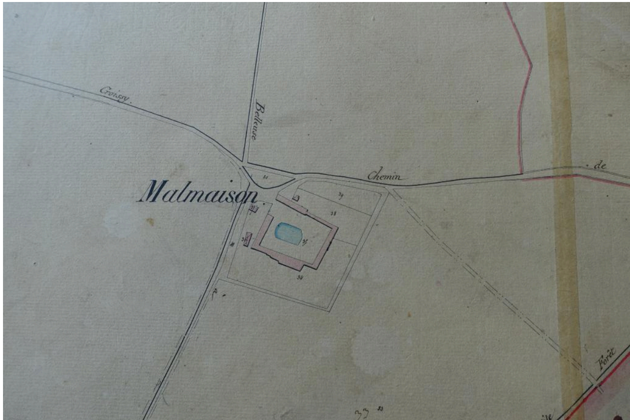
Croissy-sur-Celle. Cadastre napoléonien, section A, feuille 1, 1834 (EDT 364/1 G 1).