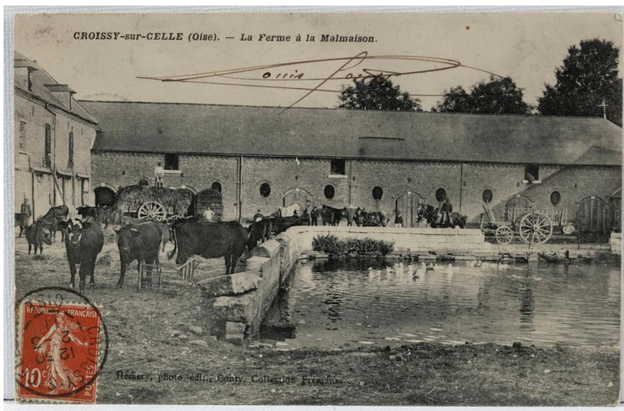
Croissy-sur-Celle (Oise). La ferme à la Malmaison, carte postale, éd. Hemery, Conty, [1911 ou avant] (coll. part.).