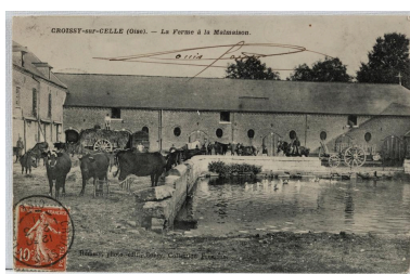
Croissy-sur-Celle (Oise). La ferme à la Malmaison, carte postale, éd. Hemery, Conty, [1911 ou avant] (coll. part.). IVR32_20226000094NUCA