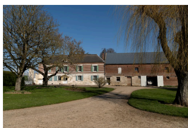
Vue générale du logis et du bâtiment des étables et écuries depuis le sud.