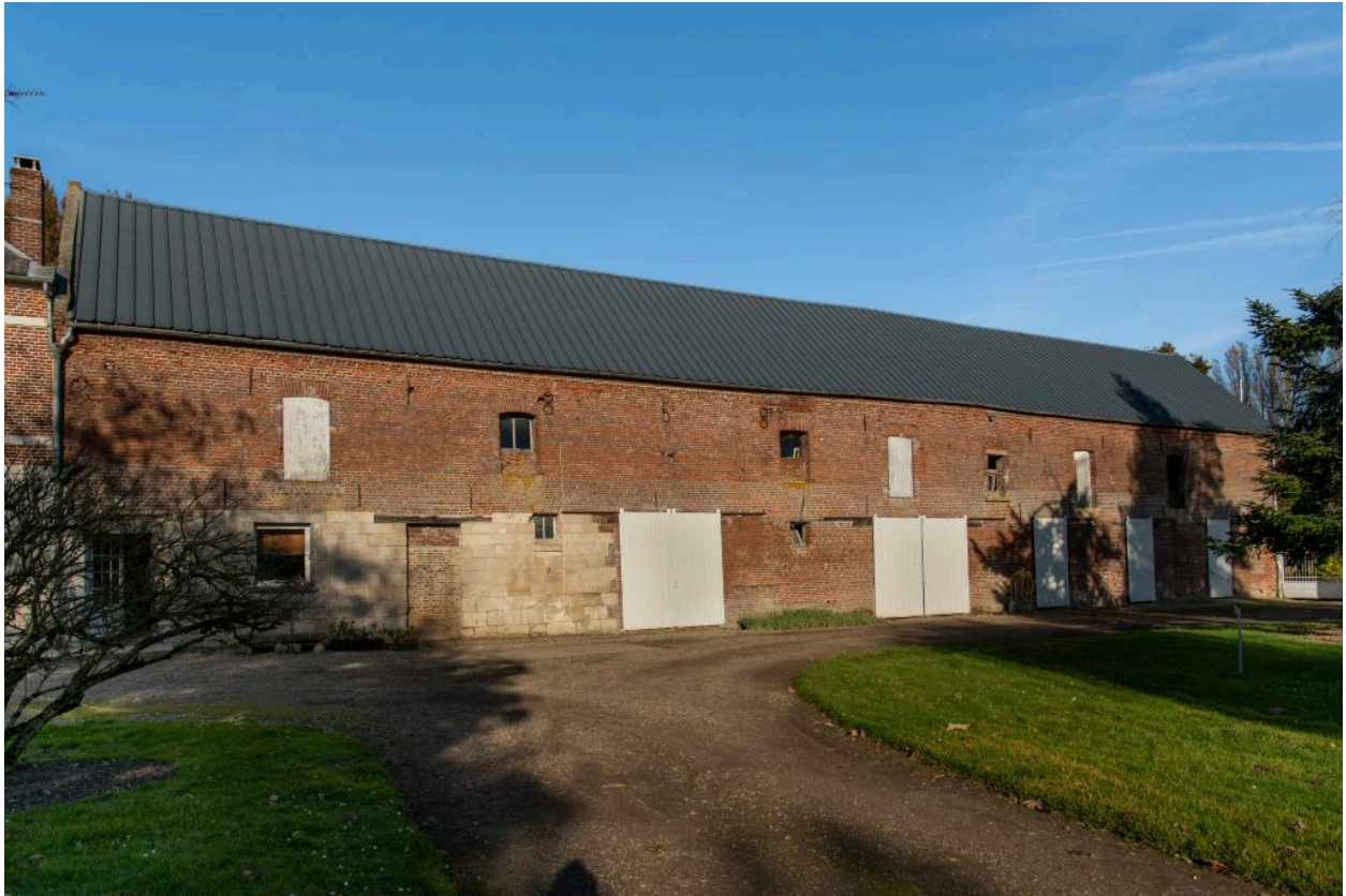
Anciennes étables et écuries, 1858.