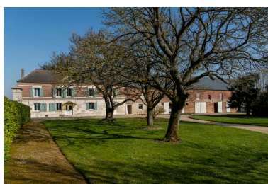
Vue générale depuis le sud du logis et des étables et écuries. IVR32_20226000178NUCA