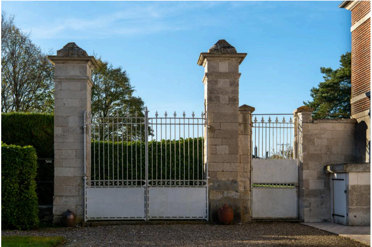
Portail d'entrée de la ferme vu depuis la cour.