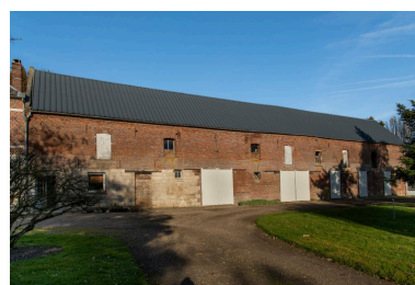
Anciennes étables et écuries, 1858. IVR32_20216001325NUCA