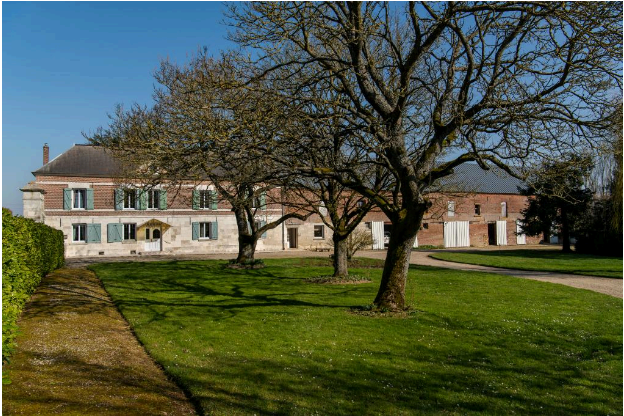
Vue générale depuis le sud du logis et des étables et écuries.