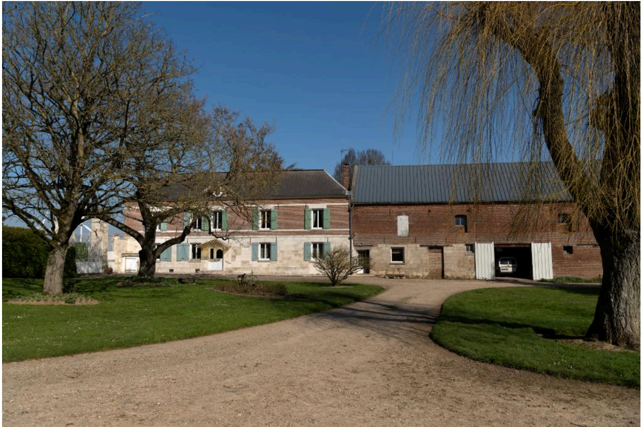
Vue générale du logis et du bâtiment des étables et écuries depuis le sud.