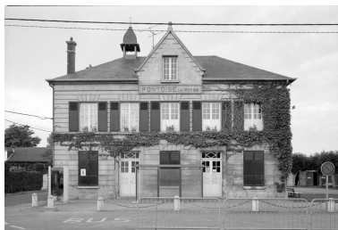
Vue générale. IVR22_19846001144X

Plan de situation. Extrait du plan cadastral de 1982, section CI 81. IVR22_20096000172NUCA