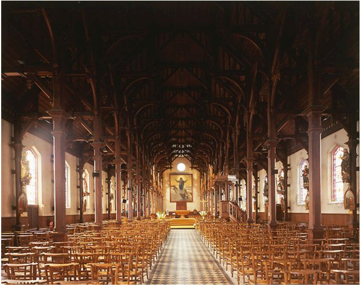
Vue générale intérieure.