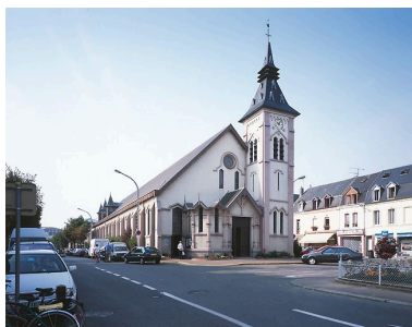
Vue générale. IVR31_20046200118VA