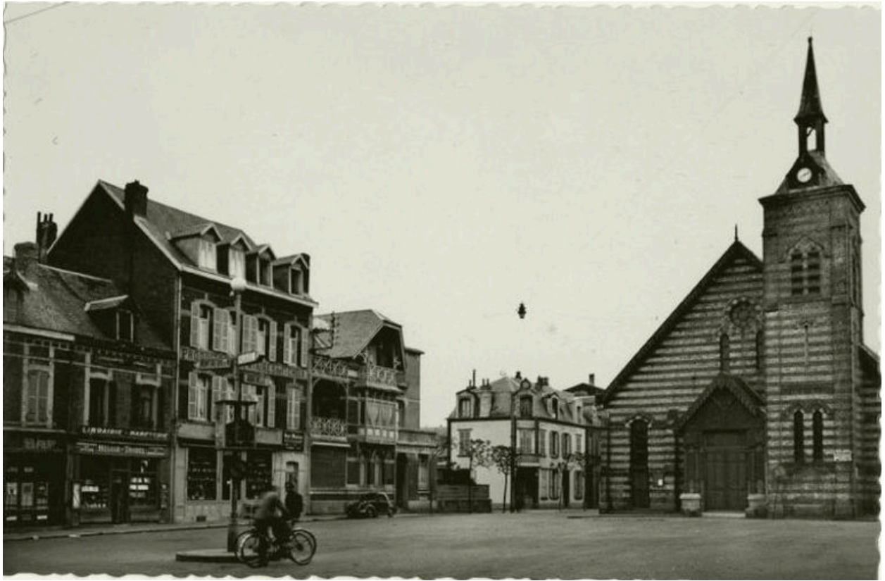
Eglise Notre-Dame-des-Sables, carte postale année 1910.