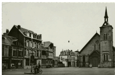
Eglise Notre-Dame-des-Sables, carte postale année 1910. IVR31_20066200252NUCA