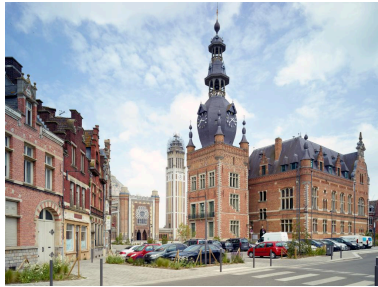
Vue d'ensemble depuis le nord. IVR32_20215900097NUCA