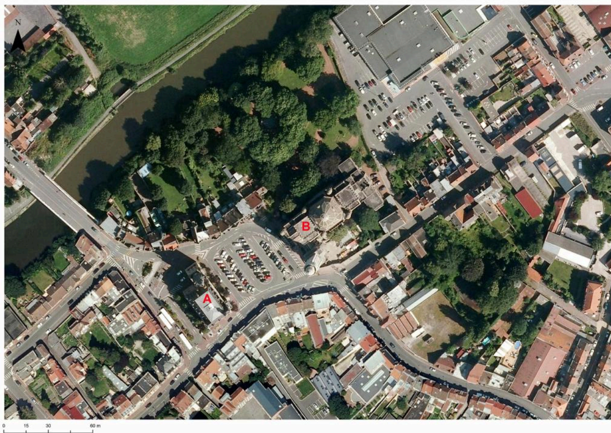
Photographie aérienne de 2018 présentant l'hôtel de ville (en A) et l'église Saint-Chrysole (en B).