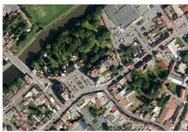
Photographie aérienne de 2018 présentant l'hôtel de ville (en A) et l'église Saint-Chrysole (en B).