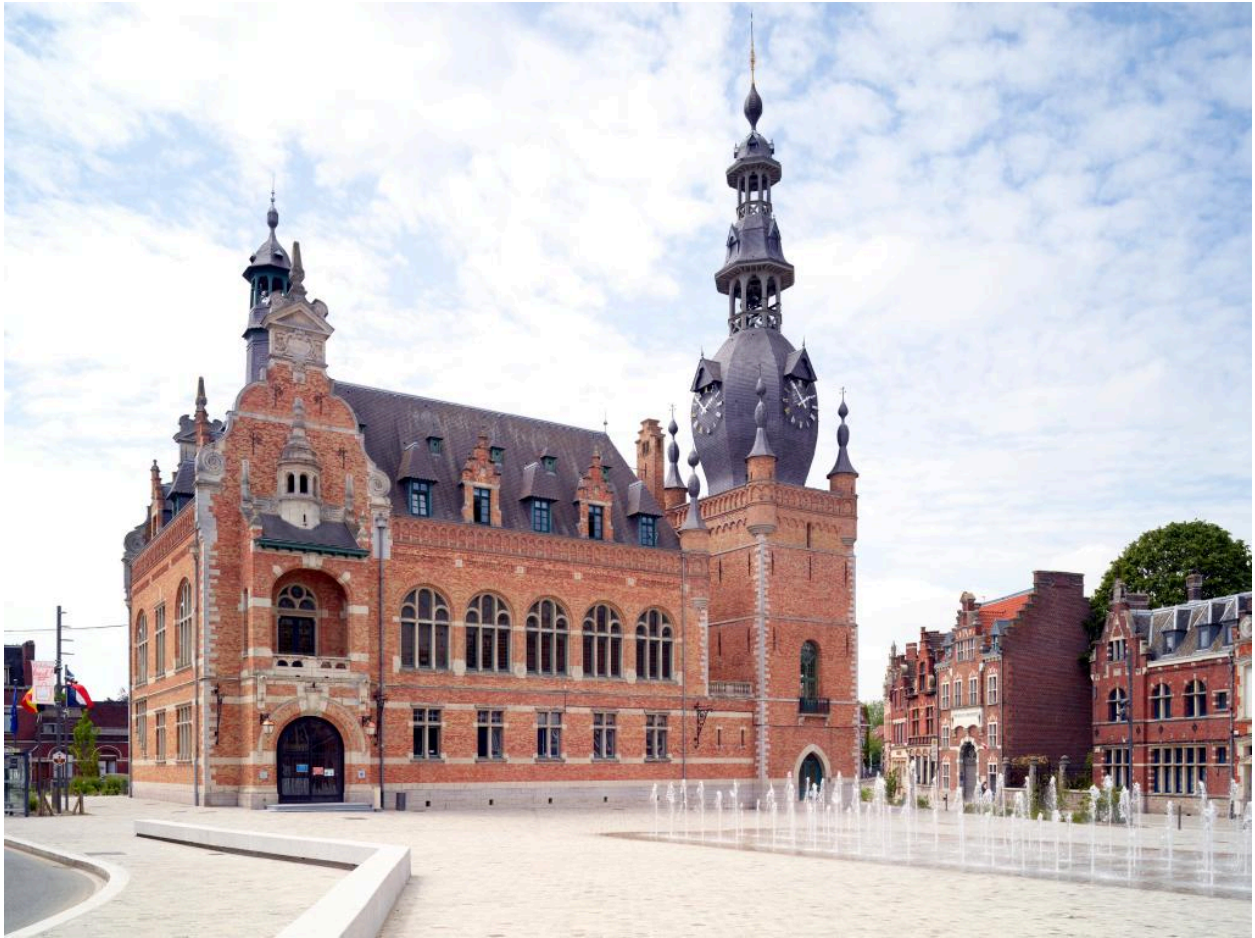
Vue générale depuis la Grand'Place, à l'est.