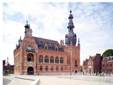
Vue générale depuis la Grand'Place, à l'est.