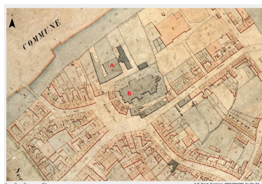
L'hôtel de ville (en A) sur le plan cadastral de 1867, feuille A2. Il se trouve alors au nord de l'église Saint-Chrysole (en B).