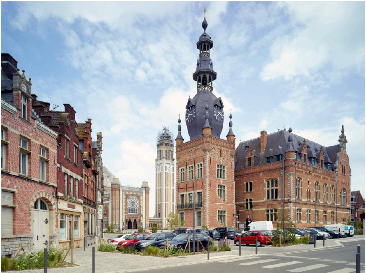
Vue d'ensemble depuis le nord.