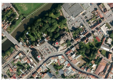
Photographie aérienne de 2018 présentant l'hôtel de ville (en A) et l'église Saint-Chrysole (en B).