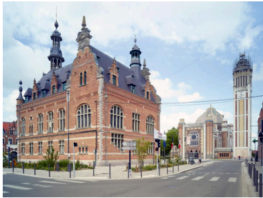
Vue d'ensemble depuis ouest. IVR32_20215900096NUCA

IVR32_20215905023NUCA