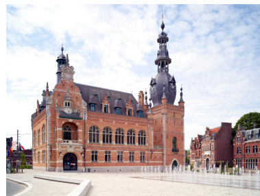
Vue générale depuis la Grand'Place, à l'est.