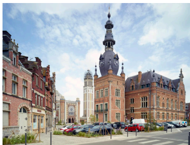
Vue d'ensemble depuis le nord. IVR32_20215900097NUCA