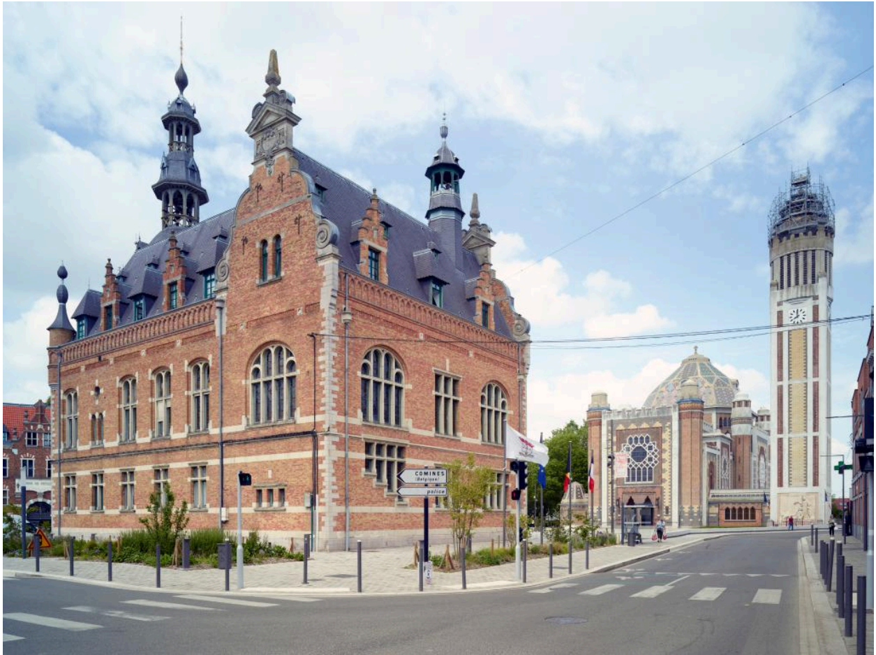
Vue d'ensemble depuis ouest.