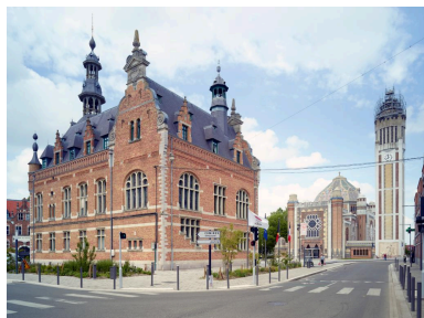
Vue d'ensemble depuis ouest.