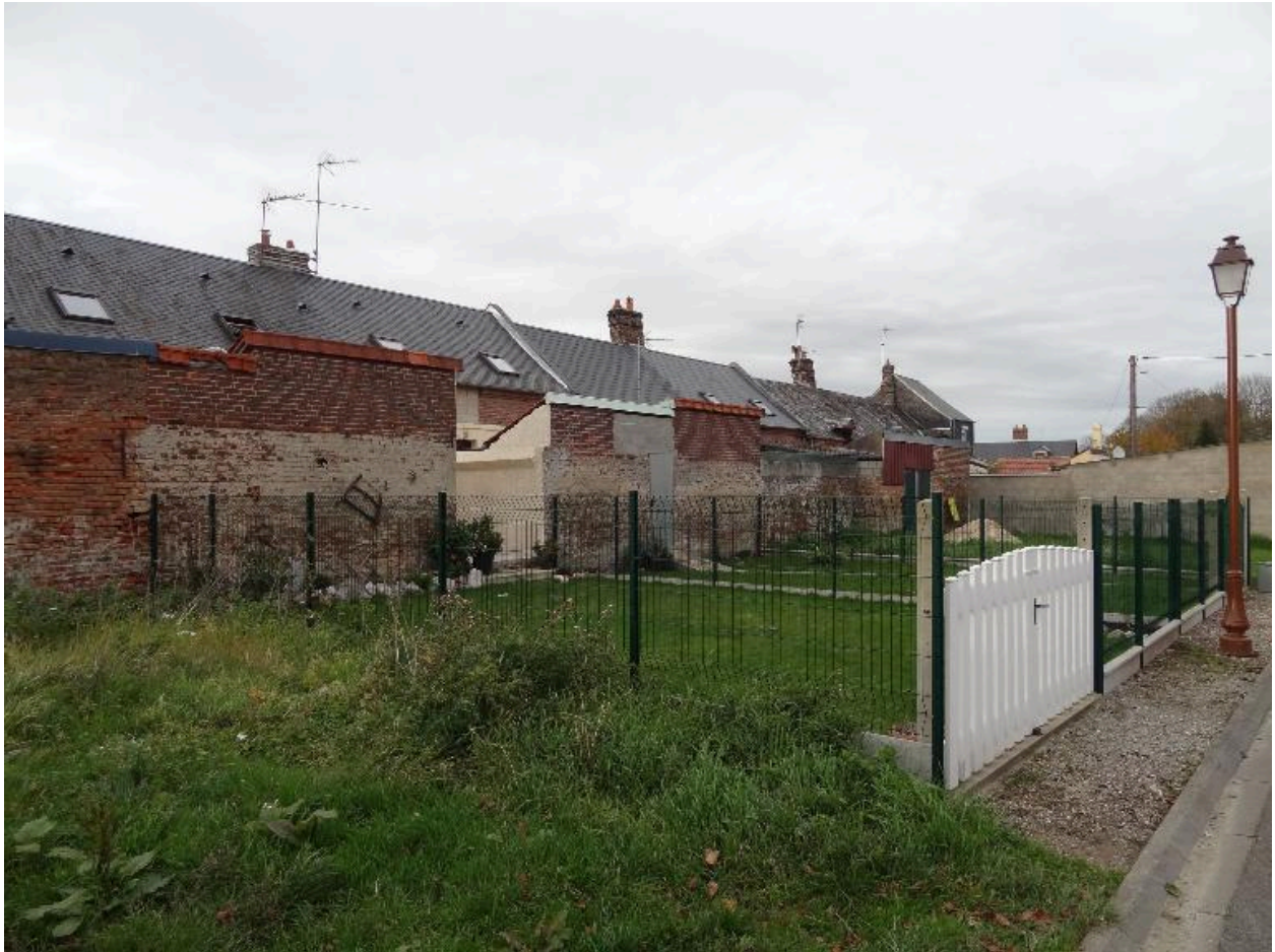
Vue des façades arrières des ateliers et des logements.