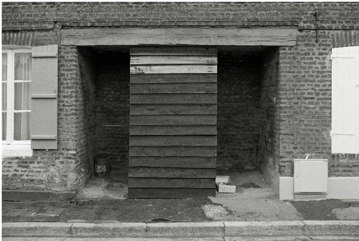
Le puits de la cité, en 1990, vue de face.