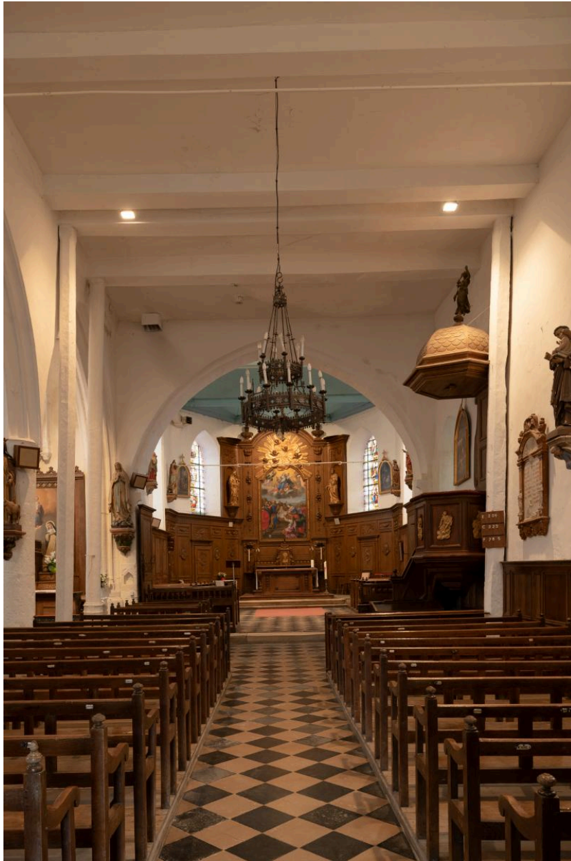
Vue vers le chœur.