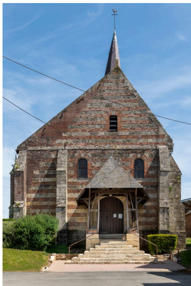
Façade occidentale. IVR32_20226000388NUCA