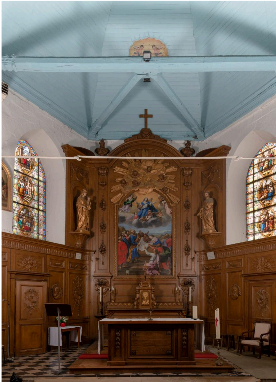
Vue générale du chœur.