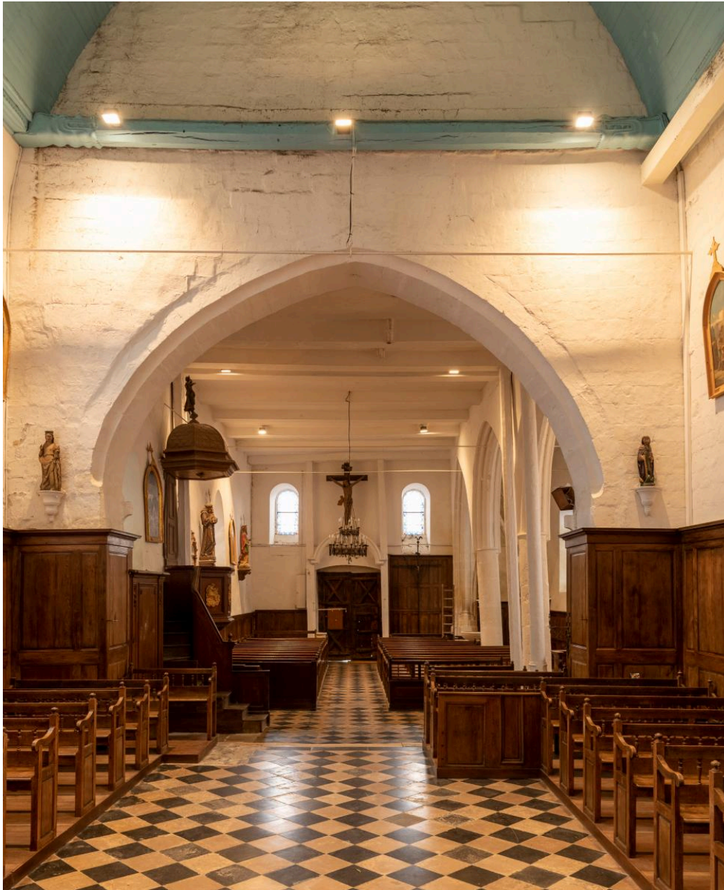
Vue vers la nef.