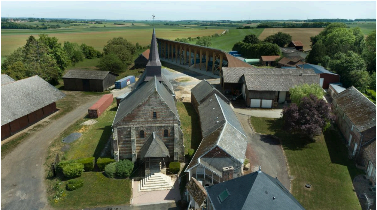
Vue aérienne de l'église et de la ferme du Tilloy.