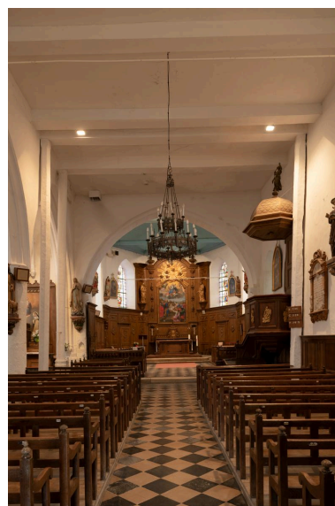
Vue vers le chœur.