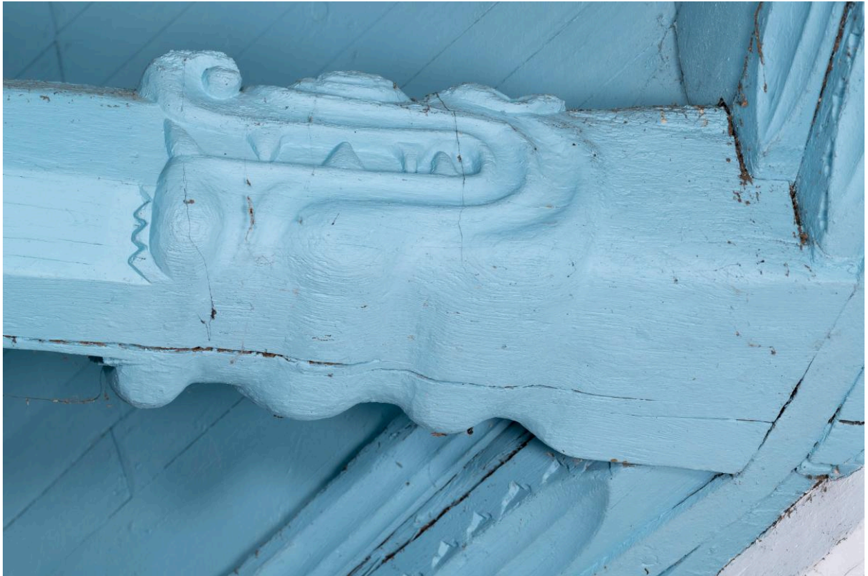
Engoulant dévorant un entrain de la charpente du chœur.