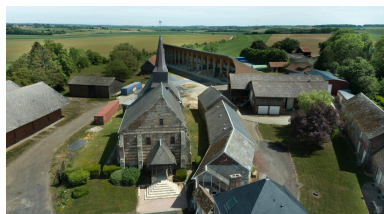
Vue aérienne de l'église et de la ferme du Tilloy.