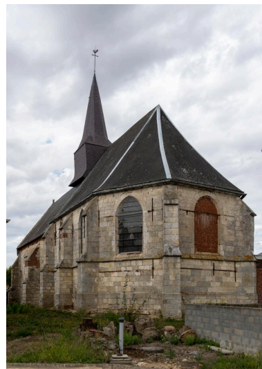
Chevet. IVR32_20226000909NUCA