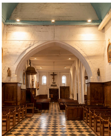
Vue vers la nef.