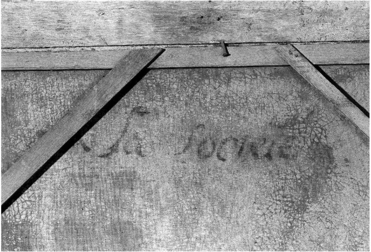
Détail du revers : inscription manuscrite "A la société"?