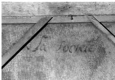
Détail du revers : inscription manuscrite "A la société?". IVR22_19966003529X