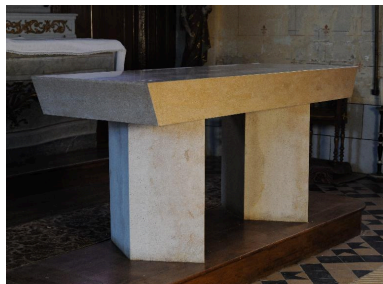
Vue générale de trois-quarts.

IVR22_20128000184NUC2A