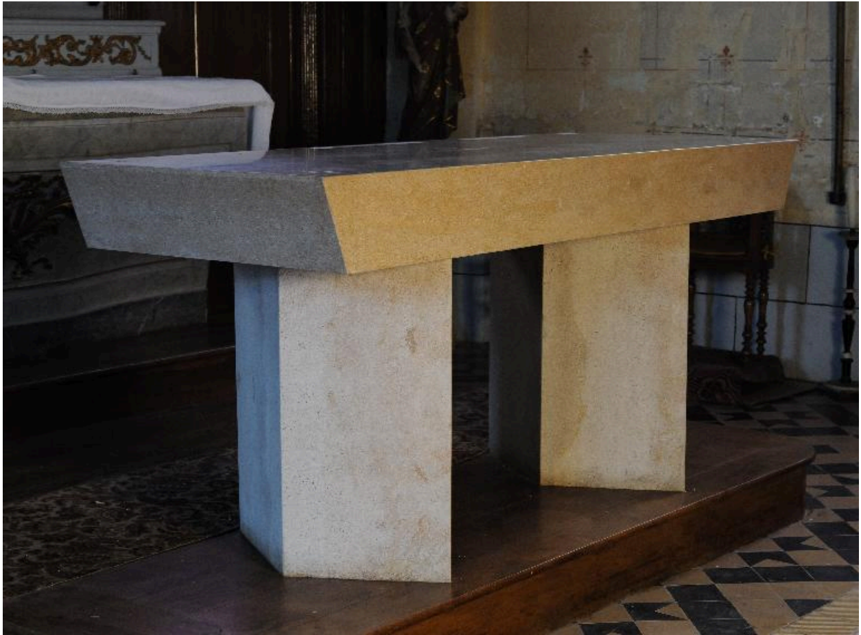
Vue générale de trois-quarts.