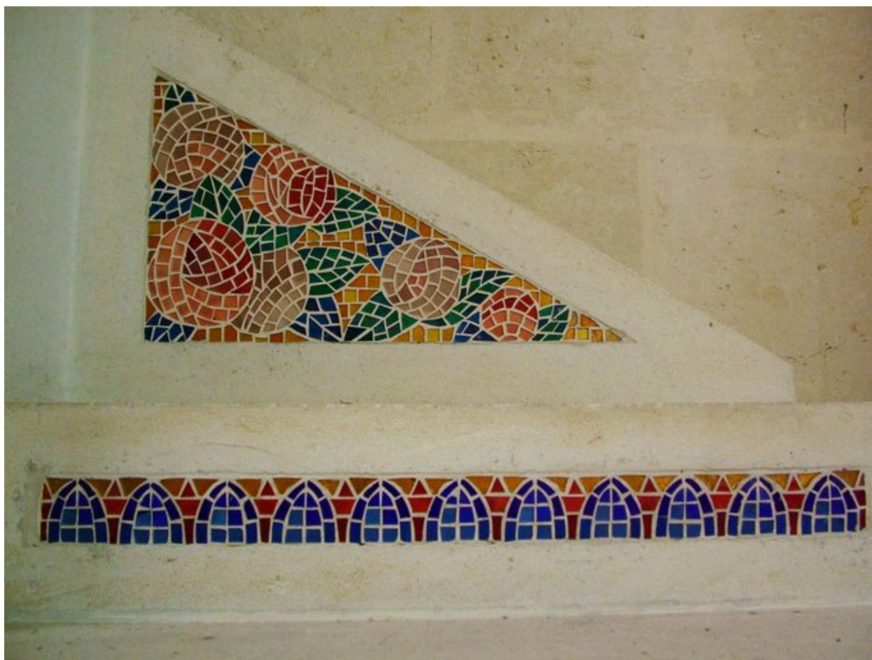
Détail du décor.