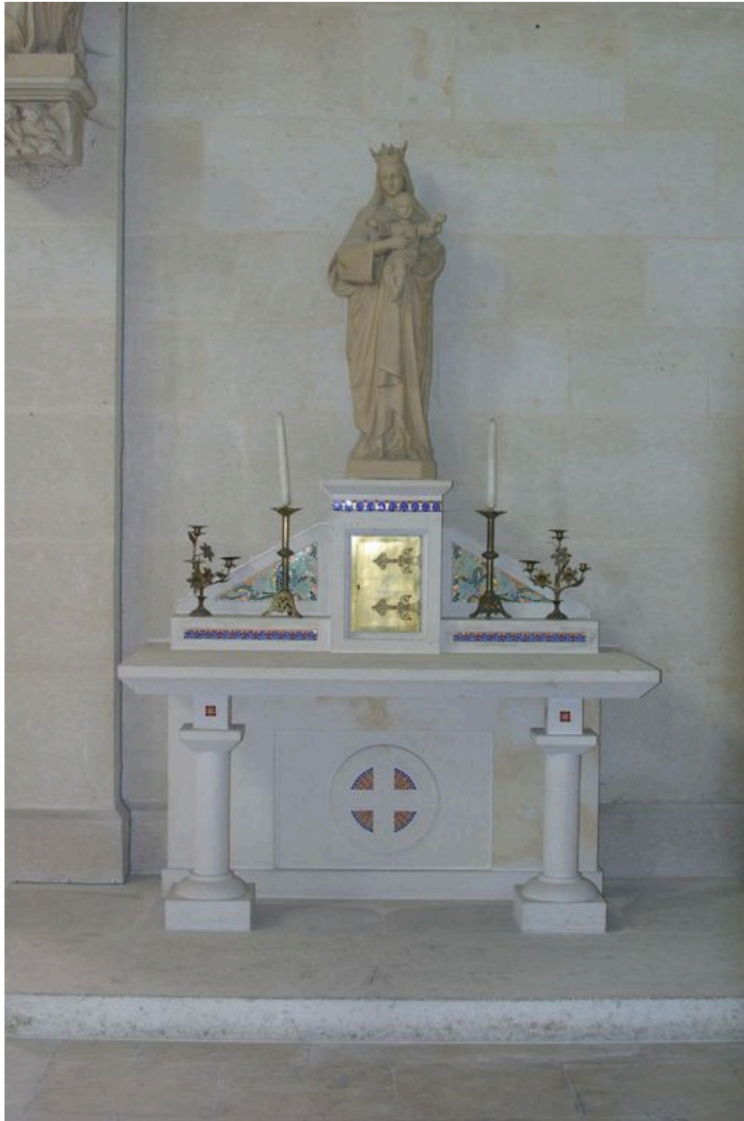
Vue générale de l'autel secondaire sud.