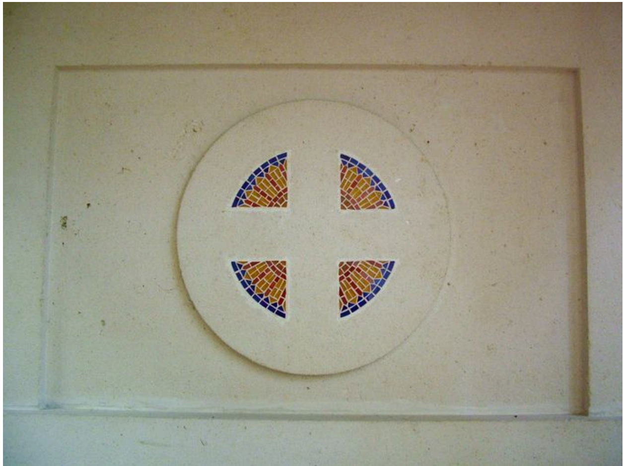
Détail du décor.