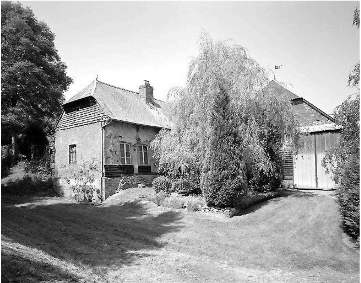
Vue générale du logis du 18e siècle et de la grange ancienne.