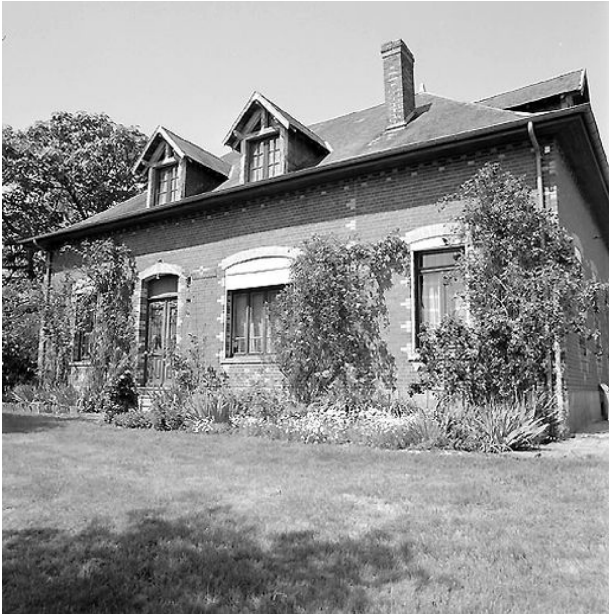
Elévation antérieure du logis de 1927.