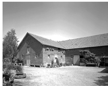
Dépendances agricoles.