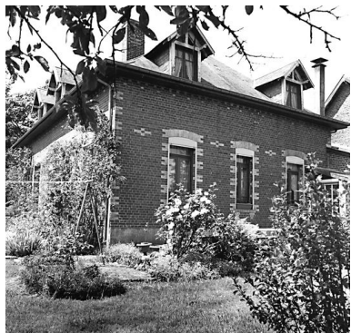
Elévation postérieure du logis de 1927. IVR22_20020200470X