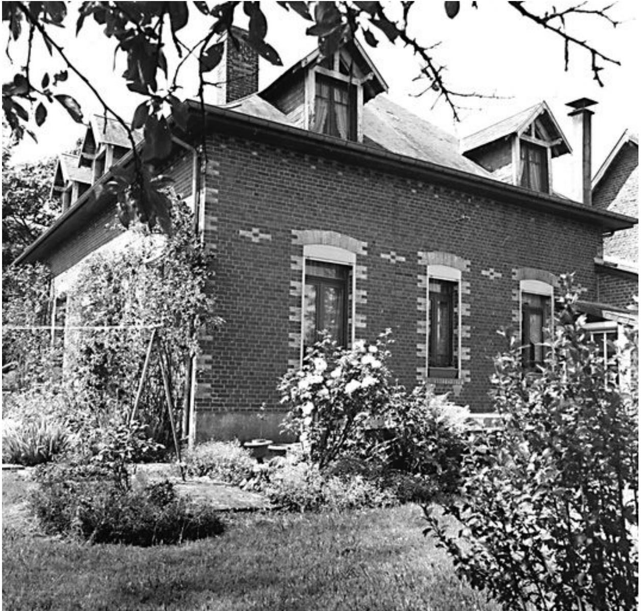
Elévation postérieure du logis de 1927.