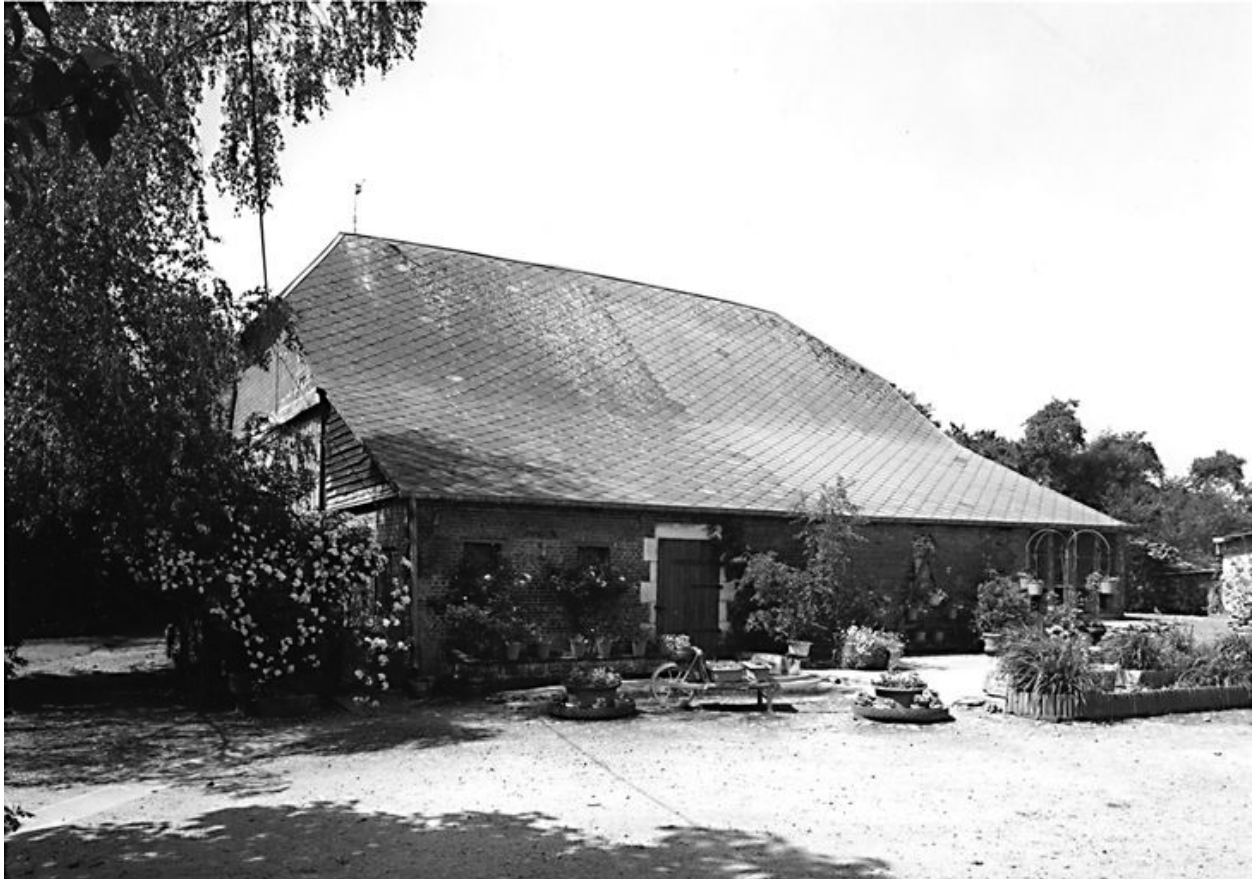
Grange et porcherie.