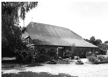
Grange et porcherie. IVR22_20020200471X