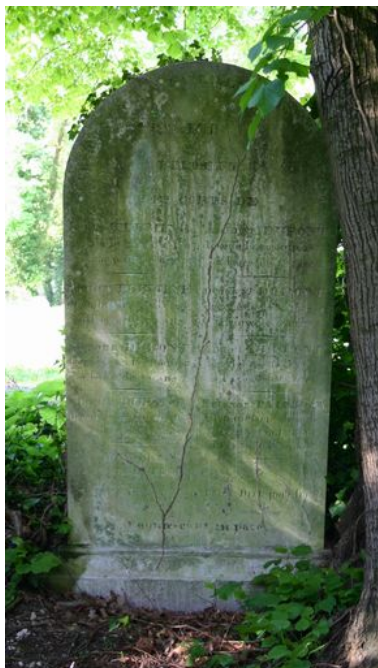
Stèle cintrée. IVR22_20088000491NUCA