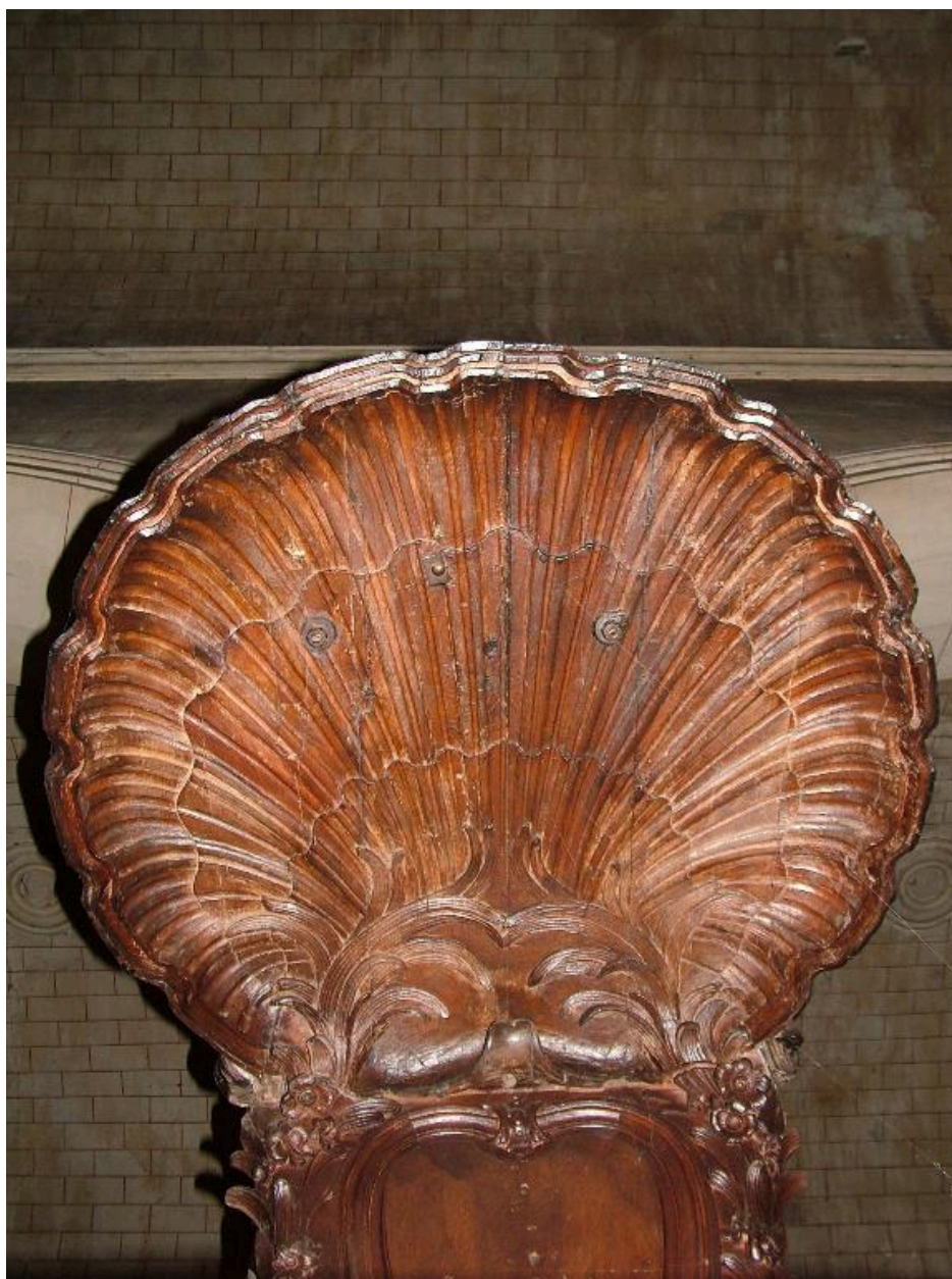
Face interne de l'abat-son.