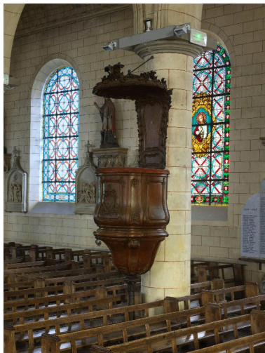
Vue générale. IVR22_20128001003NUC2A