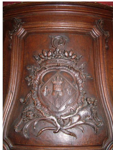
Face antérieure de la cuve aux armoiries de l'abbesse de Berteaucourt.