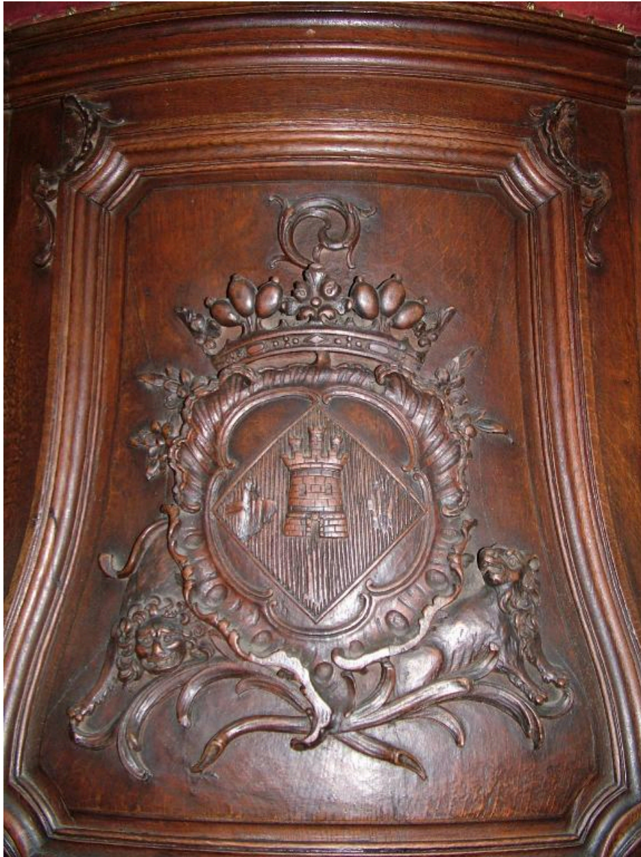
Face antérieure de la cuve aux armoiries de l'abbesse de Berteaucourt.