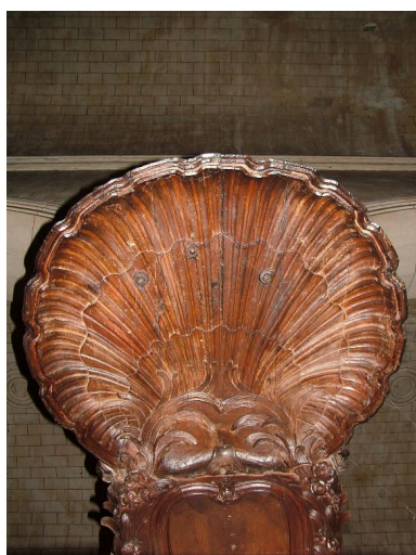
Face interne de l'abat-son.