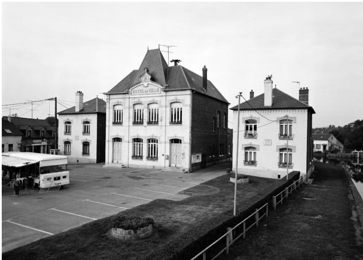
L'hôtel de ville d'Étreux.