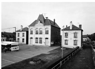
L'hôtel de ville d'Étreux.