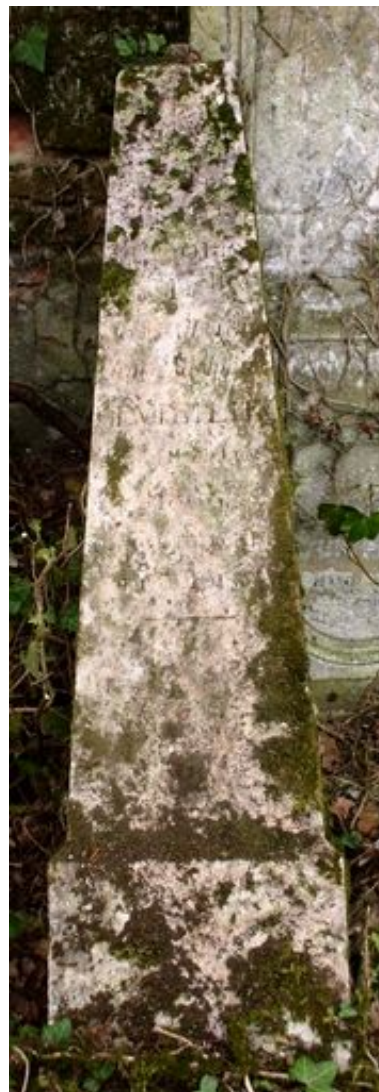
Stèle trapézoïdale, vers 1868. IVR22_20068000909NUCA