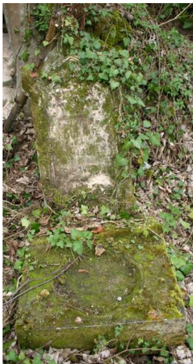
Stèle néo-gothique (vestiges), vers 1877. IVR22_20068000913NUCA