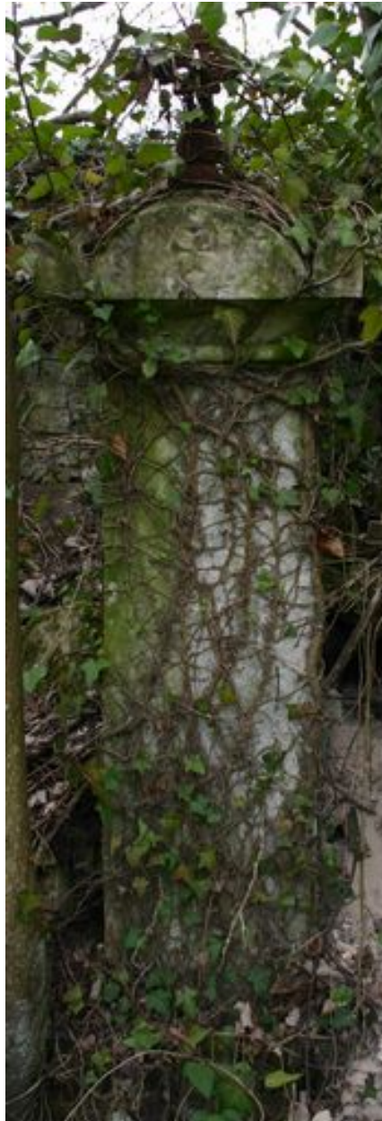
Cippe couronné, vers 1843 ?