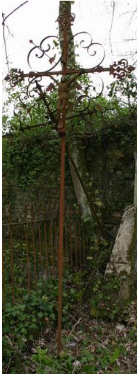
Croix funéraire en fer forgé (1ère).