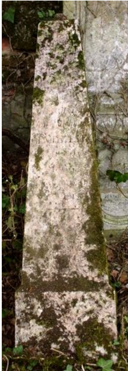
Stèle trapézoïdale, vers 1868.