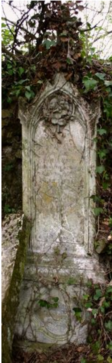
Stèle funéraire d'Adolphe Laurent Fouache, vers 1896.