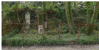
Vue générale. IVR22_20068000905NUCA