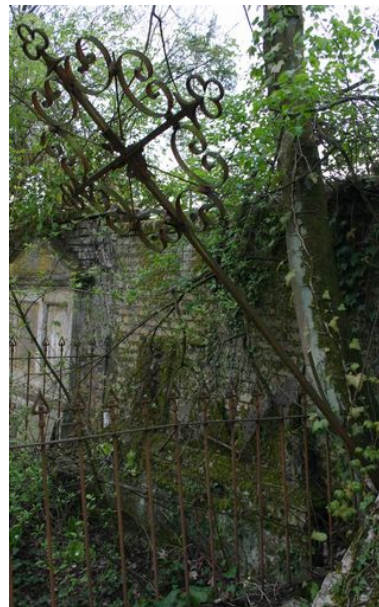
Croix funéraire en fer forgé (2ème).