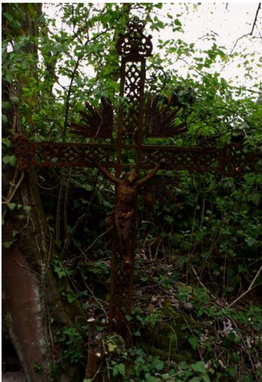
Croix funéraire en fonte (3ème).