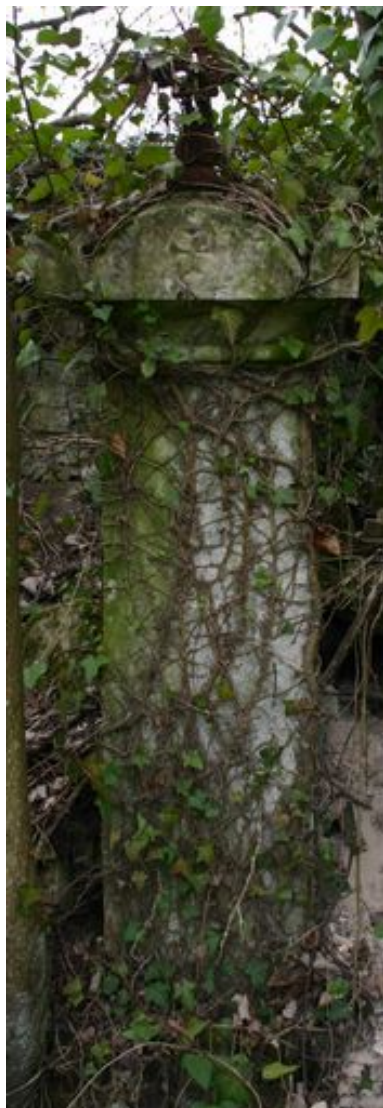
Cippe couronné, vers 1843 ? IVR22_20068000910NUCA