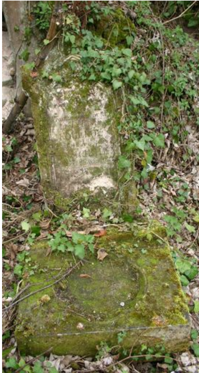
Stèle néo-gothique (vestiges), vers 1877.