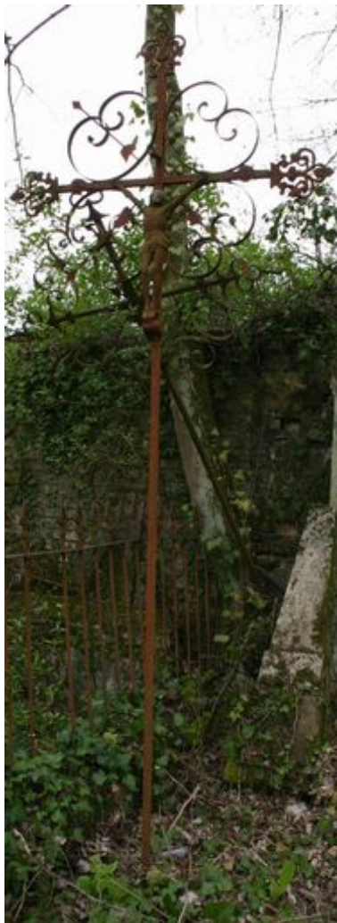
Croix funéraire en fer forgé (1ère). IVR22_20068000906NUCA