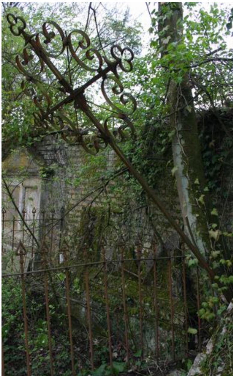
Croix funéraire en fer forgé (2ème).