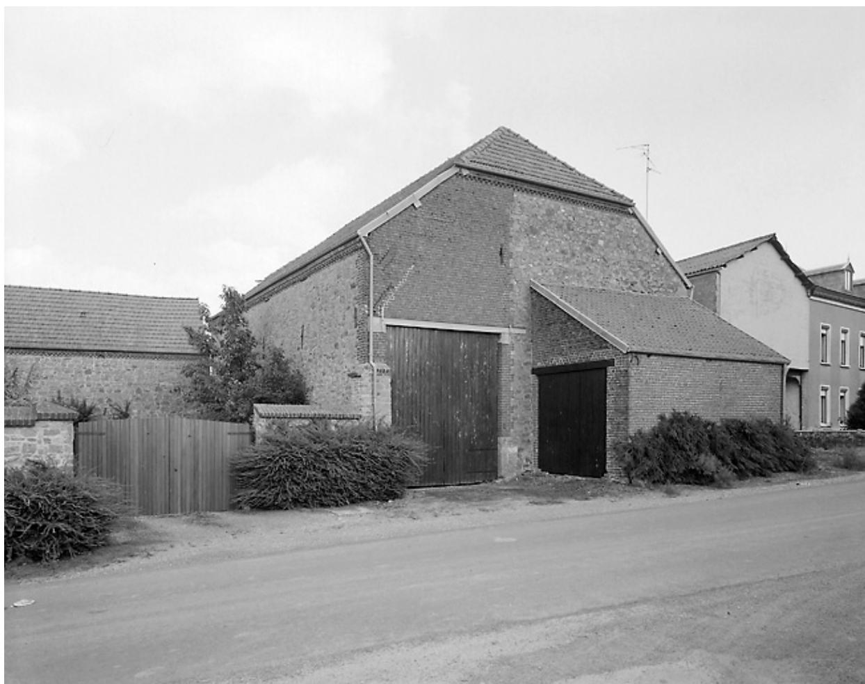
Vue de la grange.