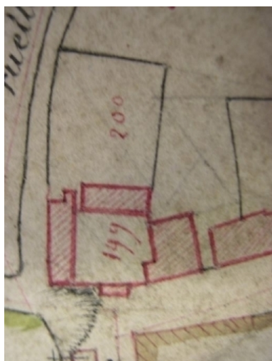
Extrait de la feuille cadastrale D. Plan de situation en 1810. IVR31_20045905226NUCA