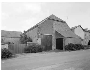
Vue de la grange. IVR31_20055904656V