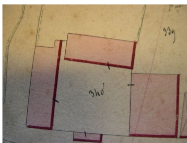
Extrait de la feuille cadastrale D1. Plan de situation en 1845. IVR31_20045905225NUCA