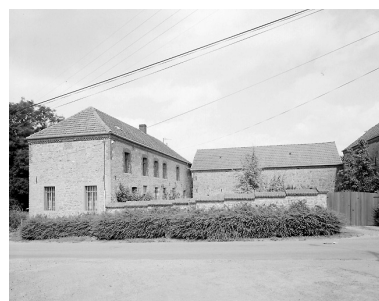
Vue générale. IVR31_20055900578V