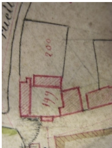
Extrait de la feuille cadastrale D. Plan de situation en 1810. IVR31_20045905226NUCA