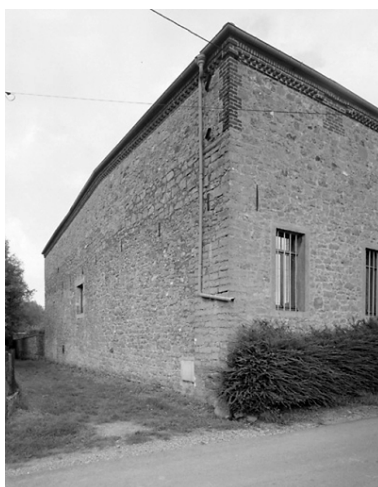
Vue de l'élévation postérieure du logis.