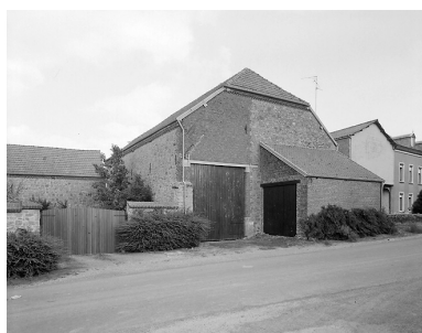
Vue de la grange. IVR31_20055904656V