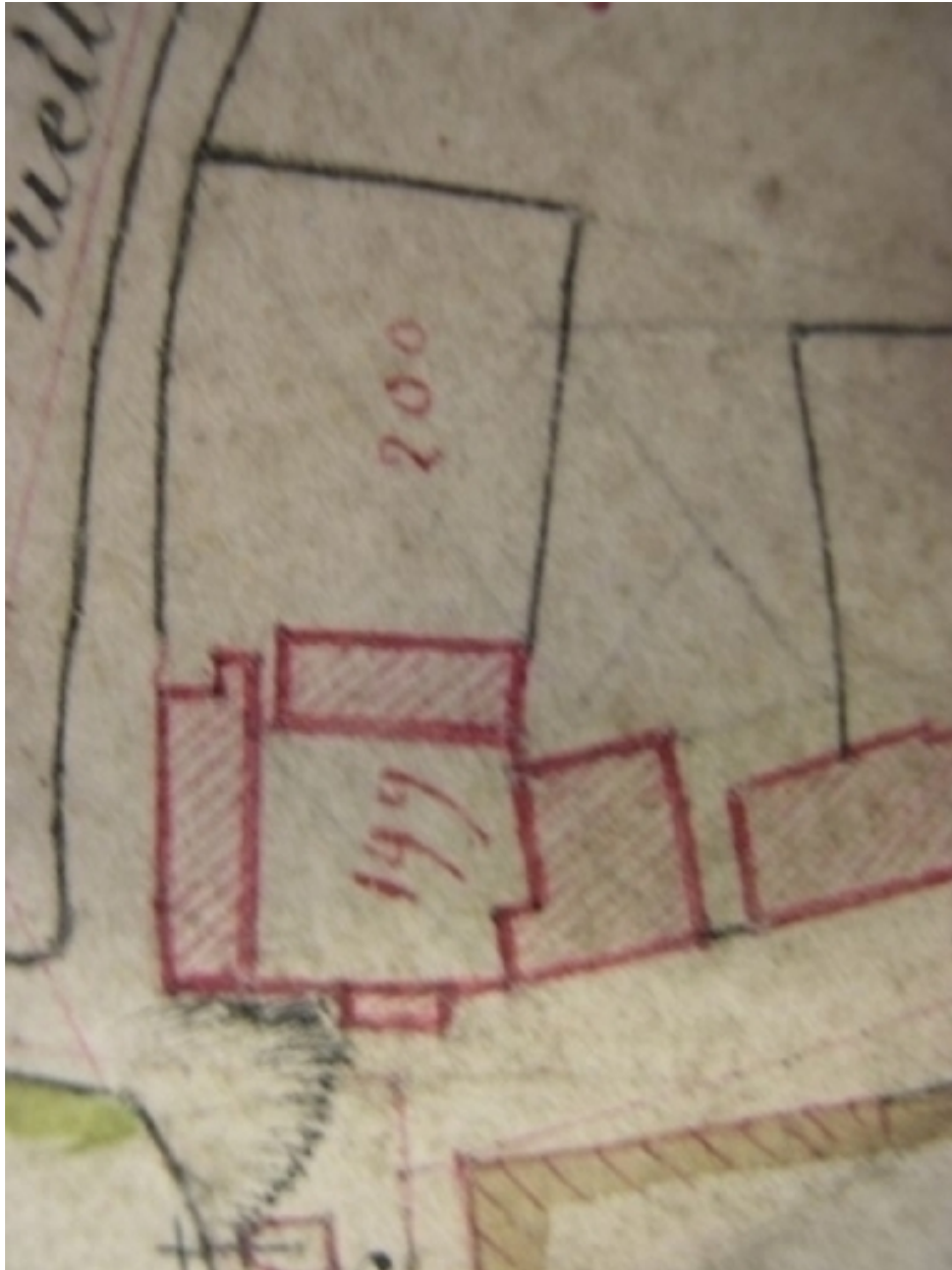
Extrait de la feuille cadastrale D. Plan de situation en 1810.