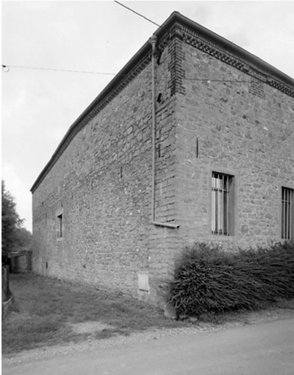
Vue de l'élévation postérieure du logis.