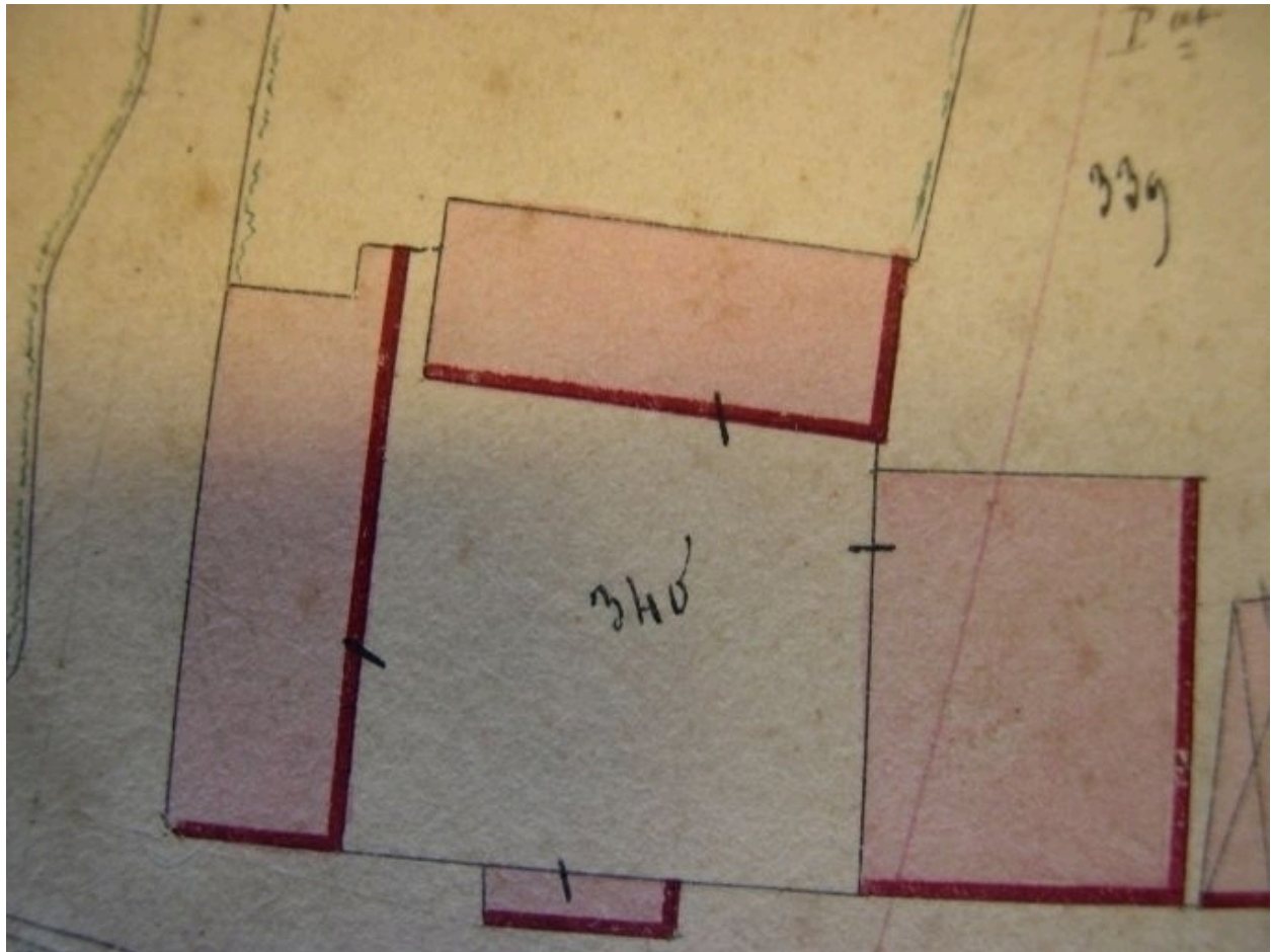
Extrait de la feuille cadastrale D1. Plan de situation en 1845.