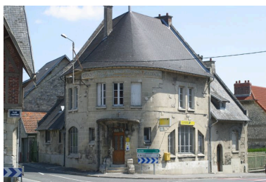
Vue générale. IVR22_20050200622NUCA