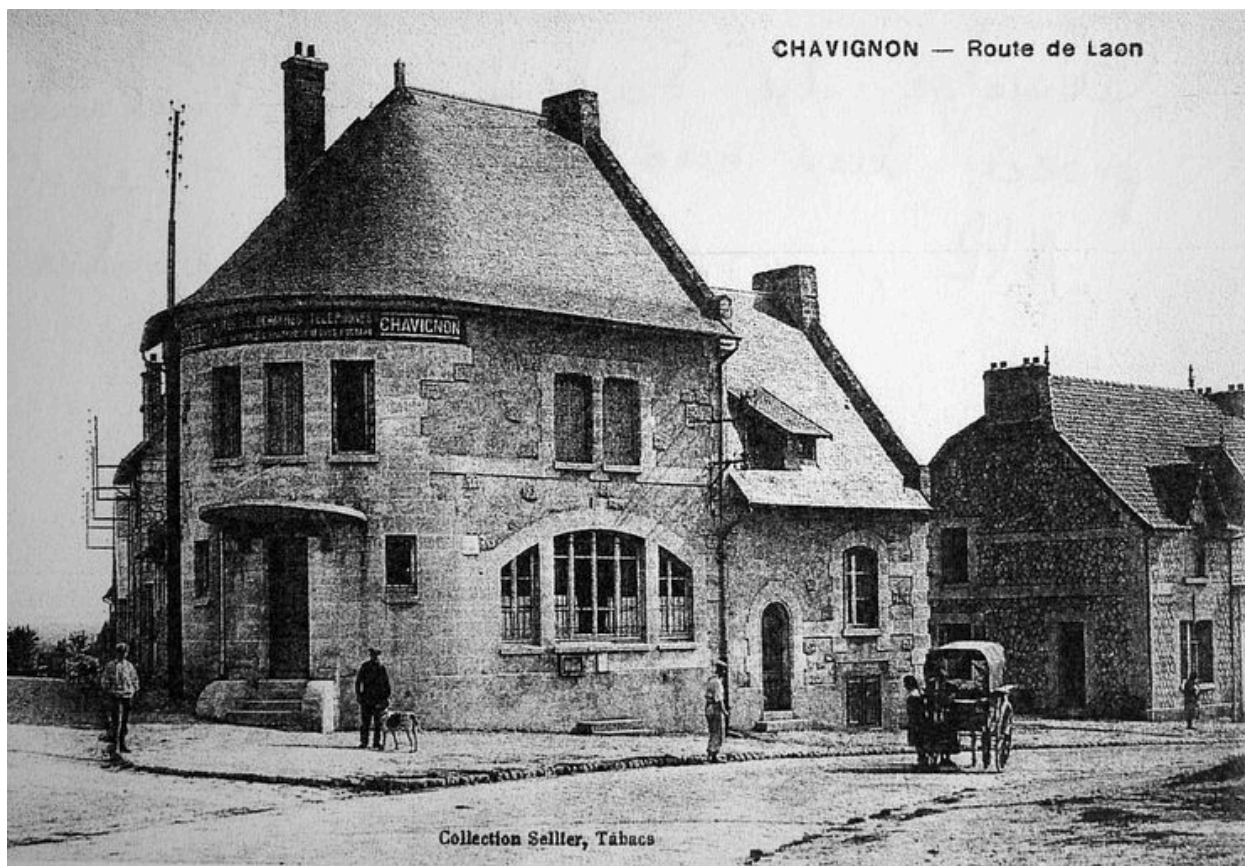
Vue ancienne de la poste (coll. part).