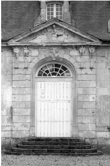
Élévation nord, aile latérale gauche : porte et fronton sculpté (un enfant chevauchant une licorne).