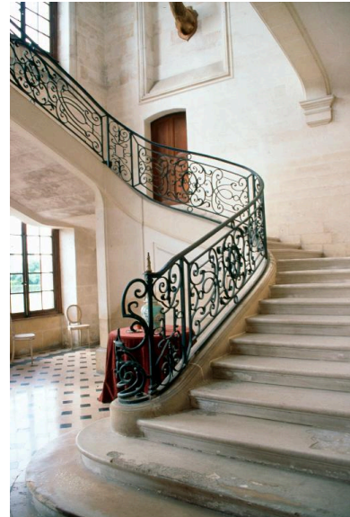
L'escalier d'honneur. IVR22_19998001571ZA