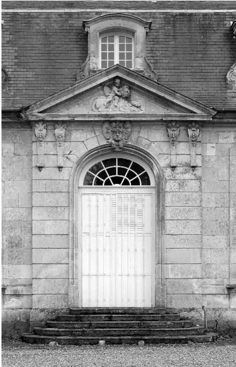
Élévation nord, aile latérale droite : porte et fronton sculpté (un enfant chevauchant un lion).