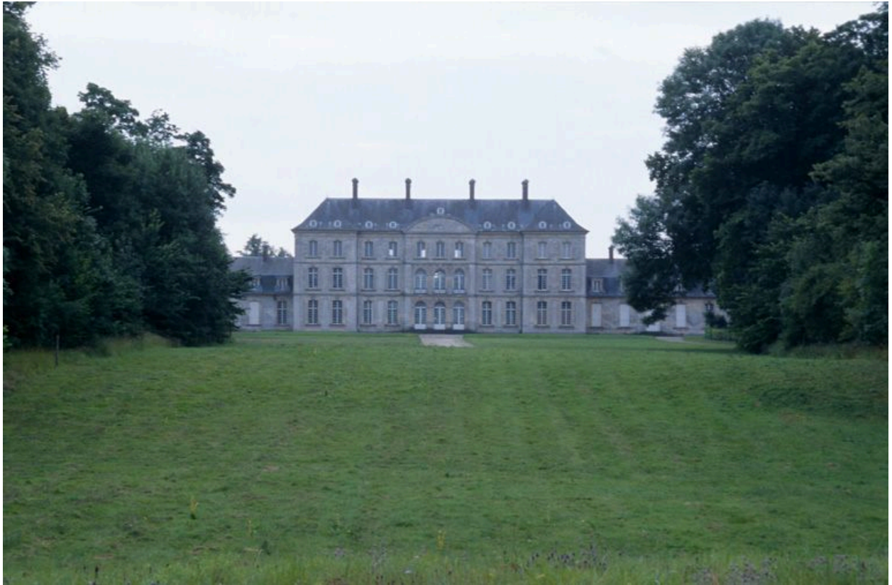
La façade ouest du château.