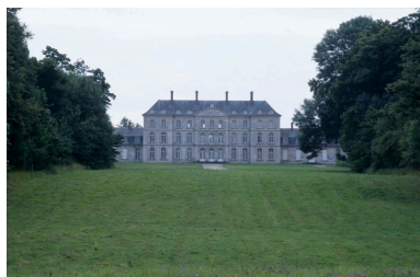
La façade ouest du château.