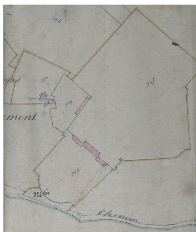
Extrait du cadastre napoléonien (DGI).