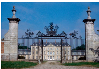
Vue de situation, depuis la vieille route de Villers.