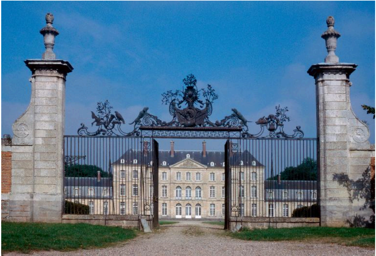
Vue de situation, depuis la vieille route de Villers.