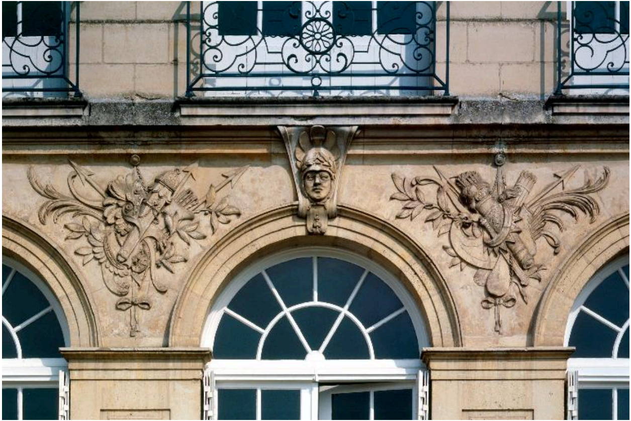
Détail de l'élévation sud : tête d'Athéna et trophées, décor sculpté du rez-de-chaussée.