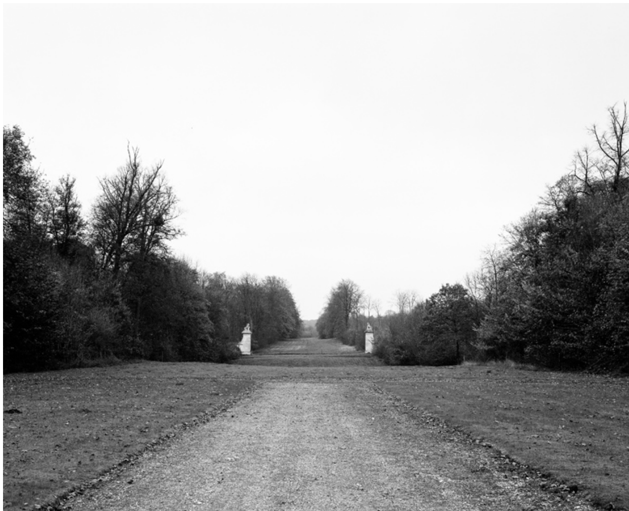
L'allée des Lions, avenue au nord du château.