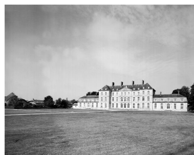
La façade est du château. IVR22_19998001770V