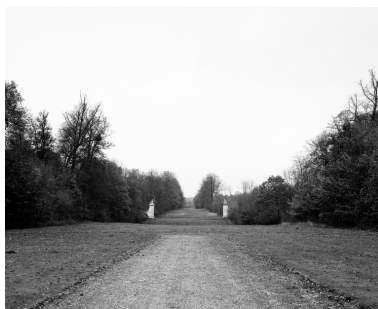
L'allée des Lions, avenue au nord du château.