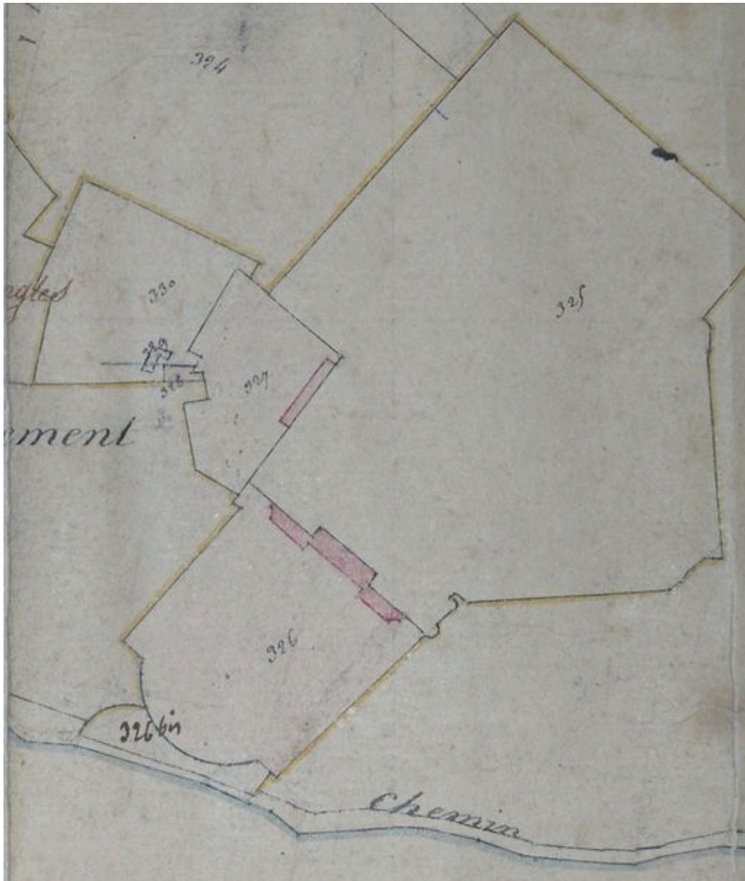
Extrait du cadastre napoléonien (DGI).