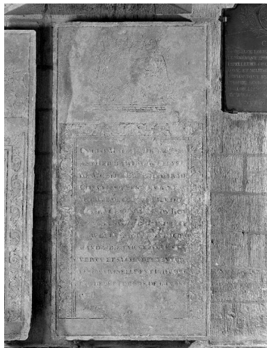
Vue générale de la dalle.